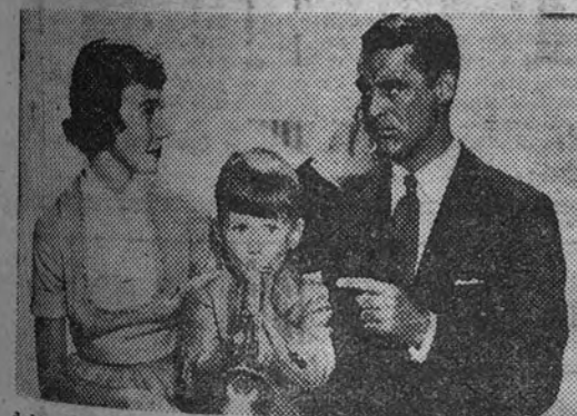
«El milagro del cuadro», de la marca Warner Bros, es el más reciente y mayor éxito cómico salido de los estudios de Hollywood

«El milagro del cuadro», de Metro Goldwyn Mayer, nueva y gran selección de los cines Pompeya y Palace.