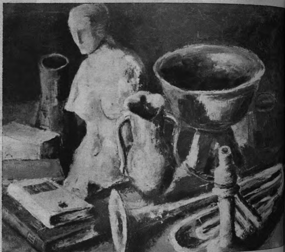
«Composición de la trompeta», Medalla de Plata del Concurso Nacional, por Luis Prades.