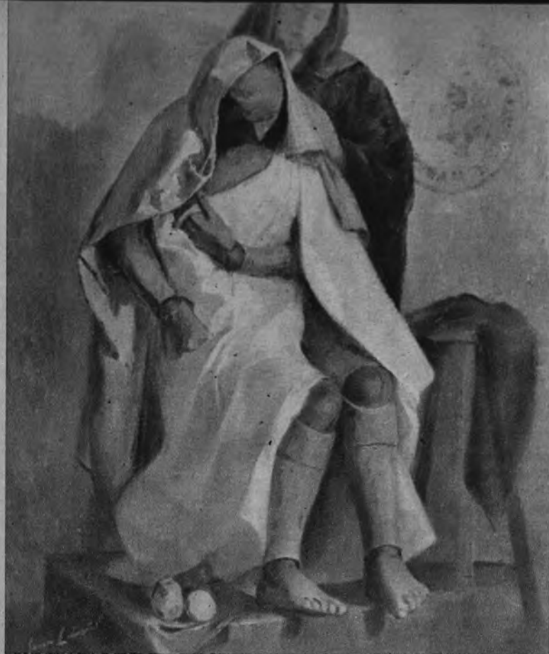
«El maniquí y la modelo», Gran Premio Nacional «José Antonio Primo de Rivera» (25.000 pesetas), de Jenaro Lahuerta.

EL discernimiento de recompensas a los pintores participantes en el II Concurso Nacional y Provincial de Pintura, promovido por la excelentísima Diputación de Alicante, ha sido hecho público oportunamente. La meritoria labor significada por esta empresa de arte en el ámbito alicantino merece ser subrayada con alguna mejor elocuencia que la de la breve noticia. El hecho de haberse tenido en cuenta a la hora de otorgar los premios no sólo las más estimables obras de pintores formados, tal vez maduros, sino las de las más jóvenes promociones con verdaderos aciertos, considerables ya en la ardua ruta del artista, supone un loable sentido de nuestra realidad plástica. Por eso traemos al primer plano gráfico la imagen de las principales pinturas galardonadas; que ellas, mejor que cualquier comentario, pueden pregonar el sentido positivo de este Concurso de verdadero interés para el progreso del arte de pintar en la despierta provincia de Alicante.