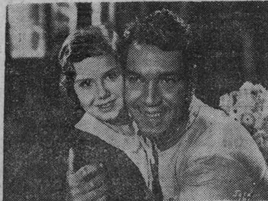
En el Capitol, y presentado por Columbia, reaparecerá el lunes Mario Moreno, «Cantinflas». La nueva creación del gracioso actor mejicano se titula «El bombero atómico»

Atención a la reparación en las pantallas de Madrid del cómico más gracioso de habla española en una hilarante creación, «El bombero atómico», nuevo triunfo de risa y humor.