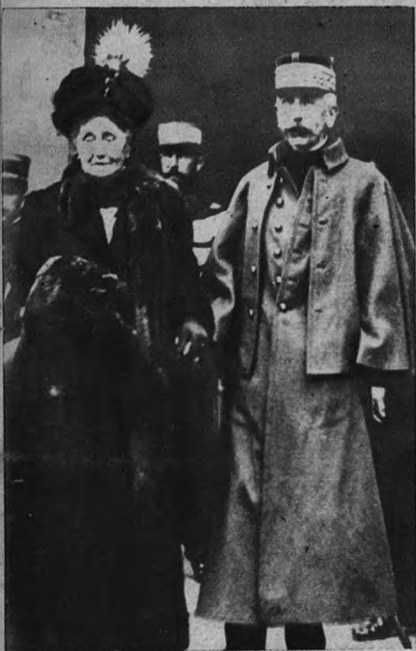
MURIO LA VIUDA DEL MARISCAL LYAUTEY. —Recientemente condecorada por el Gobierno de la IV República, ha fallecido la viuda del mariscal Lyautey, a quien vemos aquí acompañada de su esposo en una foto antigua.