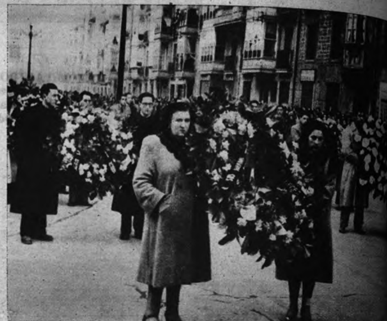
ENTIERRO EN VITORIA. —Compañeros de las víctimas de la catástrofe ocurrida en la pirota Loeza, de la capital alavesa, acompañan el entierro de sus camaradas a través de la ciudad.