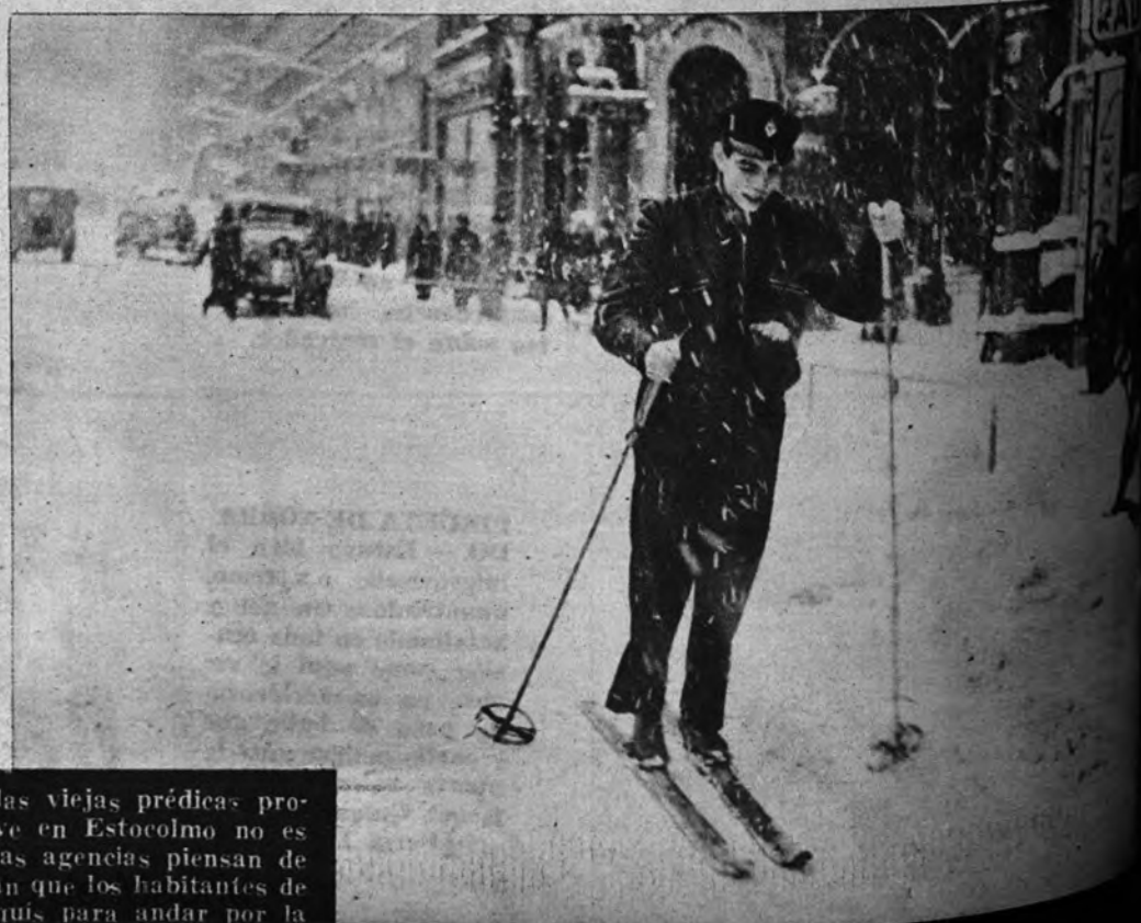
NO ES NOTICIA. —Según las viejas prédicas profesionales, esto de que nieve en Estocolmo no es una noticia. Sin embargo, las agencias piensan de modo distinto y aun subrayan que los habitantes de la ciudad usaron de los esquís para andar por la