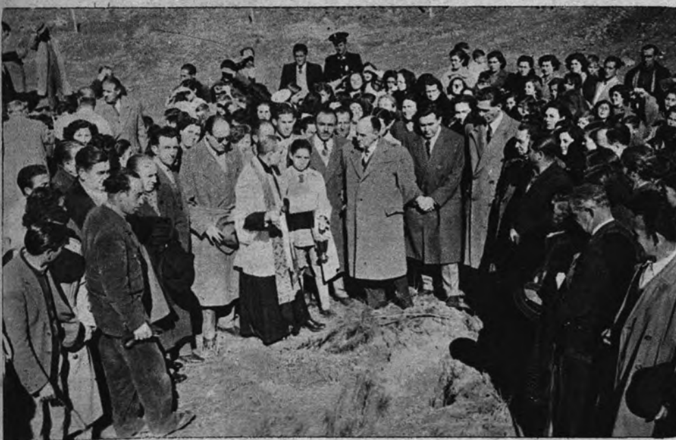
COTO FORESTAL. —El Presidente de la Diputación de Madrid, marqués de la Valdavia, durante el acto inaugural del coto forestal que lleva el nombre de los «Hermanos Sáenz de Heredia», viejos falangistas muertos por la Patria.