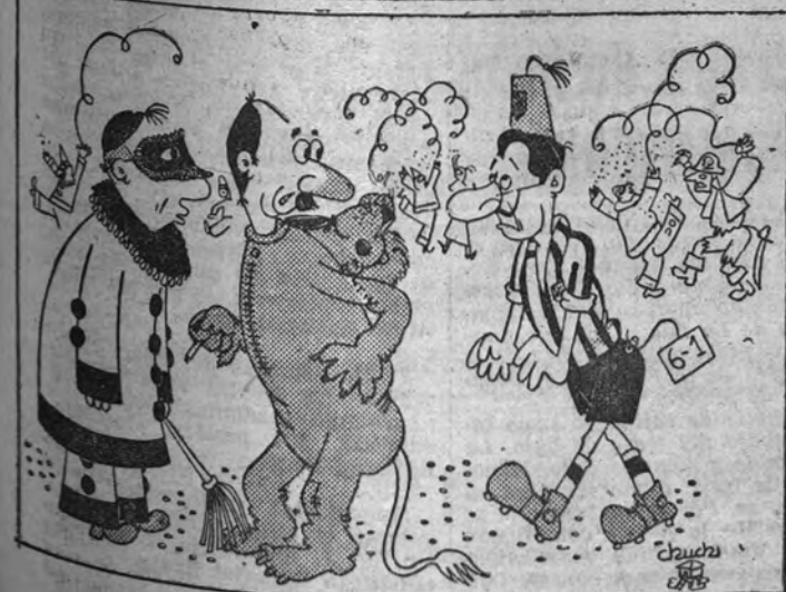
—¡Ese sí que está desconocido!