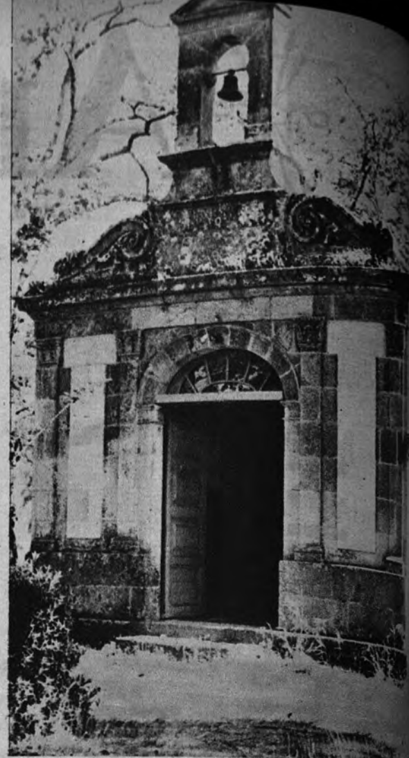
La campana de la capilla de la isla de San Simón anunciará ahora una nueva alegría.

El citado Hogar consta de varios pabellones y dependencias. El que podríamos llamar central, de tres plantas, está destinado para aulas, dependencias y viviendas para el Director y profesorado. Existe luego el pabellón número uno, íntegramente destinado a dormitorios; el segundo, con talleres en la planta baja y dormitorios, y el tercero, para comedores, además de otros, entre los que figura el Pabellón Sanitario, espléndidamente acondicionado, así como la capilla, situada en el centro de la isla.