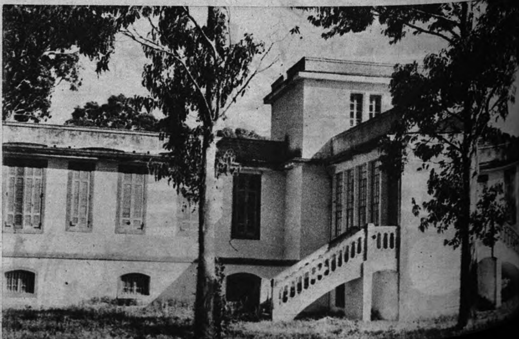
Este es el pabellón destinado a los servicios sanitarios del Hogar en la isla.