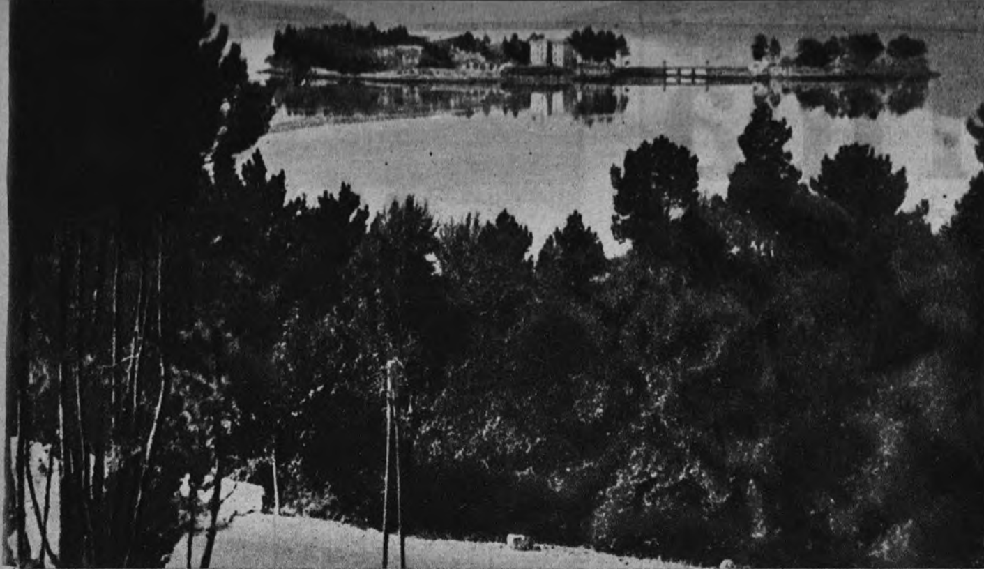
Desde la carretera, panorámica de la Isla de San Simón en la ensenada de Rande.