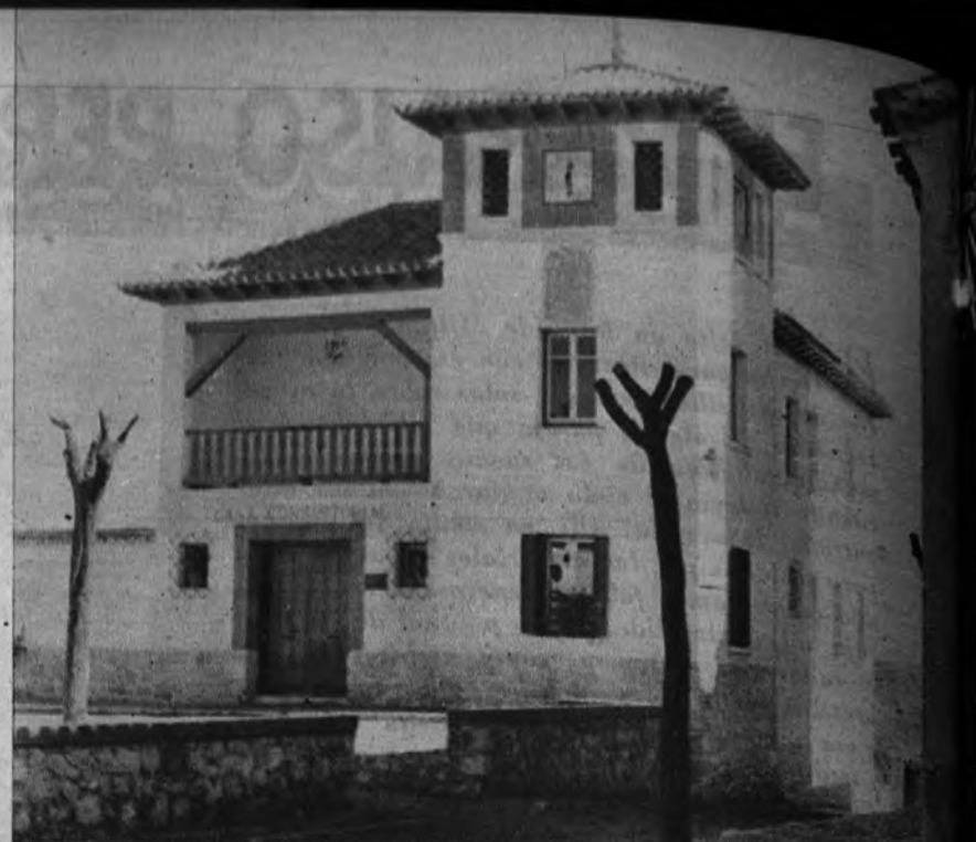
CADA SEMANA UN EDIFICIO NUEVO. —El Jefe Provincial de la Falange madrileña inauguró un edificio de nueva planta destinado a servir de Casa Ayuntamiento en el pueblo de Puzos de las Torres.