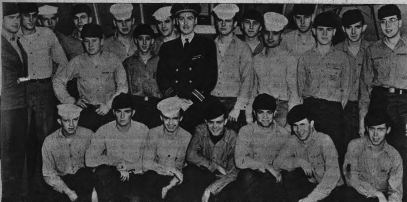
RESISTENCIA BAJO EL AGUA. —Estos son los tripulantes del submarino norteamericano «Haddock», encargado de determinar la resistencia humana bajo la superficie del mar. Marcarán el tope a los sumergibles atómicos.