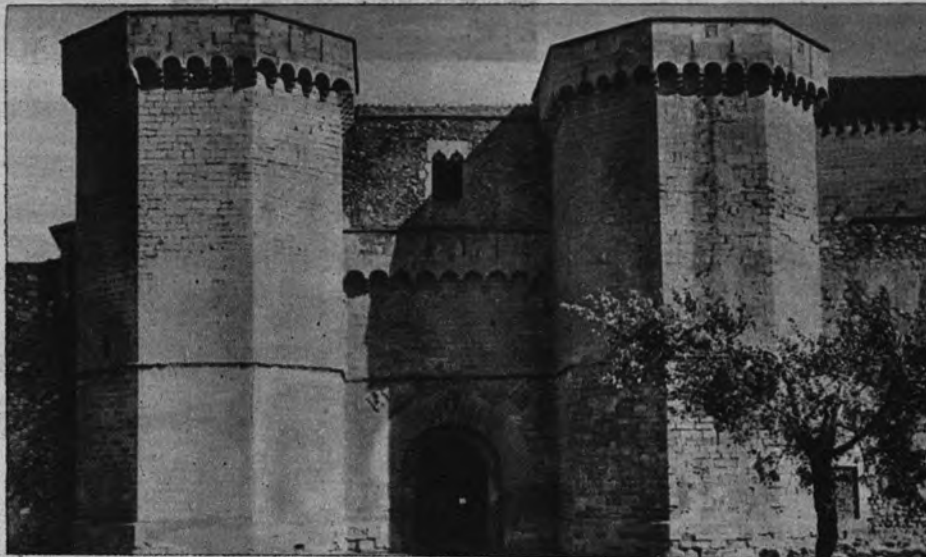
LA PUERTA REAL DE POBLET. —La mole de piedra cuajada de tradiciones seculares y costeada por el Rey Pedro IV de Aragón fué testigo hace unos meses de la visita del abad general del Cister, cuyos restos mortales acaban de traspasar esta puerta real para descansar definitivamente tras sus muros.

tu católico dispuesto a co'aborar en la fundación de centros de vida monástica, se incorporó en seguida al movimiento reformador. Alfonso VII, entusiasta del Cister y admirador del infatigable San Bernardo, protegió primero la fundación de Moreruela, primer monasterio cisterciense español, construido en 1131, y más tarde los de la O'iva, Fitero, etc. Cuando murió San Bernardo, España contaba con veinte monasterios cistercienses.