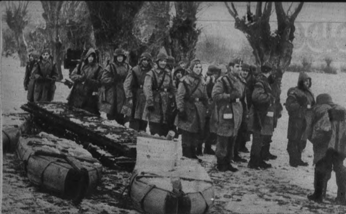
SUPUESTO TACTICO. —Los caballeros cadetes de la Academia de Ingenieros de Burgos se disponen a tender un puente sobre pontones con ayuda de botes neumáticos. El Capitán General de Burgos presenció la operación.