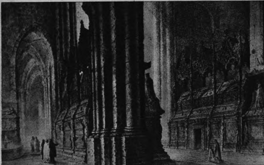
FOBLET, PANTEON REAL. —Precisamente la visita realizada por el abad Quatember a España, meses antes de su muerte tuvo por objeto asistir al traslado de los restos de Monarcas españoles a su antiguo panteón, destruido en 1854. La foto reproduce un dibujo de dicho panteón real antes de su destrucción.