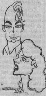
Alan Ladd y Phyllis Calvert

Esta película es una más en su género y se basa, según se afirma al comienzo, en un hecho verídico ocurrido a un inspector de Policía adscrito al Servicio de Correos de los Estados Unidos, que aclaró el misterioso asesinato de un compañero suyo—el cadáver apareció en La Porte y la única testigo que puede identificar a los que le transportaban es una monja, sor Agustina—al ingresar en una banda de atracadores y ganarse su confianza. Para sostener la nota de interés—pero no de emoción, que es la ciertamente importante—incurre en frecuentes ingenuidades. No se comprende la actuación imprudentísima del inspector Al Coddard—papel que interpreta Alan Ladd, ese Buster Keaton de las tramas de gángsters, pero de una impavidez, de una monotonía sin gracia—en una ciudad pequeña como Gary. Ni la