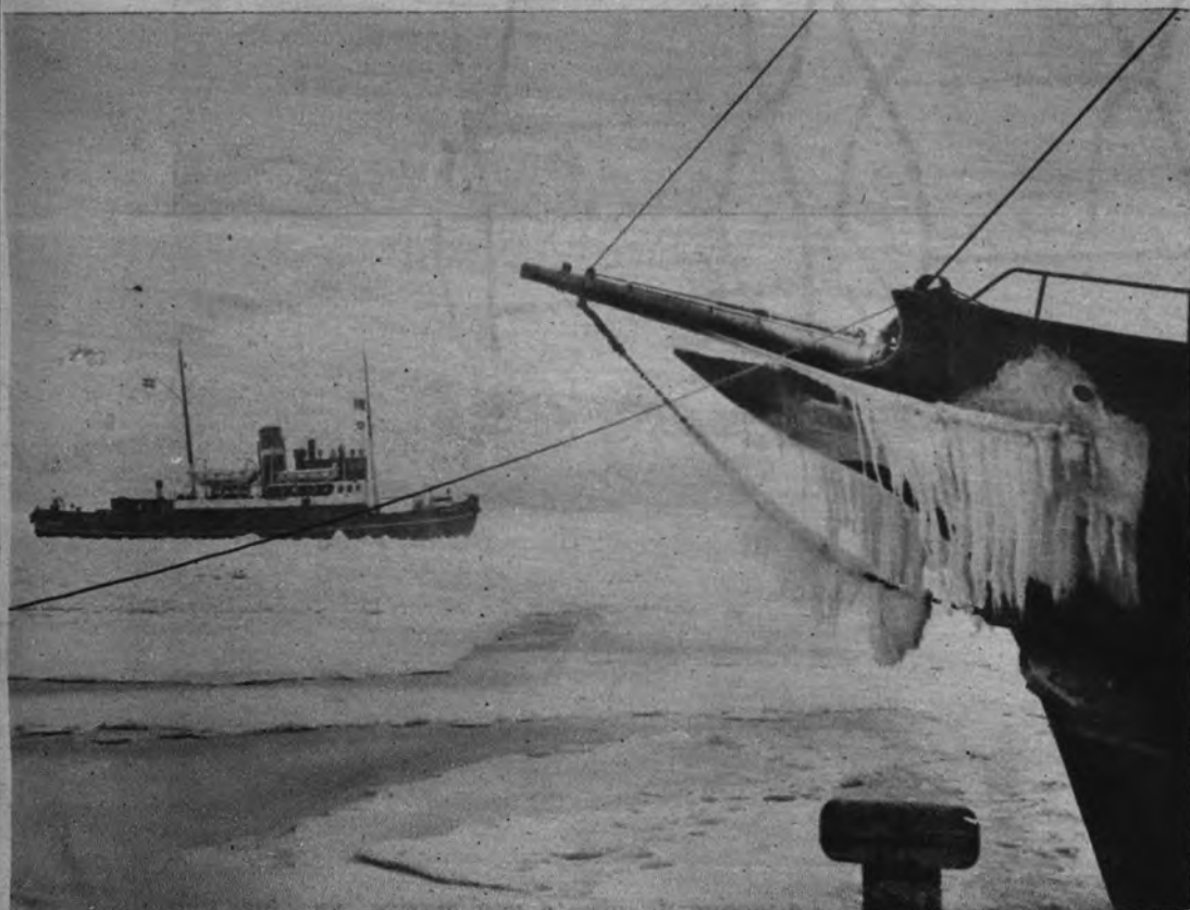
ROMPEHIELOS EN COPENHAGUE. —Solamente los buques de gran porte pueden salir o entrar en Copenhague sin ayuda de rompehielos. Las pequeñas embarcaciones necesitan la ayuda de estos barcos especiales.