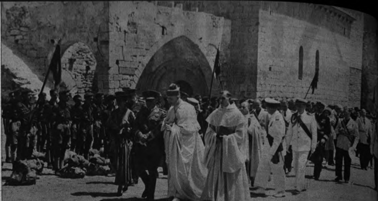
«AMATOR POPULETI ET HISPANIAE». —En la lapida mortuoria del abad Quatember figurará esta inscripción por voluntad propia del finado. Nuestro Caudillo, que acompañó al ilustre monje en su reciente visita al monasterio, como lo atestigua la foto, premió este amor a España con la Gran Cruz de Isabel la Católica.

España, que en aquella época—como en todas las que registran importantes etapas en la historia de las Ordenes religiosas—mostraba su espíri-