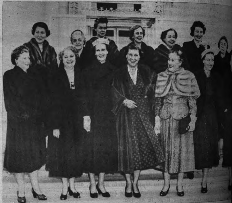
COMIDA FEMENINA. —La señora del Presidente Eisenhower, fotografiada en las escalinatas de la Casa Blanca con todas las esposas de los ministros y altos oficiales de la nación, a las que obsequió con una comida.