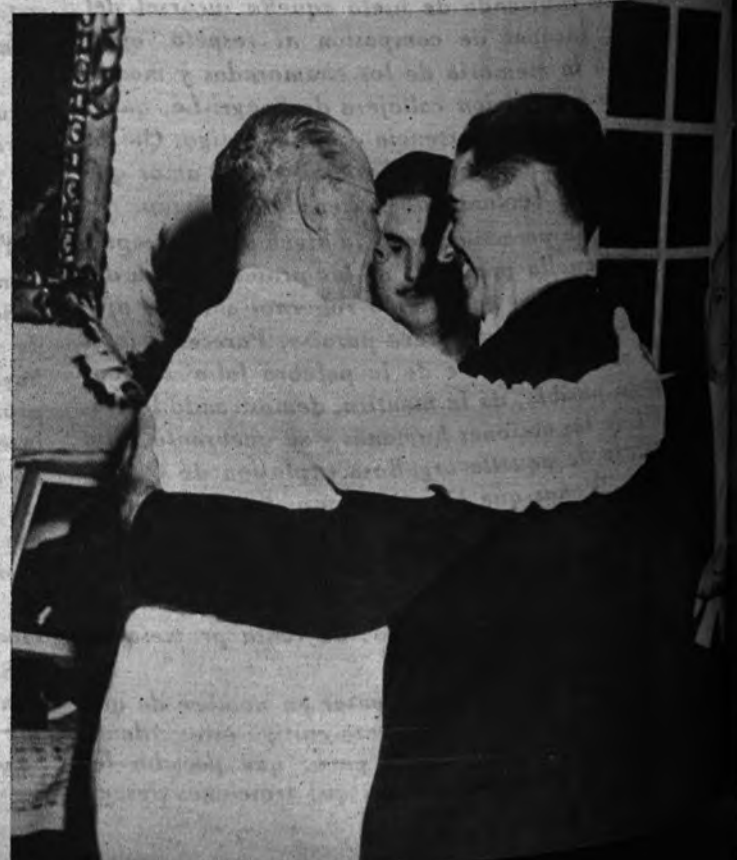
IMPOSICION DE CONDECORACIONES. —Nuestro embajador en Río de Janeiro condecoró a diversas personalidades de la intelectualidad brasileña con las Placas de Miembros del Instituto de Cultura His-