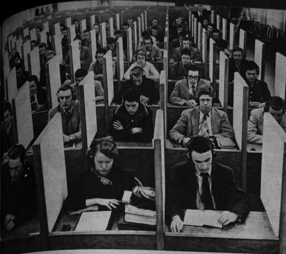
En sus cabinas individuales, los alumnos escuchan la lección que el profesor graba hace horas, y ellos pueden hacerse repetir