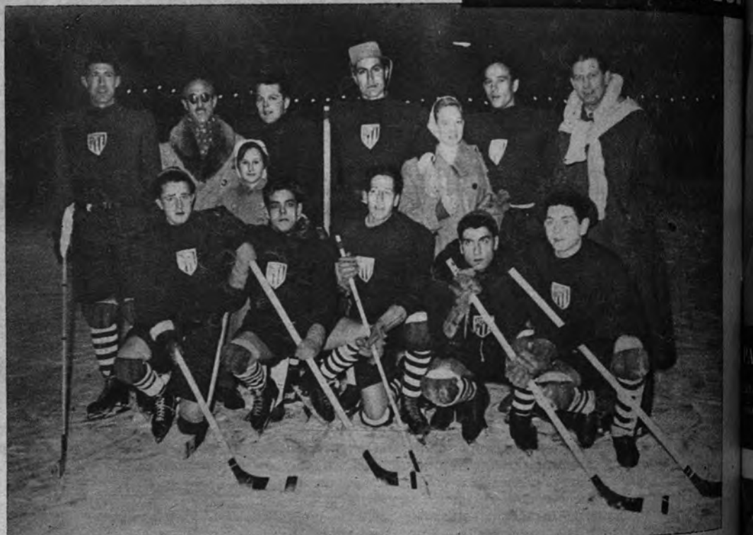
ATLETICO, CAMPEON. —En Nurio se ha proclamado campeón de España de hockey sobre hielo el Atlético madrileño, que en la final venció al Club local por trece tantos a cero, consiguiendo así la Copa de Su Excelencia.— (Foto Cifra.)