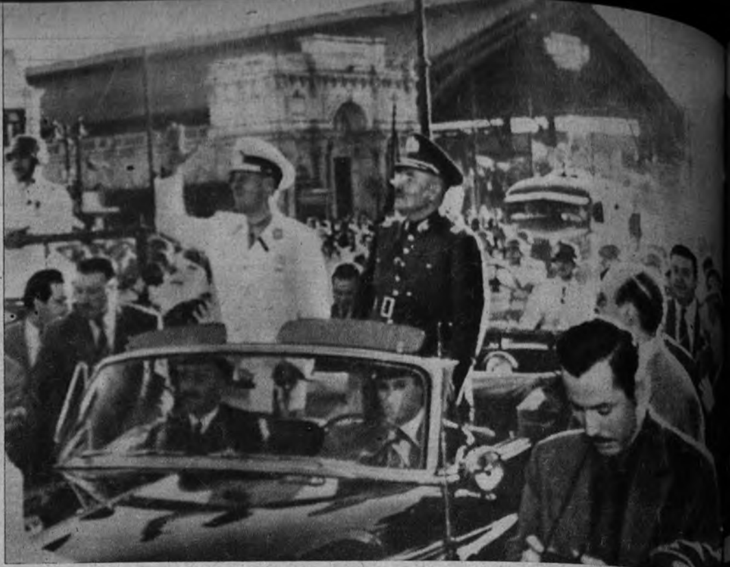
DOS PRESIDENTES HISPANICOS. —El general Perón entra en Santiago de Chile por la estación de Mapocho, acompañado por el general Ibáñez, Presidente de la República chilena. La multitud los aclamó fervorosamente.