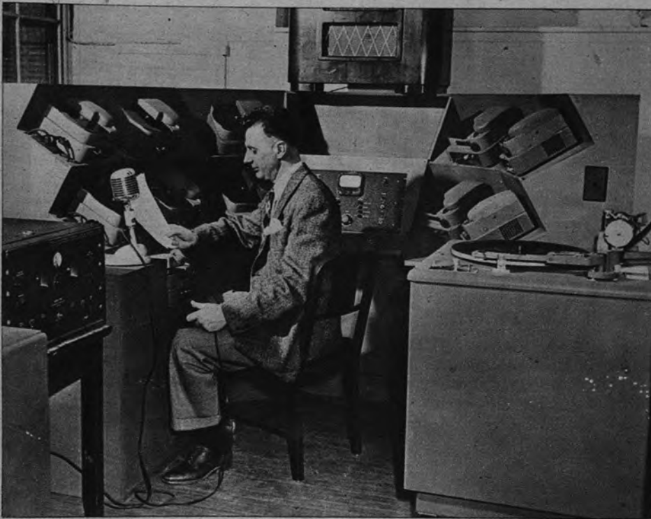
El profesor electrónico dicta apaciblemente sus enseñanzas ante el micrófono. Nada perturba, pues, la buena marcha de sus lecciones