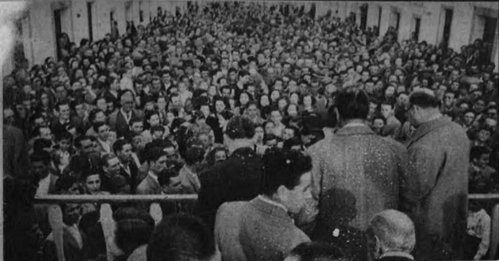
VEINTE VIVIENDAS PROTEGIDAS. —En el pueblo de Hinojos, provincia de Huelva, se celebró el acto de entrega de veinte viviendas protegidas. Presidió el Jefe Provincial y Gobernador Civil, camarada Summer.