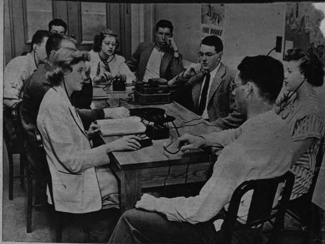
Los alumnos, esta vez ante el propio profesor, repasan sus grabaciones para la mejor corrección del acento y de la sintaxis