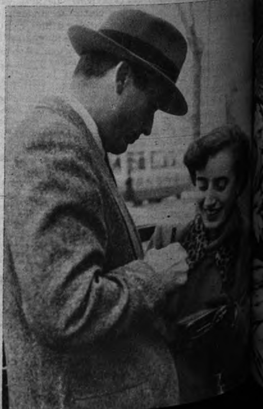
A LA ATENCION DE LOS CAZADORES DE AUTOGRAFOS. — Gregory Peck, el famoso astro de la pantalla, firma en el álbum de una señorita barcelonesa. Está en la Ciudad Condal de paso y piensa permanecer varios días en Valencia.