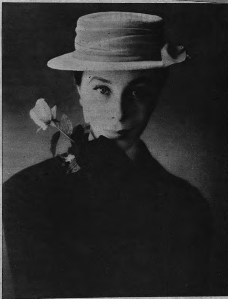
Bettina presenta a "Pedro", sombrero color de rosa, de Svend, con cinta del mismo tono; el color de moda de la primavera

Quiero decir que el «beige» será el color de todas las mujeres y de todas las ocasiones, si bien muchas mujeres, para algunas circunstancias o días especiales, reserven el rosa-Francia, color de moda. Tan delicado, frágil y poético,