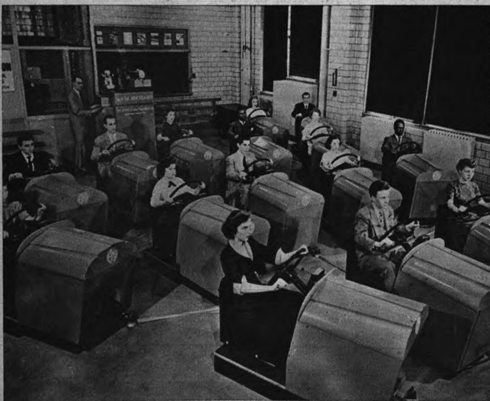
ACADEMIA DE AUTOMOVILISMO. —A la consideración de nuestros empresarios de docencia automovilística brindamos esta fotografía, en la que se aprenden las primeras lecciones sobre vehículos inmóviles que, sin embargo, poseen el mecanismo completo de los de verdad.