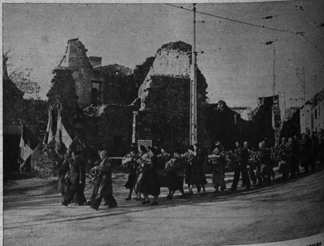
MANIFESTACION ANTIALSACIANA EN FRANCIA. —Más de dos mil personas de la comarca se dirigieron en peregrinación a las ruinas de Oradour-sur-Glane, en Francia, para protestar de la amnistía concedida por el Parlamento a los trece alsacianos que tomaron parte en los hechos de Oradour durante el tiempo de dominación alemana.