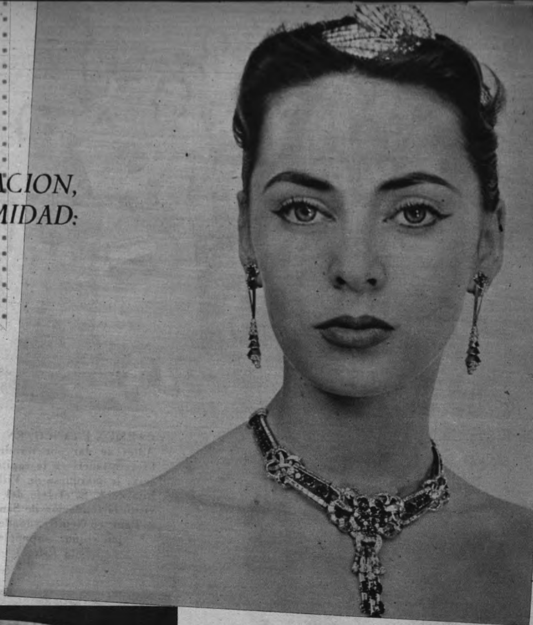
(Joyas de Bry, de París.)

Antes que ese color, convendría escoger, por