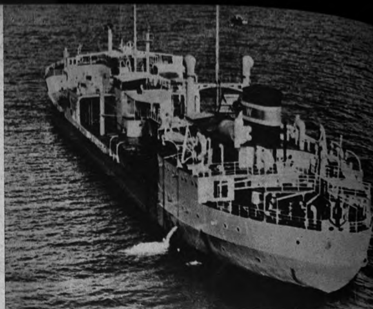
CONTRABANDISTA VALIENTE. —Aunque no muy simpático, este contrabandista no carece de valor. Se trata del petrolero finlandés «Wilna», que va cargado de combustible para los aviones a reacción de la China roja. Los que no son tan valientes son los chinos, que lo vigilan sin decidirse a recoger el material.