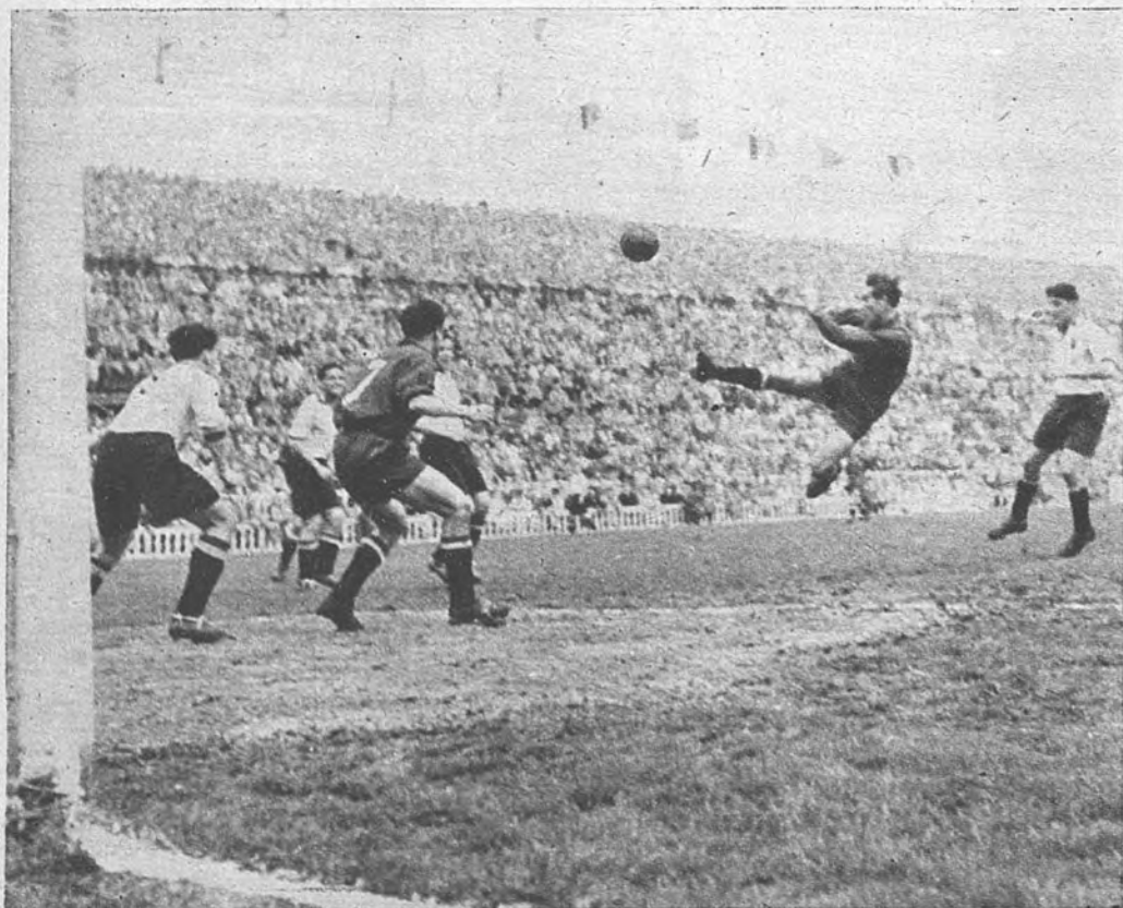
CONTINUA EL ACOSO. —La tónica del partido fué el forcejeo de la delantera española contra la defensa—reforzada en cantidad, pero no muy orde-