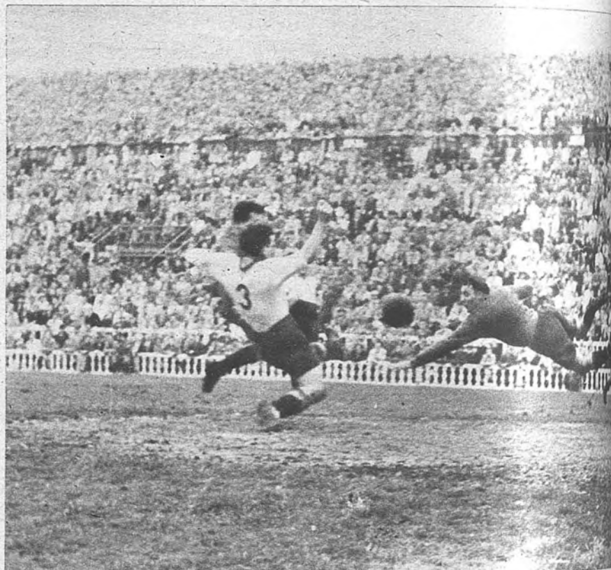
EL TERCER GOL DE ESPAÑA. —Esta vez la furia española se ha aminorado. Y es un cabezazo impresionante de un jugador temperamentamente frío. Y es un cabezazo impresionante de un jugador temperamentamente frío. Y es un cabezazo impresionante de un jugador temperamentamente frío.