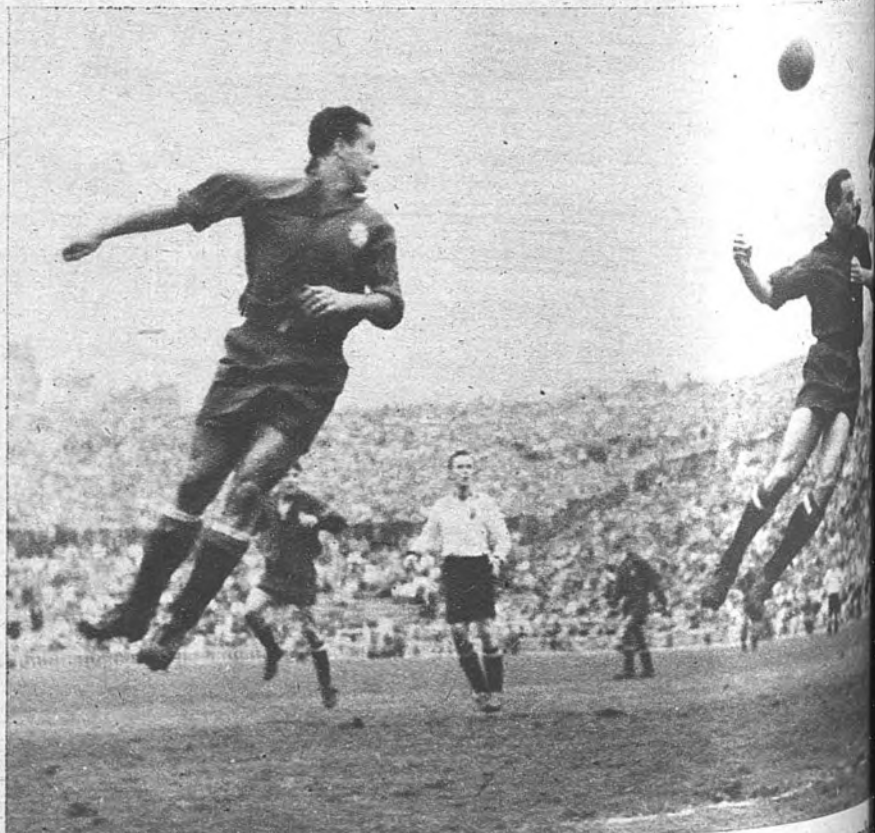
JUEGO DE ALTURA. —Los dos interiores españoles, jugadores cerros-cien por cien, saltan frente a la meta belga para disputar un balón de