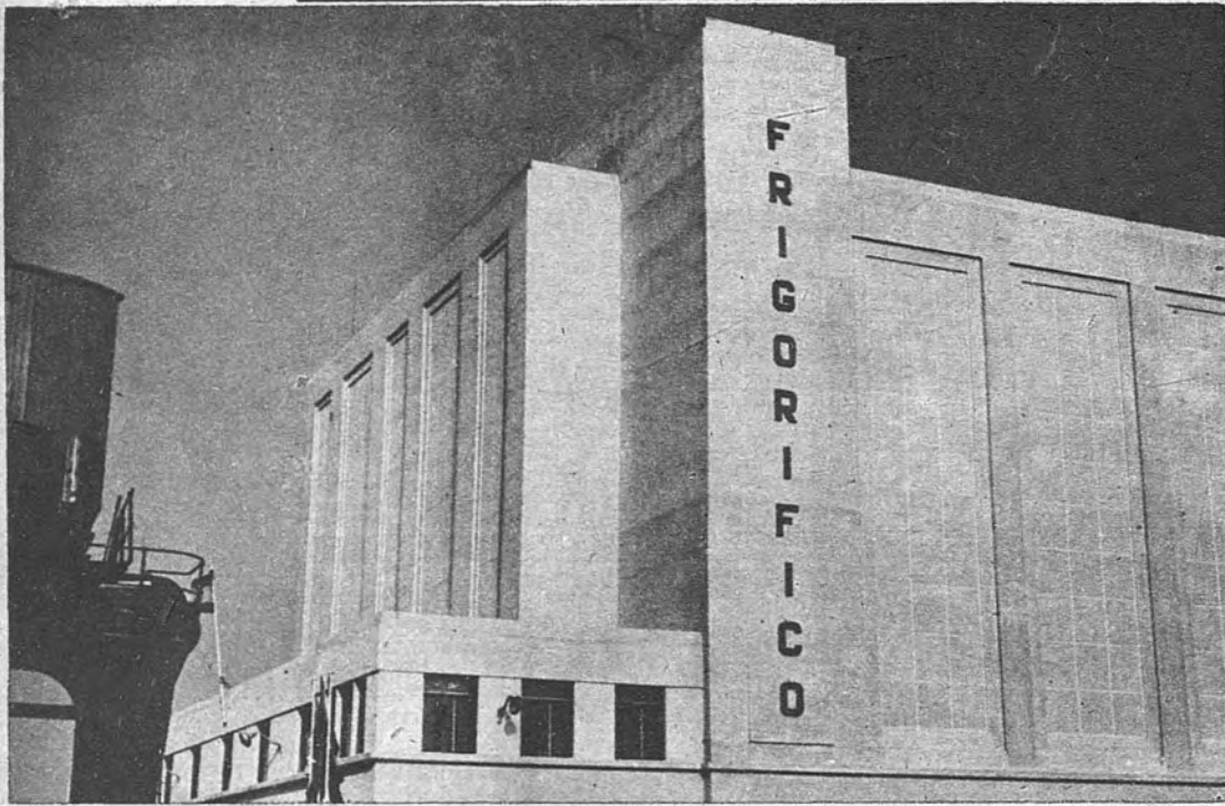
EL FRIGORIFICO MAS IMPORTANTE DE EUROPA. —Este es el establecimiento frigorífico inaugurado por el Caudillo en Cádiz. Es el primero de la red que el I. N. I. ha proyectado. Tiene una capacidad de congelación de veinticinco toneladas por día.