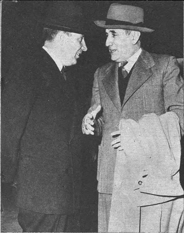
EL MINISTRO DEL EJERCITO, EN LISBOA. —El teniente general Muñoz Grandes, Ministro del Ejército, es recibido en el aeródromo lisboeta por el ministro portugués de Defensa, coronel Santos Costa. El Ministro español asistió, especialmente invitado, a unas maniobras del Ejército luso.