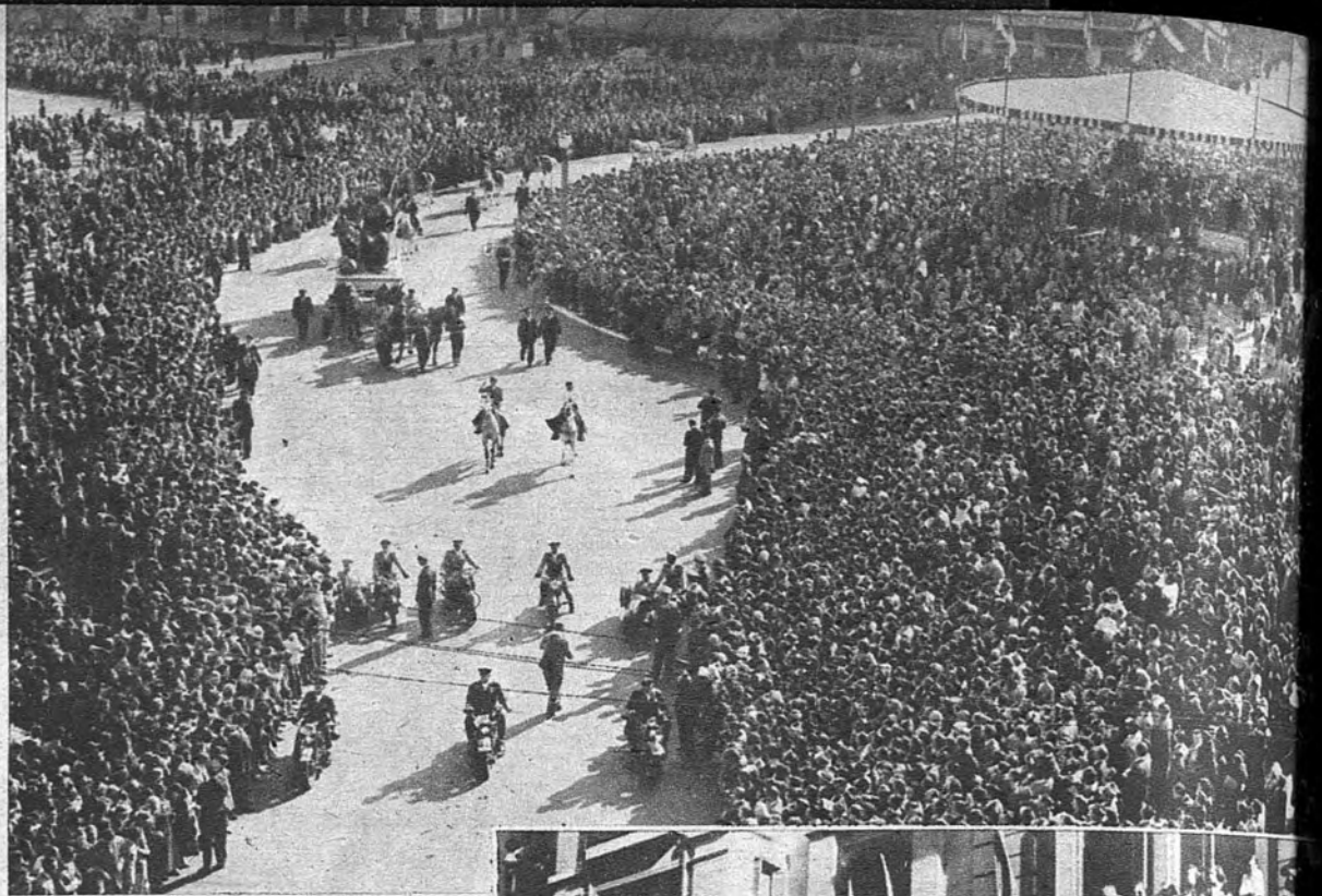
DÍA DE LA HISPANIDAD EN BUENOS AIRES. —Una extraordinaria muchedumbre presencia el tradicional desfile del 12 de octubre celebrado en Buenos Aires. Las carrozas, como puede verse, interpretaban diversos motivos alegóricos de tipos y costumbres españolas.