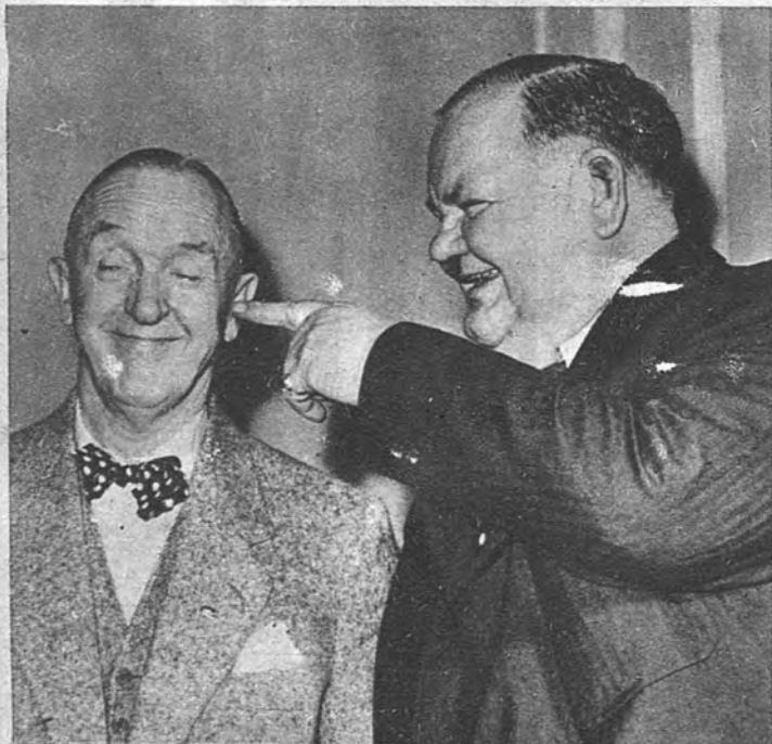
OTRA VEZ JUNTOS Y DIVERTIDOS. —Los famosos Laurel y Hardy están otra vez juntos. En un hotel de Londres ofrecieron una recepción a la Prensa para anunciar su reencuentro artístico. He aquí un momento de sus declaraciones a los periodistas.