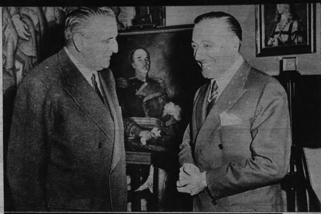
CON EL MINISTRO DE ASUNTOS EXTERIORES. —Don Héctor J. Campora, durante su visita al Ministro español de Asuntos Exteriores, don Alberto Martín Artajo

Las ocasiones de amistad entre España y la Argentina forman ya un largo rosario desde el día aquel en que el aislamiento de España fué roto por el gesto noble del general Perón. Pero en este largo y apenas interrumpido rosario hay a veces acontecimientos extraordinarios, como el de la visita que nos hizo Eva Duarte, como la firma del Protocolo o como la visita de este embajador extraordinario que es don Héctor J. Campora, diputado de la Cámara de su país, y hasta hace poco tiempo presidente de dicha entidad legislativa.