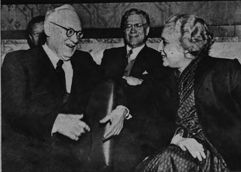
AMABLE COMPONEDORA.—La presidenta de la Asamblea General de las Naciones Unidas, Vijaya Lakshmi de Pandit, muestra su afán de universal diálogo en conversación con el rey de los monólogos, compañero Vichinski, representante de la U. R. S. S., en lo que la señora Lakshmi quiere transformar en amena tertulia