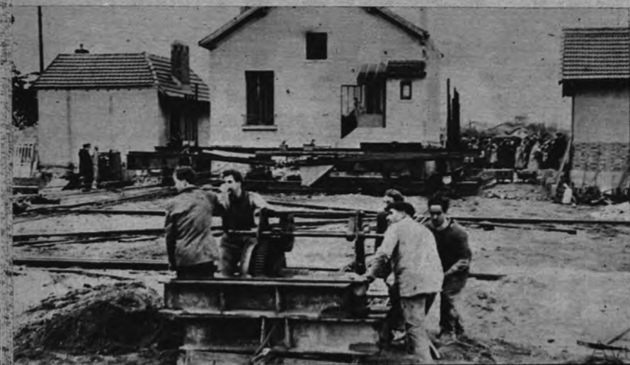
CON LAS CASAS A OTRA PARTE.—Para abrir una nueva avenida en Nanterre, tres casas han sido desplazadas sobre railes unos ochenta metros. Este es un momento de la operación de traslado