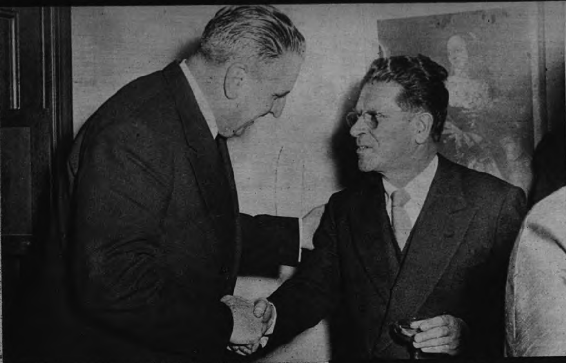
EN LA EMBAJADA DE BOLIVIA.—El embajador de Bolivia saluda al señor Martín Artajo durante la recepción celebrada en la Embajada boliviana en honor del Ministro de Asuntos Exteriores de España