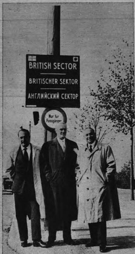
SE ABANDONA LA LIBERTAD. —Un cartel en tres idiomas advierte a los españoles que a partir de aquí se encuentran ya al otro lado del «telón de acero».