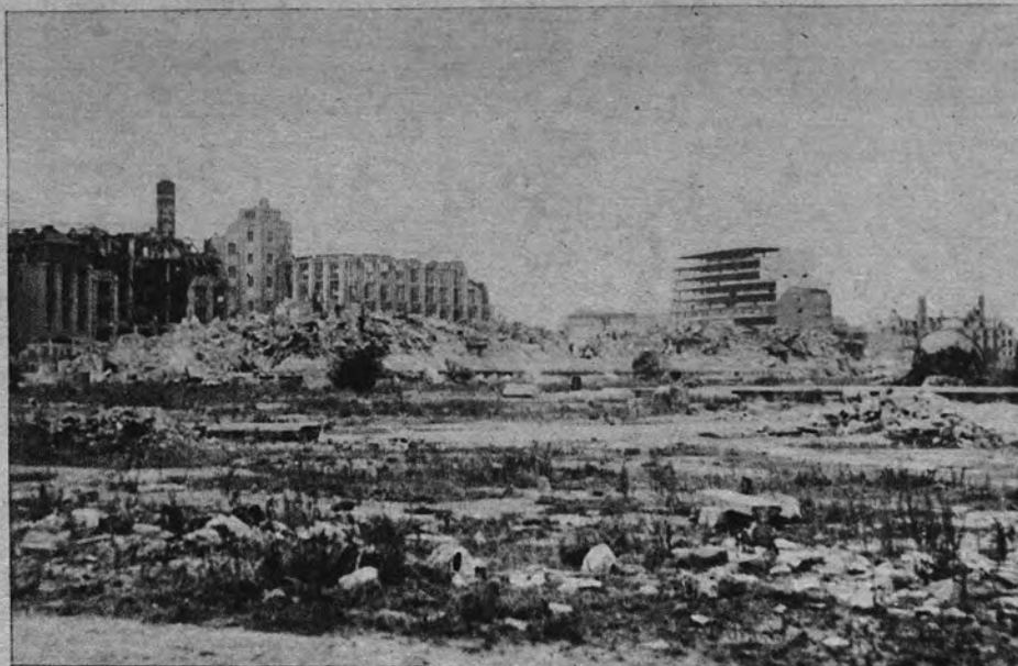
LA FRONTERA DE DOS MUNDOS. —Estas ruinas marcan la división entre los sectores occidentales y oriental de Berlín. Es un infierno de piedras convulsionadas

Puerta de Brandeburgo y control soviético. El chófer cambia unas palabras con el centinela y los pasaportes de los españoles desaparecen para ser devueltos con todos los sellos habidos y por haber. Pero evidentemente una mano protectora ha saltado la fiscalización directa de los rusos. El Reichstag quemado, la Cancillería, la Puerta con la bandera roja, quedan atrás. Ahora el Unter der Linden. Desde la ventanilla del automóvil los ojos exploran un planeta diverso, intrigante. Bajo el cielo gris y triste se alinean ruinas y edificios nuevos. Estos últimos son los bloques de residencias y organismos oficiales. Un edificio colosal. La nueva Embajada soviética. El chófer advierte que ante ella no se les ocurra ni en broma exhibir la máquina fotográfica. Y se pasa de prisa. Al final se encuentran enormes bloques de casas. Sis-