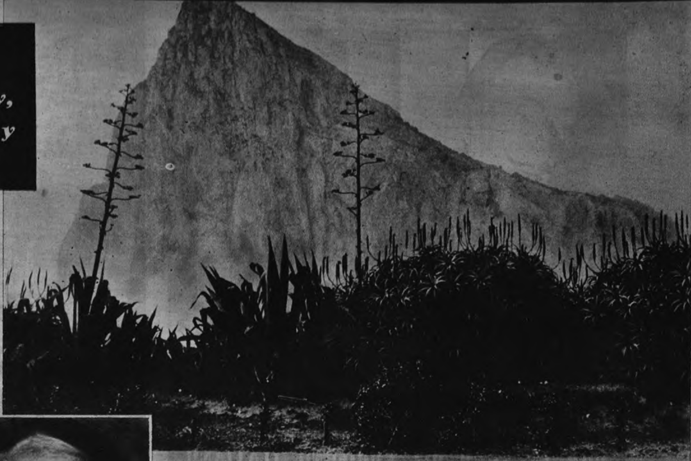
Souvenir from Gibraltar