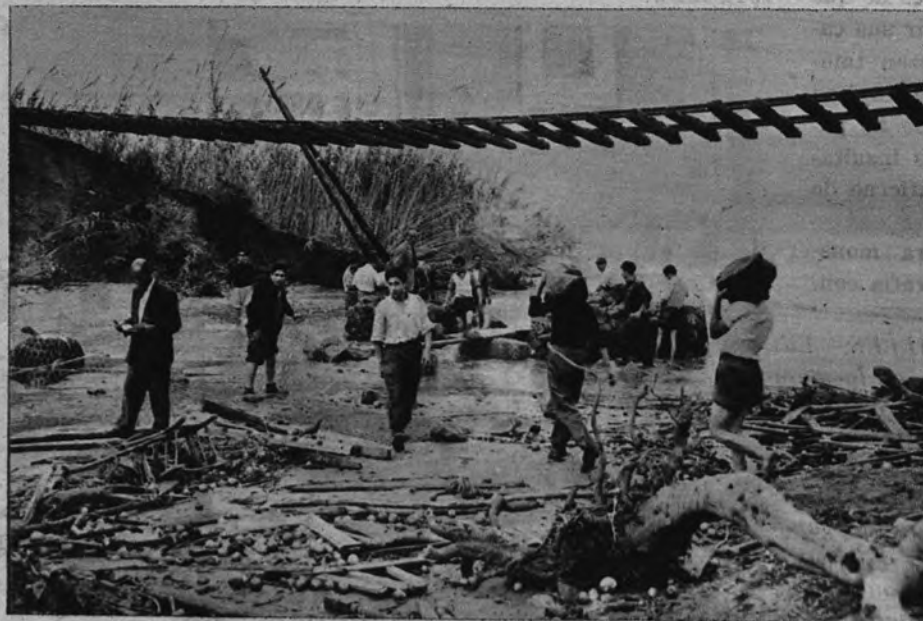
Como nuestro Norte, como otras muchas regiones europeas, Reggio Calabria ha conocido la ferocidad de las grandes lluvias y el trágico colapso de las inundaciones. Aquellos campos de tranquila belleza ofrecen hoy

perfumera— constituyen los productos básicos del comercio reggino. A ellos hay que añadir los vastos limoneros y naranjales y, sobre todo, los célebres olivos calabreses, que tapizan las colinas de esta provincia con verdaderos bosques de árboles altos