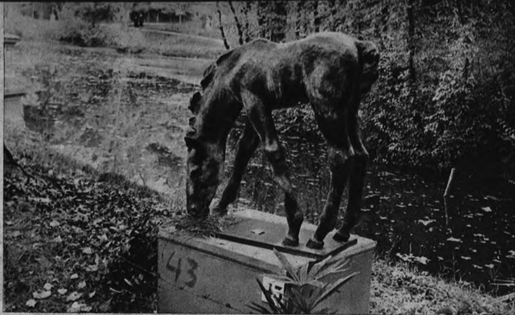
Potro (bronce) de Renée Sintenis

Ferreira, en cambio, no temió la asonancia con el paisaje en torno y nos ha traído en su «Figura» una prueba de su indeclinable tesón por compendiar en la materia lo ascético, hierático y difícil de la abstracción del desnudo a prueba de herir conceptos golosos a la mirada. Planes sedentario en su gracioso módulo decorativo de sobriedad, equidistante entre la curva y la recta que ablanda y eleva la misión de los ojos, respectivamente. Gabino, desenvuelto en la concepción de su bailarina en re-