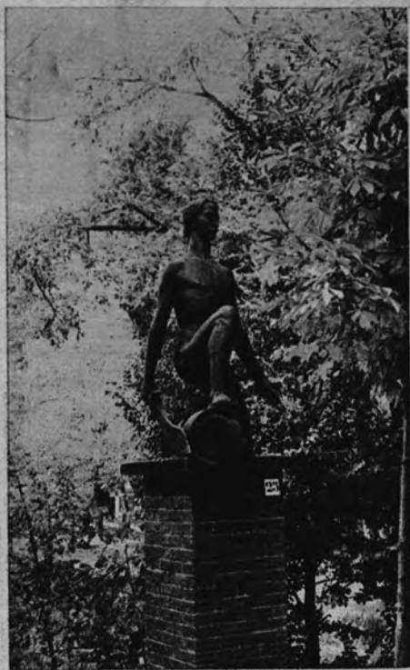
«David», de Ivar Johnson

L. FIGUEROLA-FERRETTI