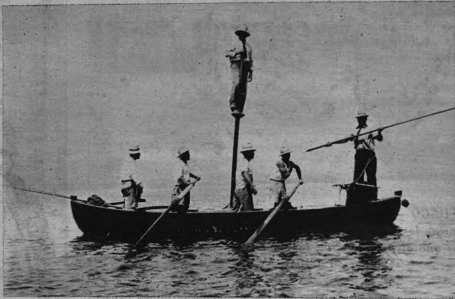
Embarcación calabresa para la pesca del pez espada. El patrón de la lancha, encaramado en el palo, dirige los rápidos movimientos de la barca e indica el instante en que debe ser lanzado el arpón

inmediaciones de la ciudad de Reggio Calabria. En la explotación industrial de estas dos preciadas plantas descansa gran parte de la economía de la Calabria meridional. Mas no sólo el jazmín y la bergamota —elemento esencial este último en la industria