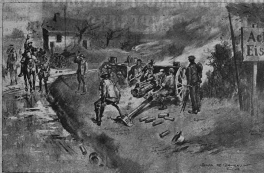
ALTO EL FUEGO.—El momento dramático en que los enviados britá- nicos comunican la firma del Armisticio y la orden de cesar el fuego a los artilleros que disparan sobre los alemanes en retirada en Mons- Charleroi

LA CONFERENCIA DE VERSALLES.—Los hombres que arreglaron el mundo en la mesa de Versalles: el coronel Nagai (Japón), gene- ral De Robilant, barón Sonnino (Italia), Or- lando (Italia), coronel House, general Bliss (Estados Unidos), Auchincloss (Estados Uni- dos), Venizelos, Vesnitch (Serbia), Weygand (Francia), general Belin (Francia), Foch, Pi- chon, Clemenceau, Lloyd George, Bonar Law, lord Milner y Douglas Haig. En esta mesa había ya un cadáver anticipado: el de la paz que comenzaba el mismo día del Armisticio