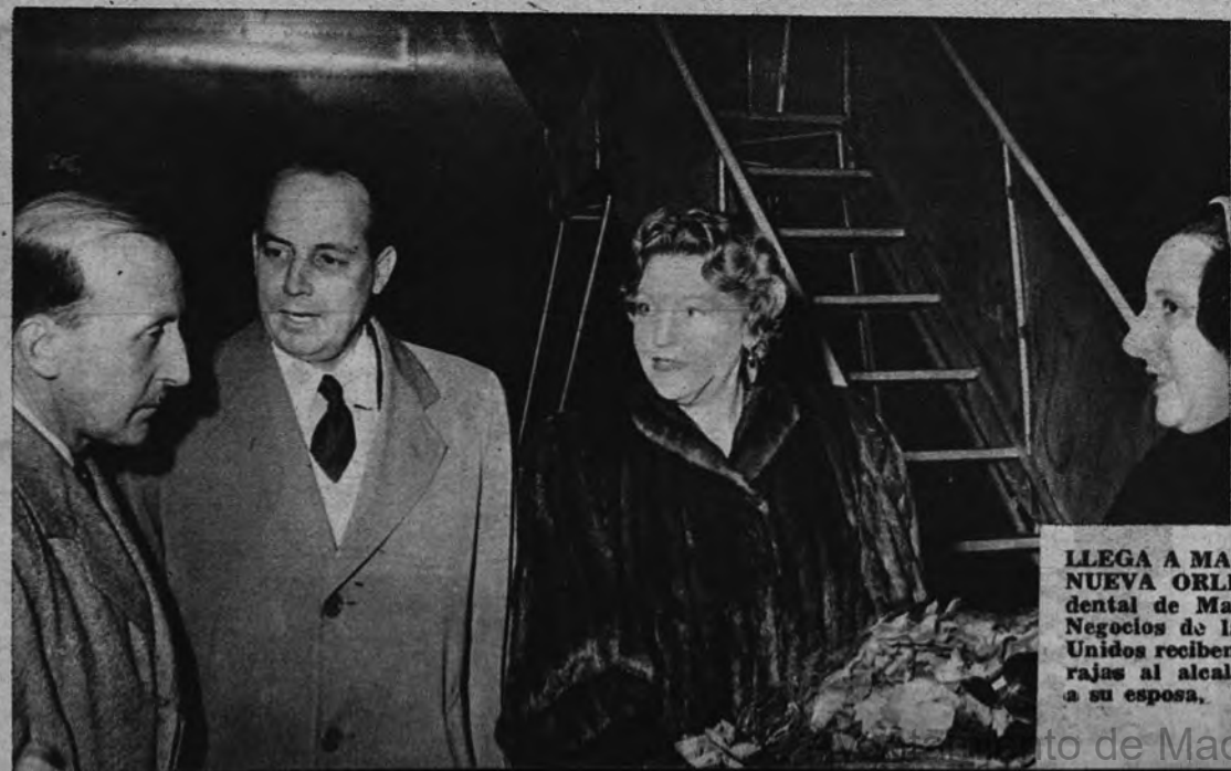
LLEGA A MADRID EL ALCALDE DE NUEVA ORLEANS. —El Alcalde accidental de Madrid y el encargado de Negocios de la Embajada de Estados Unidos reciben en el aeropuerto de Barajas al alcalde de Nueva Orleans y a su esposa.