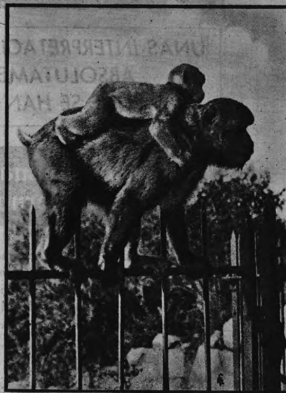
OF A ROCK MONKEY

A SUCCESSFUL SNAPSHOT OF A TAIL-LESS MOTHER APE CARRYING HER BABY ON THE UPPER PARTS OF THE ROCK.