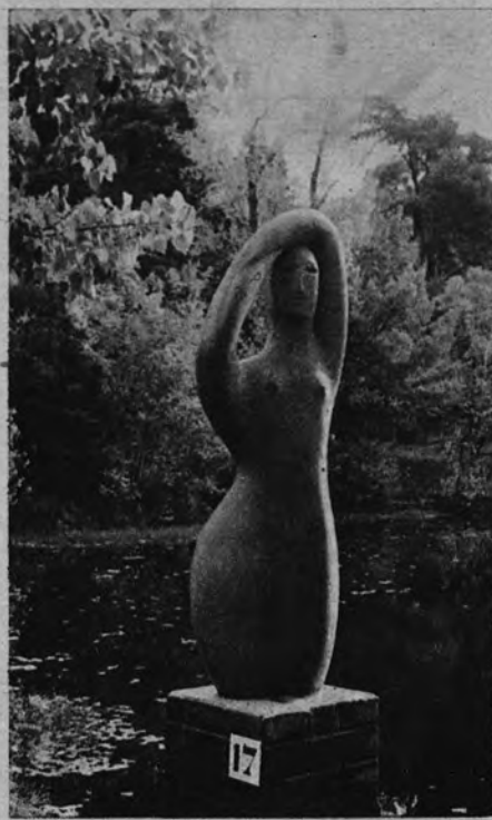
«Figura», por Carlos Ferreira