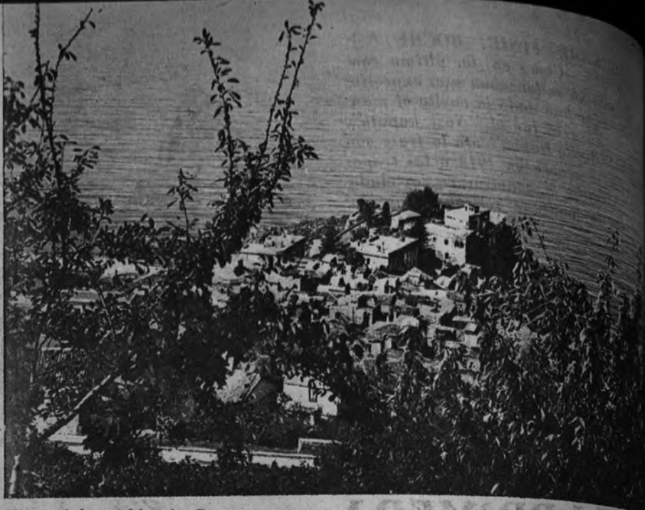
Vista del pueblo de Bagnara, pintoresca localidad estival calabresa a la entrada del estrecho de Mesina. Desde este pueblo en los días de cielo sereno se divisa el archipiélago de las Eólicas y la isla de Stromboli

ES muy posible que una de las regiones menos conocidas de Italia, no sólo por el turismo extranjero, sino incluso por los propios italianos, sea la Calabria meridional. Emplazada en la suela de la bota italiana y bañada por tres mares, la provincia de Reggio Calabria es merecedora de alta admiración no sólo por la diversidad de sus paisajes, sino también por la grandeza de su historia. El mito y la realidad tejen con poéticos y perennes hilos el singular encanto y la emoción visual que inevitablemente despierta esta tierra, que desde las cumbres del Aspromonte va a morir entre flores y frutos al mar violáceo cantado por Homero, cara a la fraterna costa siciliana.