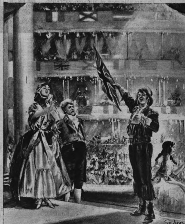
LA PAZ BAILA.—Londres celebró la paz con un gran baile en el Albert Hall. El principal atractivo del festejo consistió en este cuadro teatral, donde cada uno de los países aliados era personificado más o me- nos afortunadamente. La paz bailaba. Unos meses después se supo que no había dado un solo paso. Y una guerra más y se supo que ya no había "Rule Bri- tania" ni la Francia de Clemenceau