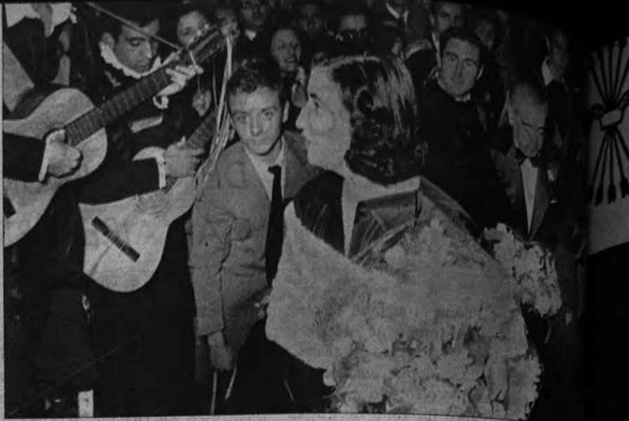
FUNCION BENEFICA. —Patrocinada por los marqueses de Villaverde se celebra una función benéfica en pro de los damnificados del Norte. La Tuna Universitaria recibe a la hija del Caudillo, a la que acompañan el marqués de Huéscar y el Nacional del Sindicato del Espectáculo.