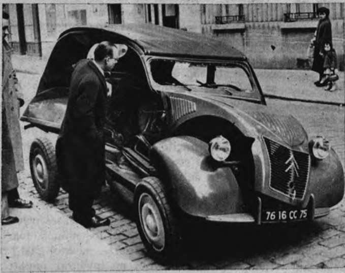
VAN A SOBRAR PIEZAS. —Este automóvil debe tener enemistades particulares con la gendarmería marseillesa. Fué a estrellarse contra la fachada de la comisaría y quedó en este curioso estado, para la visita de la reparación