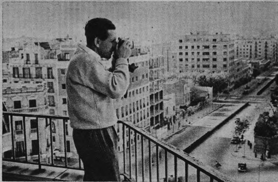
El "violín de Ingres" del artista es la fotografía. Pastor le ha cogido entregado a su diversión favorita en la terraza de su casa

La estampa del estudio bohemio, con chicas escondiéndose entre las cortinas, no va nada aquí. En éste de Morales hay vistas a Barajas, si uno se asoma a la ventana, y vistas de Nueva York y de Castilla, si uno