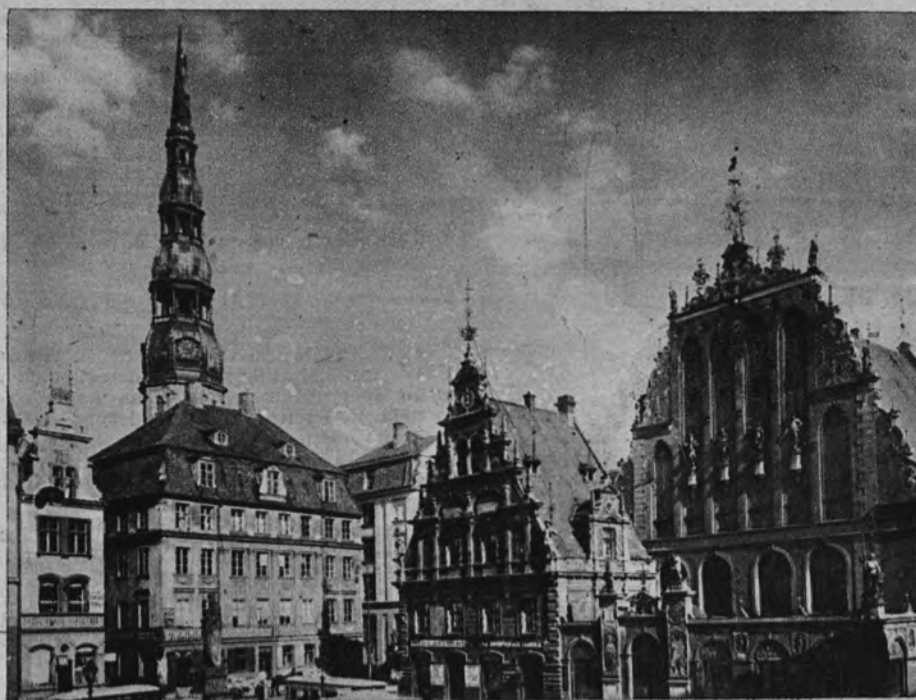
La famosa casa de las Cabezas Negras, edificada en 1330 y destruida por los rusos durante la pasada guerra mundial

Te pido por el pueblo letón, por los 35.000 deportados de 1941 que agonizan en las estepas siberianas, por los cientos de miles que durante estos años han sido llevados a las orillas del Ártico, donde, con su postrer lamento, levantan obras gigantescas para la destrucción de Tu mundo. Te pido por los que, en la patria envilecida, se ven perseguidos y escarnecidos por no renunciar a su hombría de bien. Te pido por aquellas madres viejecitas que pierden sus hijos sin poder, con un último beso, cerrarles los ojos; sin saber dónde encontrar sus tumbas. Por esos canosos labradores que ven arrasado el tra-