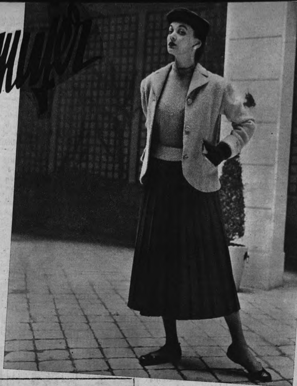
Conjunto de "tweed", de Madeleine de Rauch