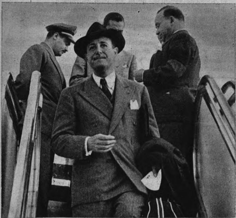
MADRID, A LA VISTA DE SU ALCALDE. —El conde de Mayalde, Alcalde de nuestra capital, regresa en el avión de Nueva York de su visita a Lima. La mirada de nuestro Regidor explora el cercano perfil matritense