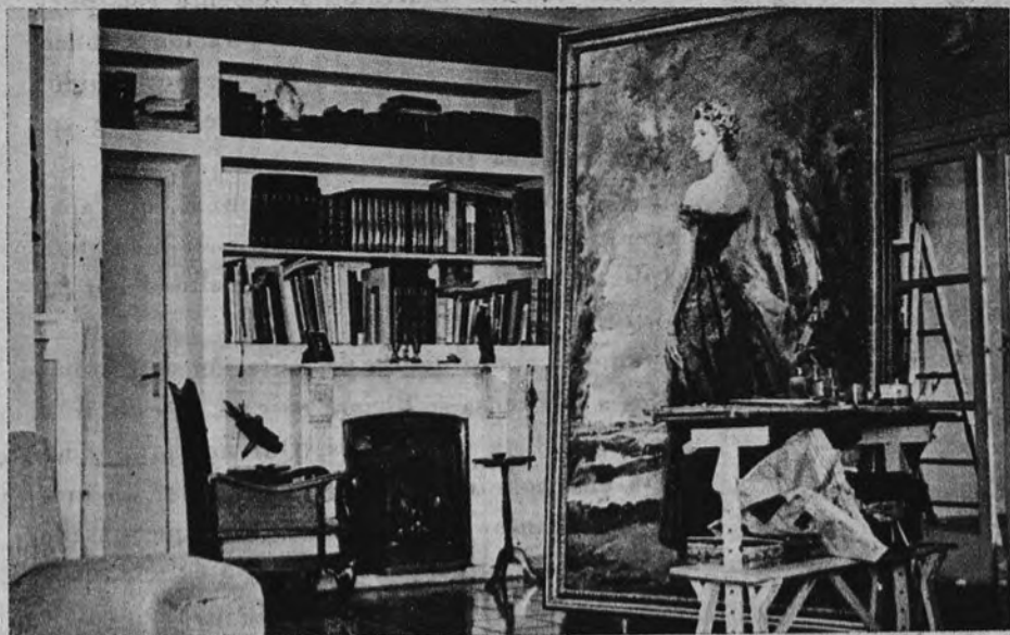
La salamandra y los libros al fondo. Delante, un cuadro en el telar y los chismes de pintar. Al fondo, los chismes de trabajar de otro "pintor" más modesto