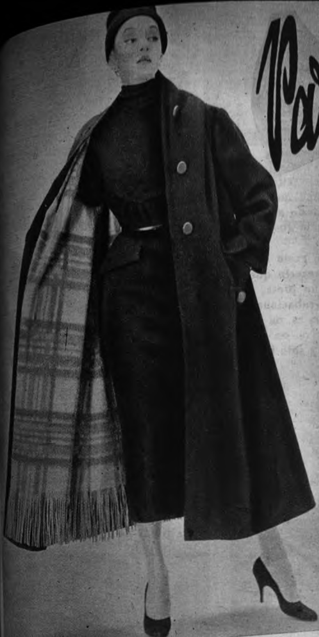
Abrigo de lana, de Madeleine de Rauch