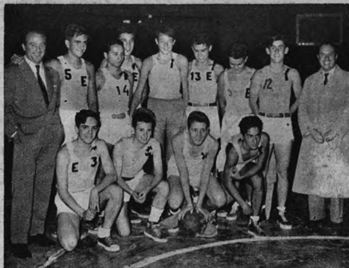
CAMPEONES. —Este grupo de chicos forman el equipo del Club «Estudio», campeón del «Trofeo Pueblo 1953», y campeones de Castilla de baloncesto, juvenil e infantil. No hay más remedio que felicitarles