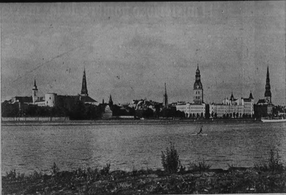
Vista de Riga desde la orilla izquierda del Duina