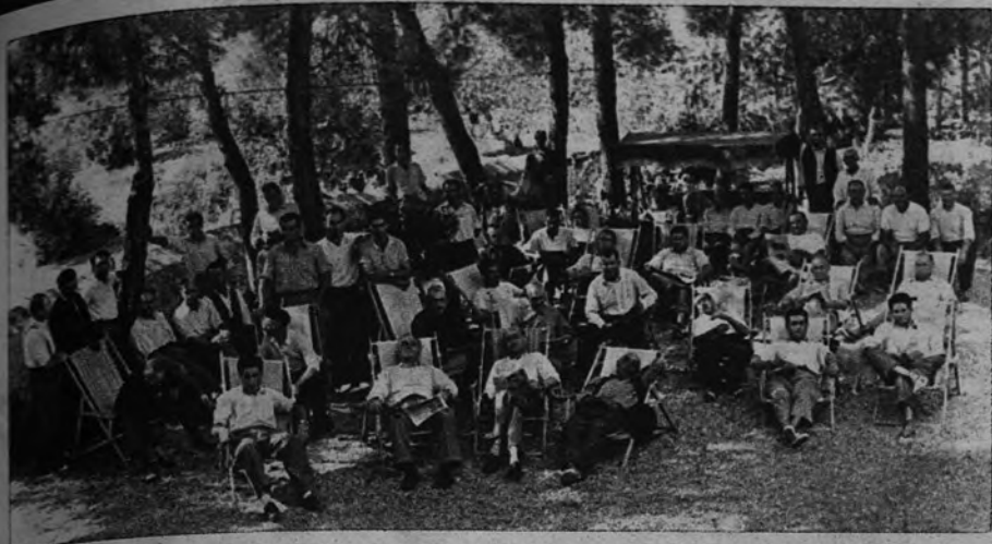
Trabajadores campesinos de las provincias de Valencia y Castellón, que han asistido en la Residencia de Tarragona a un Cursillo de Formación Sindical, escuchan, a la sombra de los pinos, una conferencia sobre temas sociales