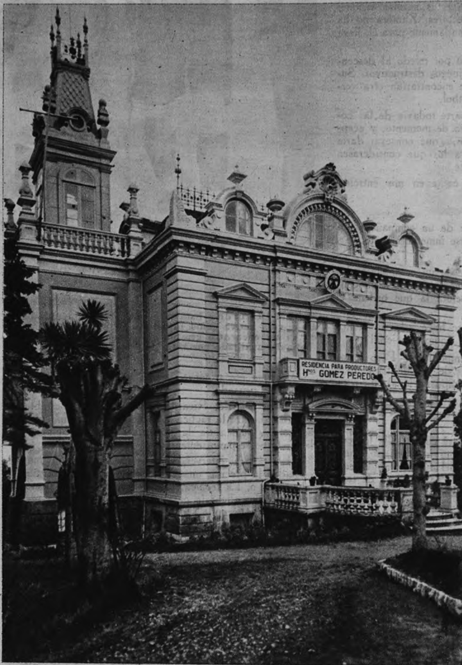
Fachada del magnífico edificio de la Residencia «Hermanos Gómez Pereda», de Santander, en la cual, en régimen de internado, se celebran Cursos de Formación Sindical para Vocales sociales campesinos

Las Residencias Sindicales del litoral son utilizadas para la capacitación y descanso de los campesinos españoles