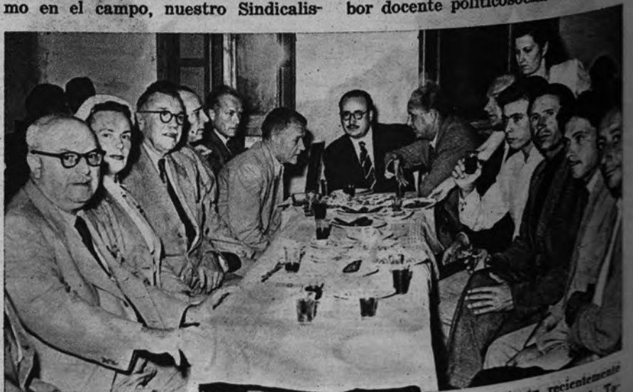
Miembros de la Confederación Europea de la Agricultura, que asistieron recientemente a la V Asamblea de este Organismo celebrada en Sevilla, visitan la Residencia de Toledo (Málaga), y departen amigablemente—ante unas copas de vino español, que les ofrecen los hombres más cordiales y comunicativos—con un grupo de trabajadores cam-