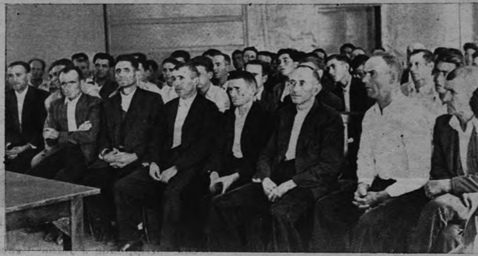
Hombres del campo de Cáceres y Huelva, de rostros curtidos por el aire y el sol, asisten, atentos e interesados, a una de las clases de Formación Sindical de un Cursillo celebrado en la Residencia «José Luis Almagro», de Cádiz