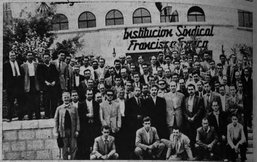
Las tareas de estudio en los Cursos de Formación Sindical para Vocales sociales campesinos se complementan con la visita a centros industriales e instalaciones sindicales. He aquí a un grupo de los que han asistido a uno de los cursos celebrado en la Residencia de Málaga, durante su visita a la Institución Sindical «Francisco Franco», de aquella provincia

AUTENTICAMENTE representativa, en su más estricto sentido, la Organización Sindical española lucha desde un principio porque todo trabajador nacional, sea de la categoría que fuere, industrial o agrícola, constituya parte integrante y activa en las más altas funciones rectoras de la política laboral del Estado. Y a tal fin se encamina, precisamente, esa libre elección periódica de representantes obreros de cada especialidad, efectuada por sus propios compañeros, en el seno de nuestro primer organismo legislativo: las Cortes.