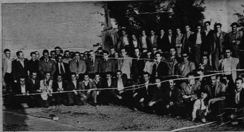
Terminó el acto solemne de la clausura. Los Vocales sociales, asistentes a un Cursillo de Formación Sindical, celebrado en la Residencia malagueña, se fotografian formando grupo en torno al Vicesecretario Nacional de Ordenación Social, don Francisco G. Bailesteros, que presidió el acto