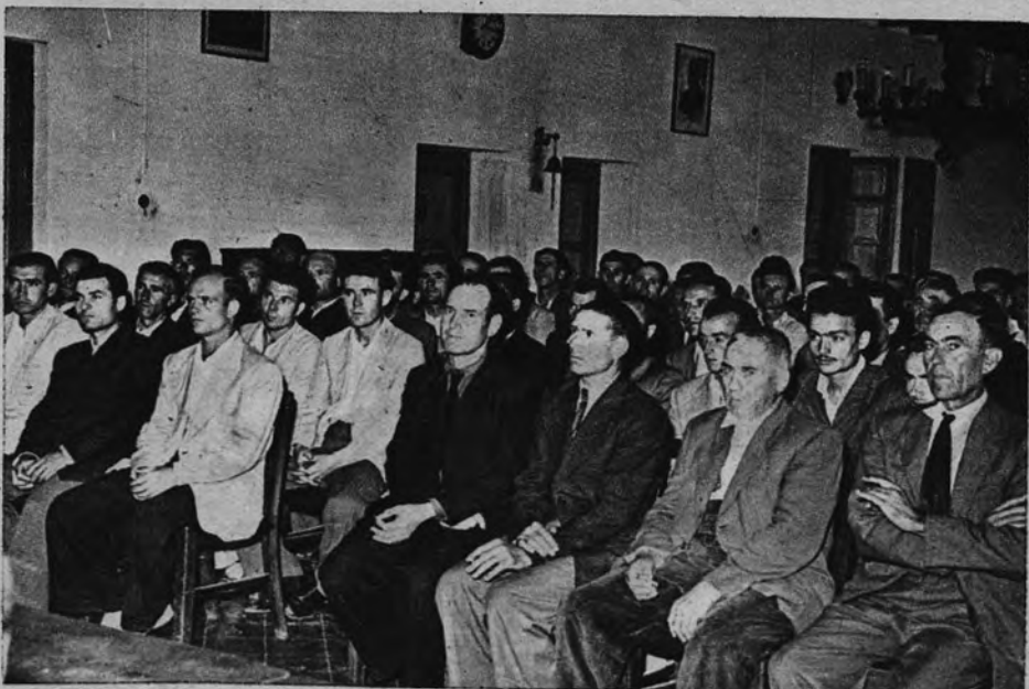
Quedaron atrás, por unos días, las rudas y agotadoras tareas campesinas. Y aprovechando el breve paréntesis, estos trabajadores agrícolas se capacitan sobre temas sindicales y

mo ha venido organizando Cursos ininterrumpidos sobre Formación Profesional, instituyendo una amplísima red de escuelas especiales dedicadas a dicho adiestramiento obrero, y, en fin, proporcionando a cuantos lo soliciten los medios más adecuados para educarse en cualquier sentido. No obstante, faltaba aun un algo, un algo fundamental: el facilitar a tales obreros esa objetiva y amplia instrucción política y, muy en especial, al trabajador agrícola, que, por su misma condición de vida lejos de la capital, se vió hasta la fecha privado casi en absoluto de ella. En realidad hacíase imprescindible desde hace mucho tiempo educar en tal sentido a nuestros hombres del agro. Era menester brindarles la información necesaria para que, por sí mismos, conocieran la verdad de ese mundo político, respecto al cual, en su antigua ignorancia, era tan fácil hacerles incurrir en absurdos errores o apasionados sectarismos. Y, por tanto, cubriendo una vez más la avanzadilla de objetivos tan trascendentales, ha sido también esta misma Organización Sindical la que, recientemente, apenas hace tres años, inició con ímpetu una fructífera labor docente políticosocial entre todos