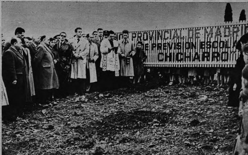
COTO FORESTAL «HERMANOS CHICHARRO». —Continuando su campaña el Presidente de la Diputación de Madrid, inauguró este coto, cuyo nombre honra la memoria de unos caídos requetés. Asistieron la hermana de aquellos espléndidos camaradas y diversas autoridades