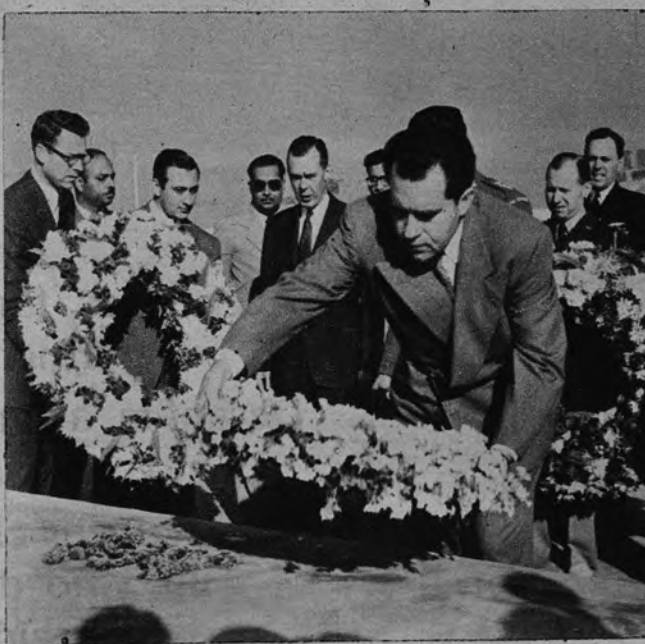
EL VIAJE DE NIXON. —El vicepresidente de los Estados Unidos, Richard Nixon, deposita una corona de flores en la tumba del Mahatma Gandhi, como homenaje al hombre que liberó la India del yugo imperial británico, y que murió asesinado