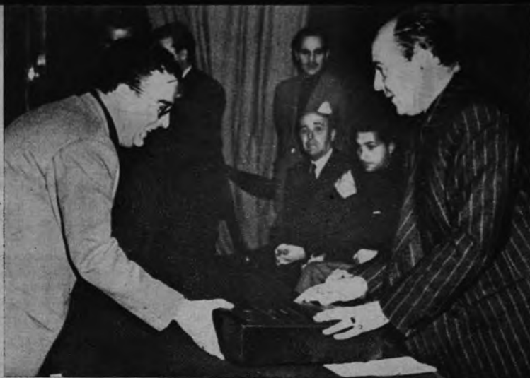
TAREA SINDICAL. —El Delegado Provincial de Sindicatos de Valladolid hace entrega al Delegado Nacional de las conclusiones aprobadas en la IV Asamblea Provincial de Hermandades de Labradores, que se ha celebrado en la capital castellana