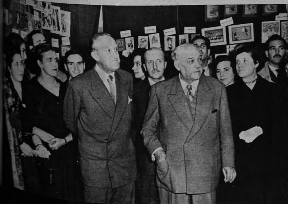
EXPOSICION DE «CHRISTMAS» EN GALERIAS PRECIADOS. —La VI Exposición de «Christmas», organizada por Galerías Preciados, es ya uno de los síntomas tradicionales de la Navidad madrileña. Al acto de la apertura de la Exposición asistieron distinguidas personalidades