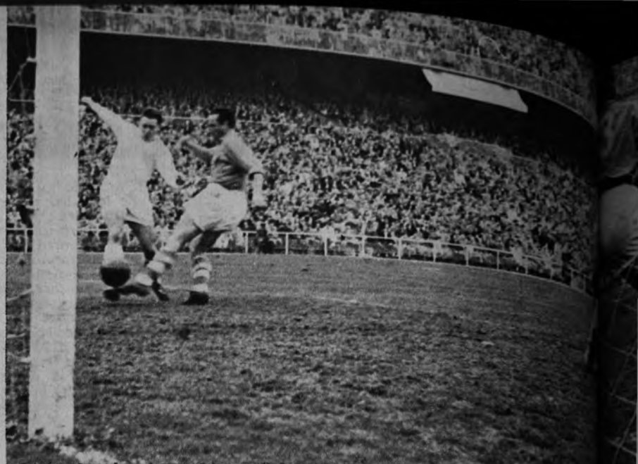
MOLOWNY MARCA EL TERCERO. —Se había internado Gento en una de sus escasas jugadas aceptables, burlando a los defensas para centrar bien medido a los pies de Molowny, comodísimo inquilino de la soledad apenadas, con el trabajo de meter el pie y apuntarse el tercero