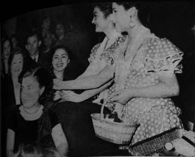
CAMPANA DE NAVIDAD. —Durante la función matinal de teatro que presidió la excelentísima señora doña Carmen Polo de Franco actuaron las más prestigiosas artistas, y muchas de ellas vendieron flores en el descanso. La función fué un total éxito.