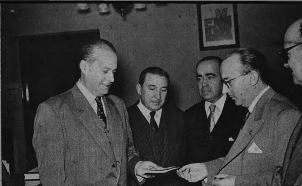
PARA LOS DAMNIFICADOS DEL NORTE. —El presidente y directivos de la Asociación de la Prensa de Madrid en el acto de entrega al Ministro de la Gobernación del cheque correspondiente a la recaudación de la película «Los cuentos de Hoffman» a beneficio de los damnificados del Norte: 100.773 pesetas.