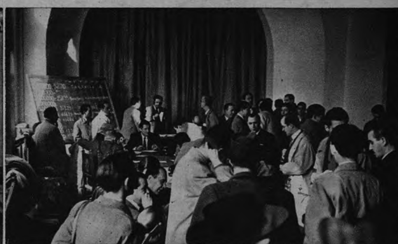
CUARTEL GENERAL DE LA PRENSA. —Como todos los años, la Asociación de la Prensa ha montado su servicio, auténtico cuartel general de los periodistas