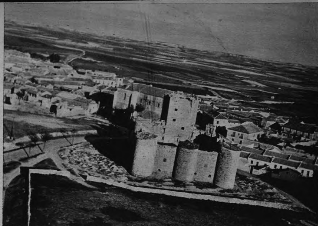
Batres.—Sobre la puerta, el escudo. Detrás, el riachuelo a cuya orilla meridaba Garcilaso; a la fuente se llega por el camino posterior del que se bifurca junto al castillo