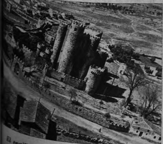
El castillo de los Coracera, en San Martín de Valdeiglesias