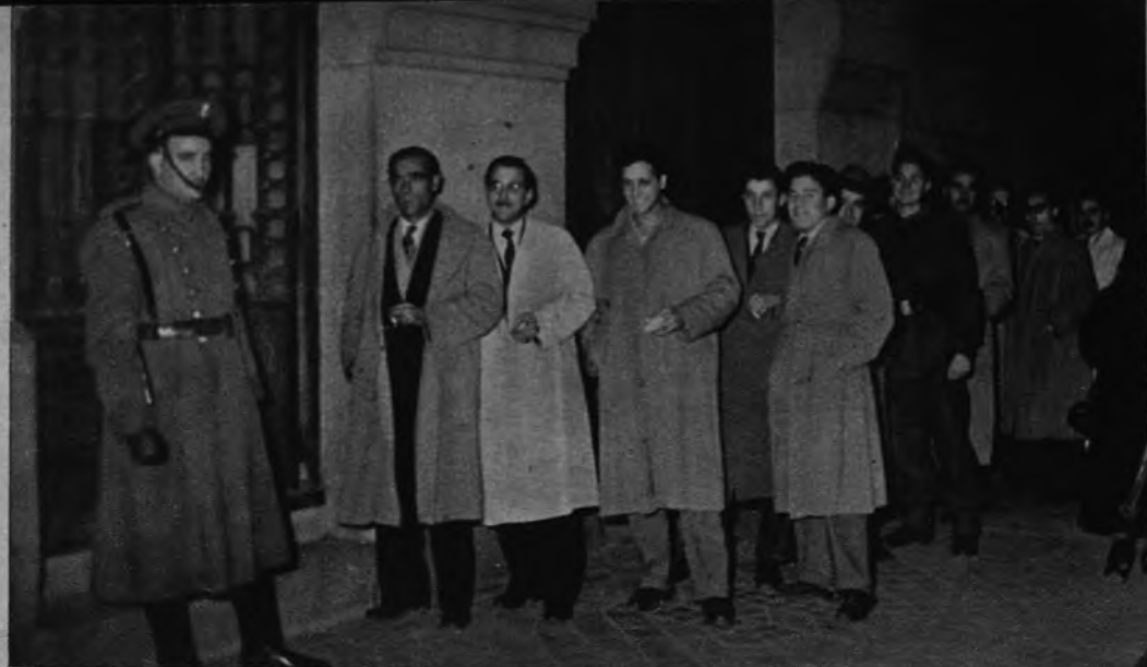
COLISTAS 1953. —Lo que la antigua «cola» del sorteo tenía de pedigüeña y cochambrosa ha sido saneado. Una limpia y sencilla curiosidad, que todavía no ha claudicado ante la radio, es la que compone esta espera a la puerta