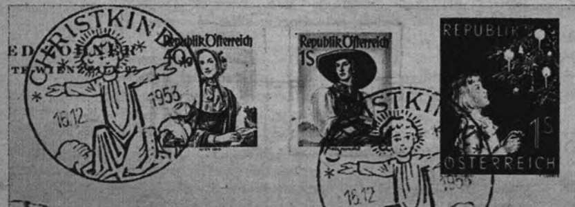
FILATELIA DE NAVIDAD. —Sellos y matasellos de Correos que con motivo de la Navidad han sido puestos en circulación en Austria. A la belleza de estas piezas filatélicas se une su hermoso sentido conmemorativo.