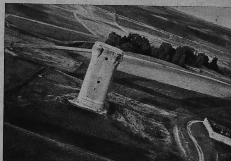
La torre del homenaje del castillo de Arroyomolinos. El cuadrado de su muralla exterior se aprecia en la fotografía

Perteneció al Rey Don Juan II, y posteriormente, a don Alvaro de Luna, quien le rindió en el homenaje cuando fué aprobado y confirmado por el Papa maestro de Santiago. Desde allí se organizaban grandes cacerías de osos, jabalíes y venados. En tiempos de los