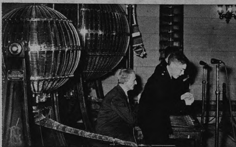
LA SUERTE EN MOVIMIENTO. —El sorteo está en plena marcha. Los dos bombos, notoriamente desiguales de tamaño, van goteando poco a poco la fortuna