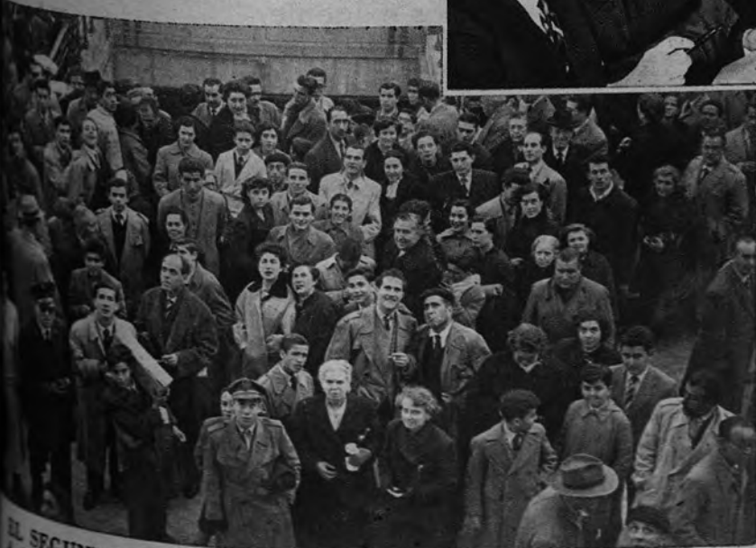
EL SEGUNDO, EN MADRID. —Este año la mejor fortuna del sorteo de Navidad ha escapado de Madrid. Escépticamente, el público congregado ante las pizarras contempla su propia desilusión, mientras que el pequeño revuelo de la jornada madrileña se concentra en las administraciones de Lotería que han conseguido parte del segundo premio