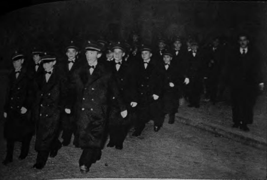
LOS CHICOS DE LA SUERTE. —Gozosos, los chicos del Colegio de San Ildefonso, van de mañanita a la sala de sorteos de la Lotería Nacional. Las manos inocentes que sacarán los premios llevan la gala blanca y abrigadora de los guantes