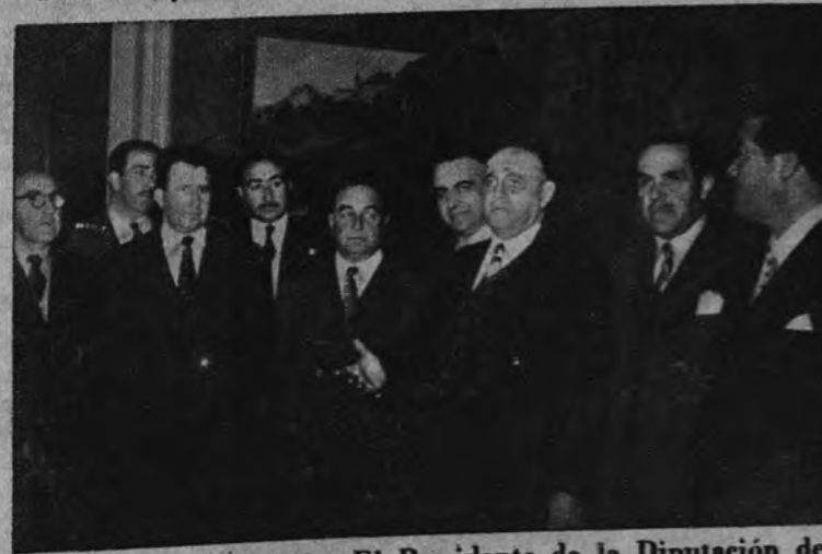
DESPEDIDA AL 1953. —El Presidente de la Diputación de Madrid, marqués de la Valdavia, ofreció una recepción de fin de año a los diputados, altos empleados y representantes de la Prensa, que con este motivo acudieron a saludarle en su despacho oficial.