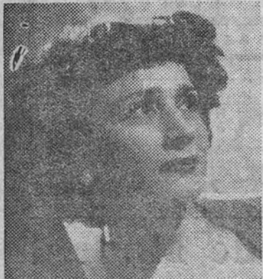
De Celia Gámez se clasifica el éxito en su actual temporada en el teatro Lope de Vega (el Palacio de la Revista) con «Yola», nueva y maravillosa versión 1953, en la que Celia, con su personalidad arrolladora, su simpatía y su belleza, se consagra como la más deliciosa vedette, cuya sola presencia en escena divierte y encanta, confirmando su enorme triunfo al frente de una gran compañía de ases.

Todos los espectadores serán obsequiados con las clásicas uvas de la suerte y botellines de vino FINO TRES PALMAS, de La Riva, de Jerez de la Frontera