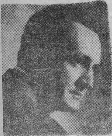
Luis Sagi-Vela, el famoso cantante español, que tan brillante temporada lírica está desarrollando en el teatro Madrid, donde al frente de su gran compañía, en cuyas filas forman los más destacados cantantes, nos viene ofreciendo las más extraordinarias joyas de nuestra zarzuela. Destaquemos su éxito en «La viuda alegre», que, a petición del público de Madrid, Luis Sagi-Vela nos ofrece en su maravillosa versión moderna.

Con la copa en alto, el informador teatral, a través de su «Noticiero Relámpago», brinda en honor de la extensa familia del teatro. Durante todo el año, esta sección ha estado en constante desvelo para ofrecer a los lectores de ARRIBA las primeras noticias, en una información honesta, seria, sin hielos ni mordacidades, desoyendo el comentario ingrato y siempre atento a la actualidad escénica de toda España. Así, pues, por sus páginas han desfilado las más famosas figuras, autores y empresarios, unidos a los artistas jóvenes que comenzaron y ya son populares, o bien los nuevos va-