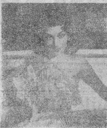
«¡Así es América!», un espectáculo trepidante y alegre, en el que las más relevantes figuras argentinas se han reunido para mostrar a España toda la belleza, alegría y el buen humor en un espectáculo que reúne, en dos horas inolvidables, el verdadero torbellino y la belleza de toda América. Un gran éxito que en el teatro de la Zarzuela anuncia sus últimas semanas de actuación.