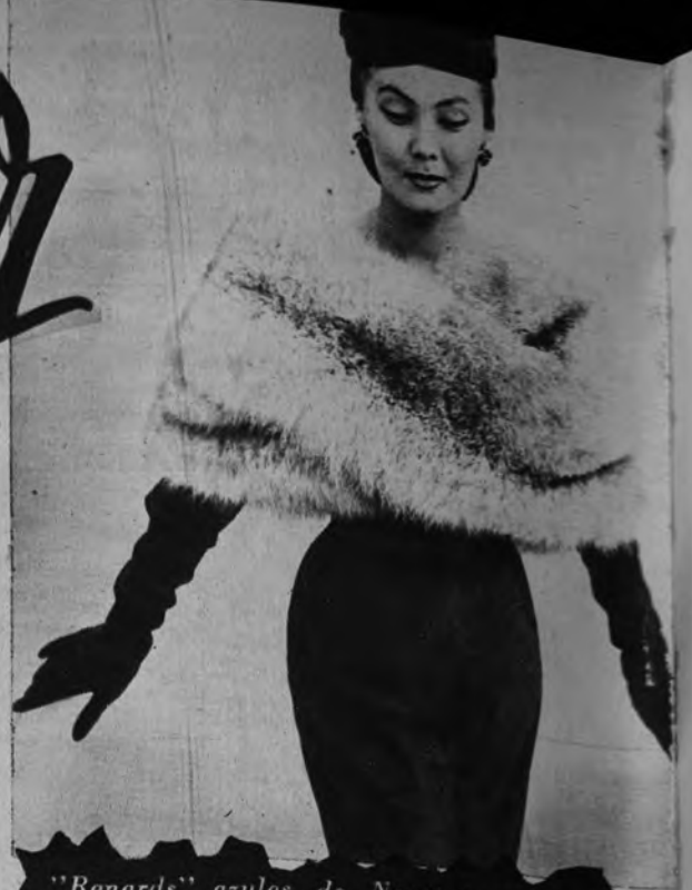
«Renards» azules de Noruega en una creación de Jacques Fath

Vestido de «cock-tail», de Jacques Heim. París