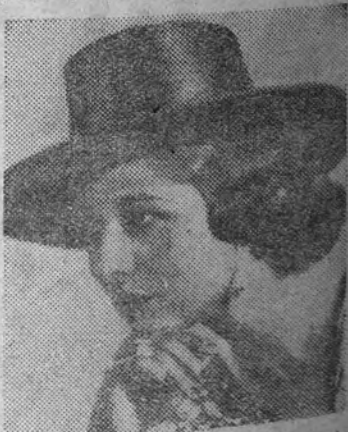
Conchita Piquer, triunfo del arte español en la voz y figura de esta maravillosa estrella, con toda la gracia y la pujanza de su personalidad y su arte, que diariamente recibe las más calurosas ovaciones por sus éxitos en el Álvarez Quintero con «Salero de España», un brillante espectáculo creado especialmente por los famosos autores Quintero, León y Quirga.