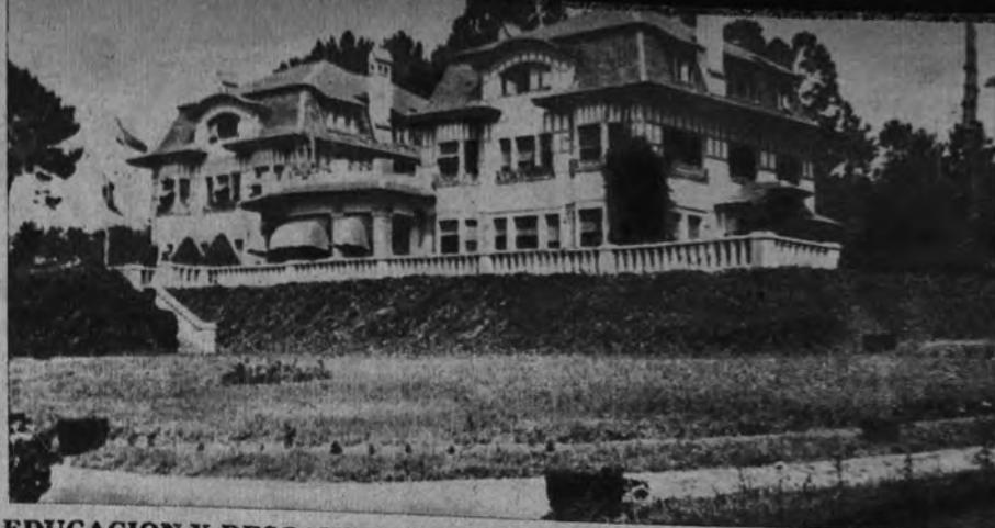
EDUCACION Y DESCANSO EN LA CORUÑA. —Esta magnífica residencia, que lleva el nombre de «Santiago Apóstol», y está enclavada a ocho kilómetros de La Coruña, ha sido adquirida por la Obra Sindical Educación y Descanso con destino a sus fines