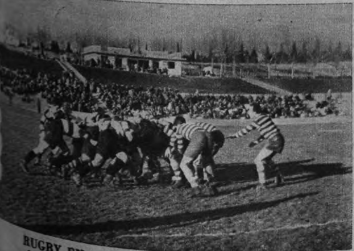
RUGBY EN LA CIUDAD UNIVERSITARIA. —Los ingleses del Tryniti College, de Oxford, batieron al Atlético de Madrid por 9 a 3 sobre la pista universitaria, en el primero de una serie de encuentros que jugarán frente a equipos nacionales.