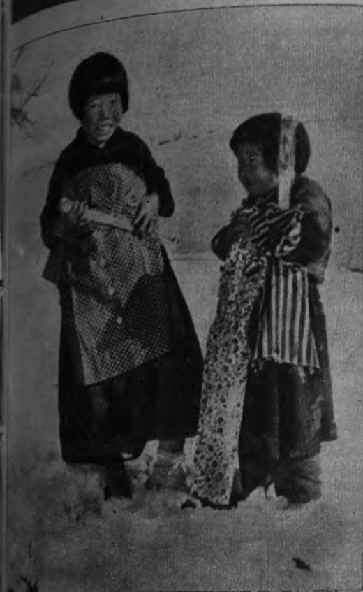
NAVIDAD EN COREA. —En la desolada blancura de Corea, estos dos huérfanos de la triste guerra, que nadie sabe cómo acabó, son como un símbolo del tiempo actual. Los pequeños tienen bien cogidos los regalos suministrados por el Ejército de los Estados Unidos.