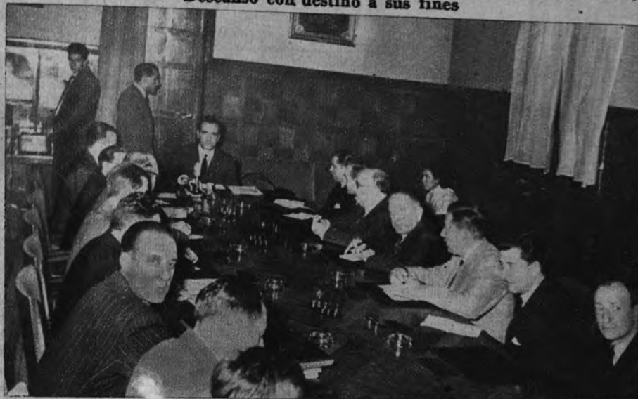
CONFERENCIA DE PRENSA. —El Ministro de Educación Nacional, Joaquín Ruiz-Giménez, reunió en una conferencia de Prensa a los representantes de periódicos y agencias nacionales y corresponsales extranjeros, con el fin de informarles sobre los trabajos de su Departamento