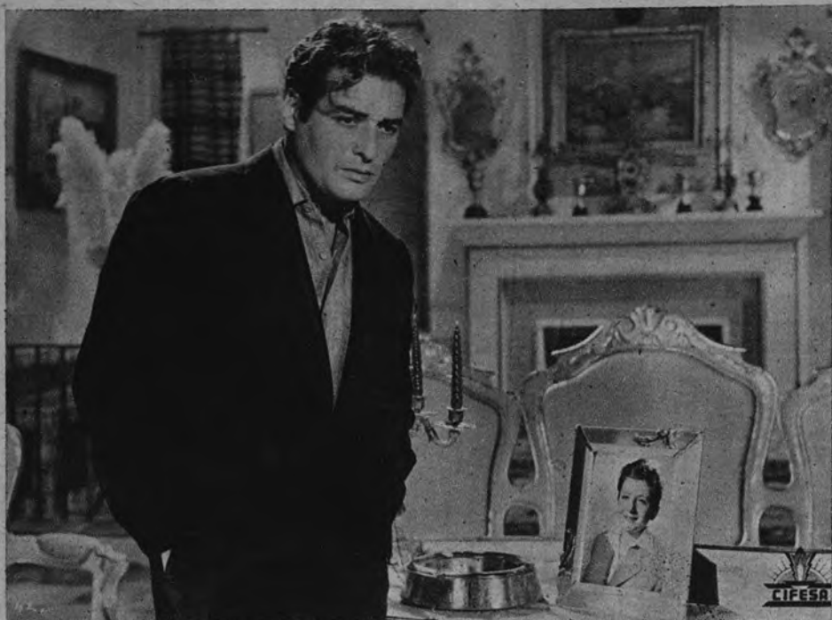
"Juan Manuel" (Jorge Mistral) recuerda, emocionado, a su hijo, a quien el Destino lo separó de su lado para siempre cuando más lo necesitaba

CARMEN SEVILLA (Colorín), JORGE MISTRAL (Juan Manuel) Y EL DIRECTOR LUIS LUCIA, SON LOS TRES GRANDES DE ESTA GRAN SUPERPRODUCCION EN GEVACOLOR, BENITO PEROJO-CEA