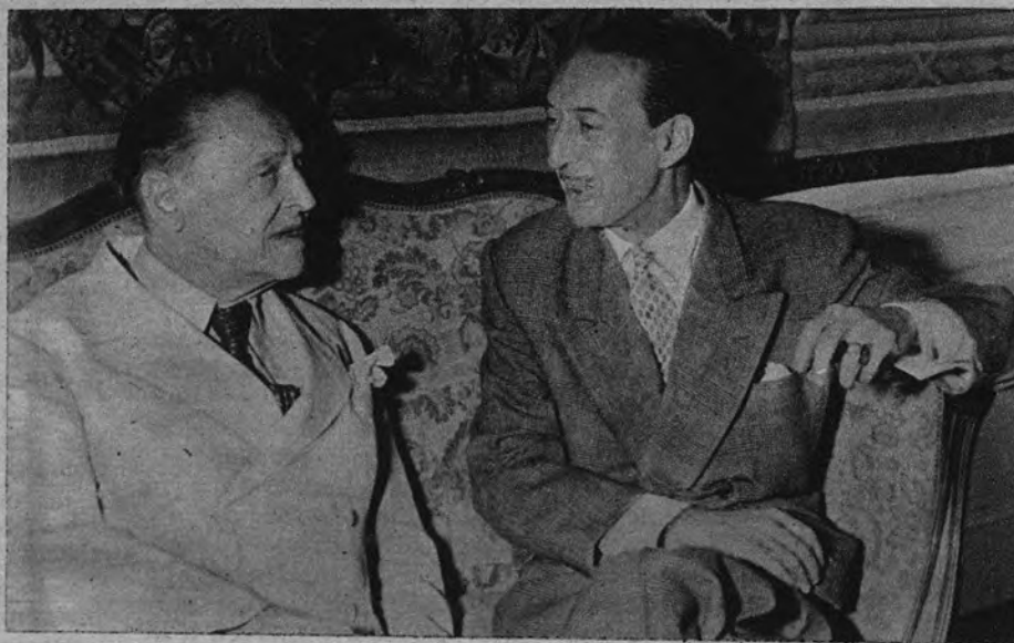
CONVERSACION CON SOMMERSET MAUGHAM. —Nuestro colaborador César González-Ruano, con el afamado novelista Somerset Maugham, cuya conversación se insertará en las páginas dominicales de ARRIBA