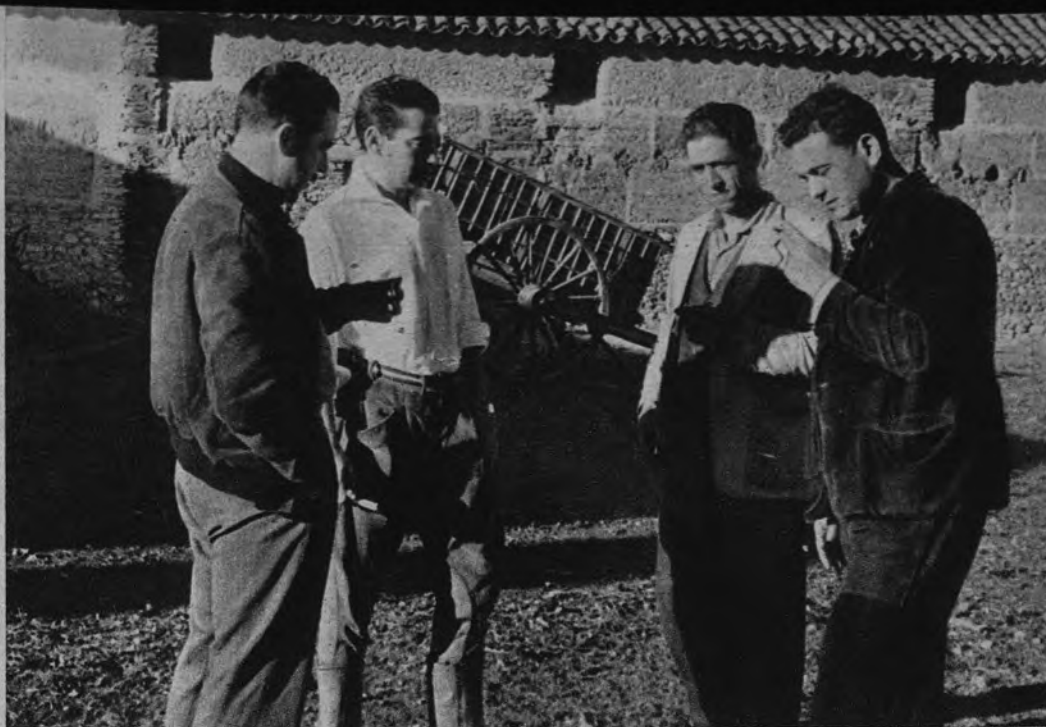
Para ganar tiempo se pernoctó en el cortijo. A la mañana siguiente recogimos ese momento en que los aficionados van saliendo al patio, y mientras se lia el cigarro después del "bocado" se habla con los prácticos de las posibilidades de la jornada.