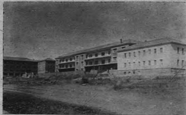
Sin adjetivos, porque no los precisa, la nueva Residencia Infantil Provincial será, una vez terminada, una auténtica institución modelo

Hacia la cultura, hacia el progreso, de frente a la fe tradicional, la Diputación de León simboliza con toda justicia al pueblo leonés. Este pueblo, «cabeza imperial de España», donde nacieron los primeros impulsos imperiales que nos llevaron a conquistar un mundo con la espada y con la Cruz.