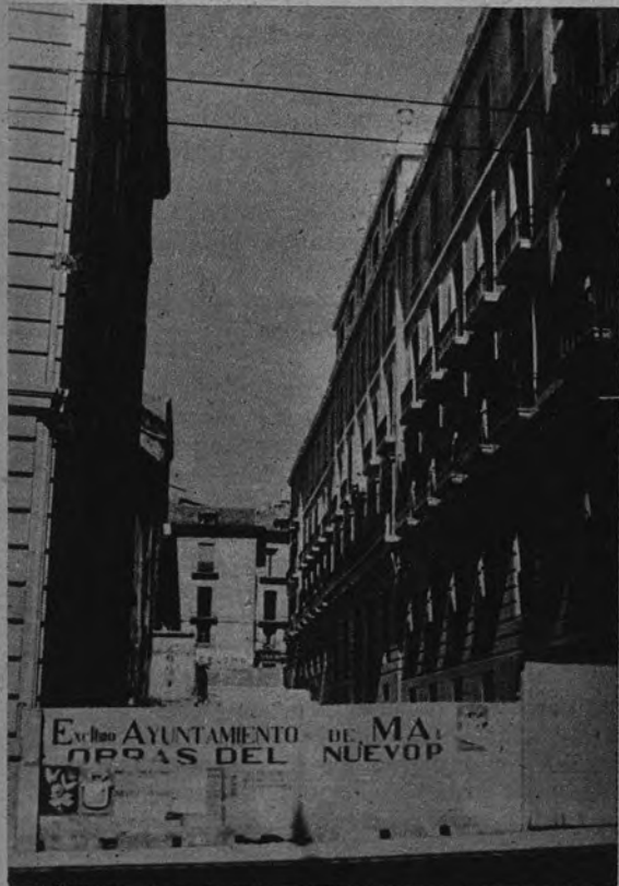
NUEVA CALLE EN MADRID. —Nuevas calles se abren con relativa frecuencia en nuestra capital. Ya es más raro la apertura de una como ésta, en el corazón de Madrid: nace en la de Alcalá para morir en Aduana, y se la ha bautizado a la memoria del maestro Guerrero.