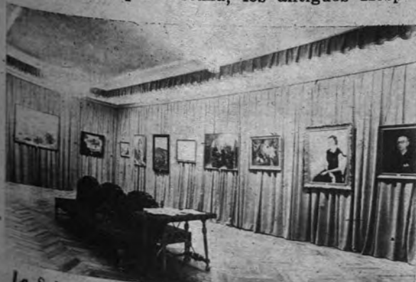
La Sala de Exposiciones del Palacio Provincial es un mirador abierto al arte, expresión del profundo sentido artístico del pueblo leonés