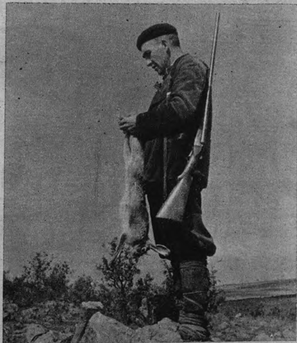
Como rúbrica a un lance feliz, serio y aun paladeando el goce sentido momentos antes, procede a "engatillar" la liebre que más tarde, en la casa, será colgada en un clavo del artesonado.

A esta primera apertura siguió la del 15 del corriente, autorizándose la caza del corzo y rebe-co, especies que gozan de reglamentación especial, pues solamente es lícita su persecución hasta el día último de octubre inclusive; en total, mes y medio. Bueno; hablemos de «lícita su persecución», pero al parecer esto rige solamente para los documentados que, además, como deportistas, respetan la veda por sí solos. Para los demás, furtivos profesionales y temporeros, no existe. Ahí va un caso reciente. Fecha domingo, 12 de septiembre, tres días antes de la apertura del corzo. En el término de Rascafría, y encontrándonos un par de amigos en un puesto de buho, en el denominado «Cancho de la zorra»—en la vertiente de la margen derecha del río Lozoya—, sentimos las voces de batir el monte alrededor de las doce del día. Poco después los latidos de un perro señalaron su corrida ascendente tras un bicho de caza mayor. Al poco, una detonación, que nos pareció de rifle, dió por terminada la persecución. Al no continuar la ladra es de suponer que se hubiese dado muerte a la pieza. Esto es lo que sentimos, y en cualquier momento podemos testificar. Ahora a las autoridades compete la averiguación de esta descarada infracción en pleno día. En los pueblos ya se conocen quiénes son los que lo han hecho toda su vida y en todo tiempo y es probable continúen haciéndolo.