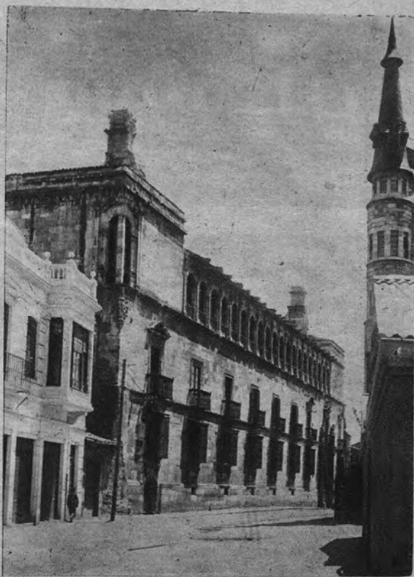
El señorial palacio de los Guzmánes, donde está instalada la Diputación Provincial

Por eso también ha querido la Diputación rodear de árboles, setos y flores, la infancia desamparada. Lejos, por fortuna, los antiguos Hospi-