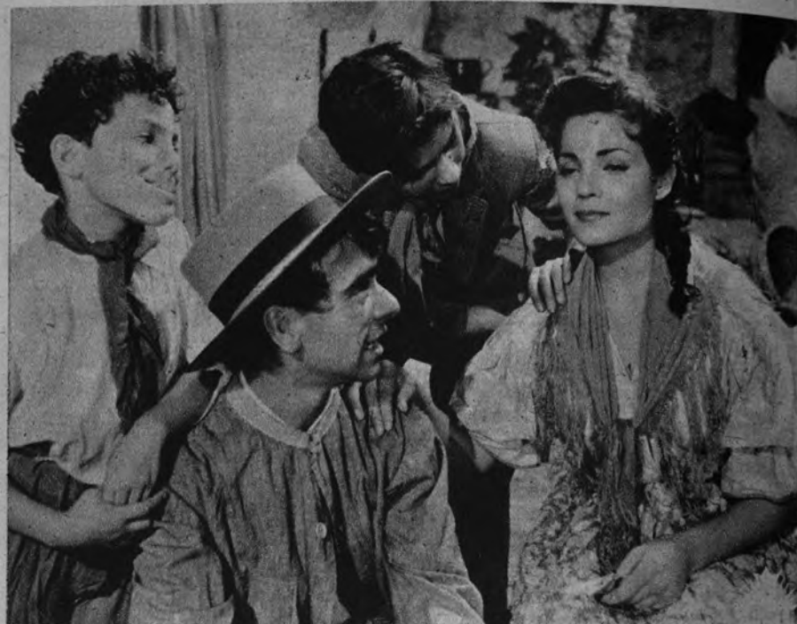
Aquí tienen a la gitana "Colorín" (Carmen Sevilla) rodeada de calés. Con un hambre, que ven un pollo y se comen hasta el kikiriki

ALGUIEN dijo en una ocasión que Luis Lucia era el director de lo popular. Tenía razón. No hay película de Lucia que no dé dinero en la taquilla, que no haga hablar a la gente, que no haga sonreír de felicidad a ese público —gran número, por cierto— que acude al cine con la única y sana intención de divertirse. Entonces, ¿cuál es el truco de Lucia? ¿Cuáles son las medidas que adopta? Una muy sencilla. El busca una historia humana, la asimila, la traslada a la pantalla. Deja siempre que mande su corazón y no su cerebro: busca en las raíces de lo popular, de lo sincero, de lo de verdad. El resultado es siempre el mismo: el corazón del director llega al corazón del espectador.