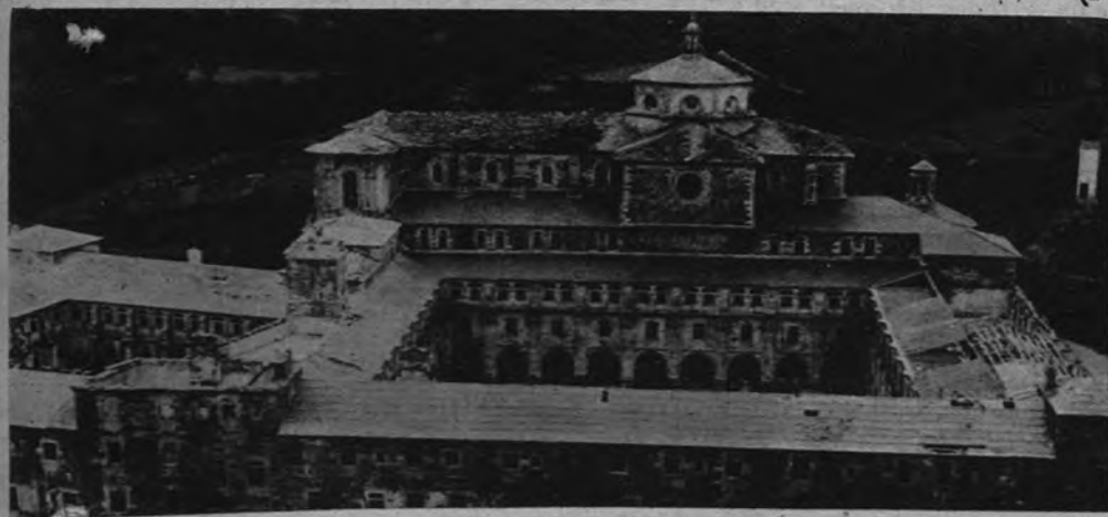
RECONSTRUCCION DE SAMOS. —Este es el consolador aspecto que ofrece la Real Abadía benedictina, después del devastador incendio de hace dos años, y restaurada con aportaciones de católicos españoles y americanos, la generosa subvención del Estado y el tesón y entusiasmo de los monjes