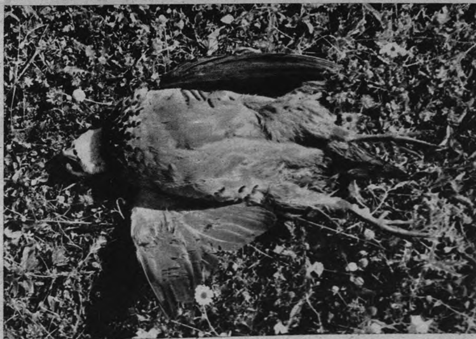
La primera perdiz cobrada en el año se examina y sopesa con gusto. Parece que su plumaje es de tonos más vivos y el dibujo más fino; como si hubiéramos olvidado ya las cobradas en años anteriores.