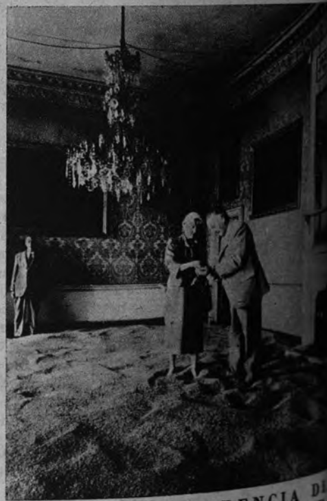
RESIDENCIA DE LORD, PARA GRANERO. —Ante las dificultades para encontrar un sitio seco, lord Clifford, de Chedleing, utiliza su residencia palaciega como granero. Lord y esposa en la cereal alfombra de uno de sus salones