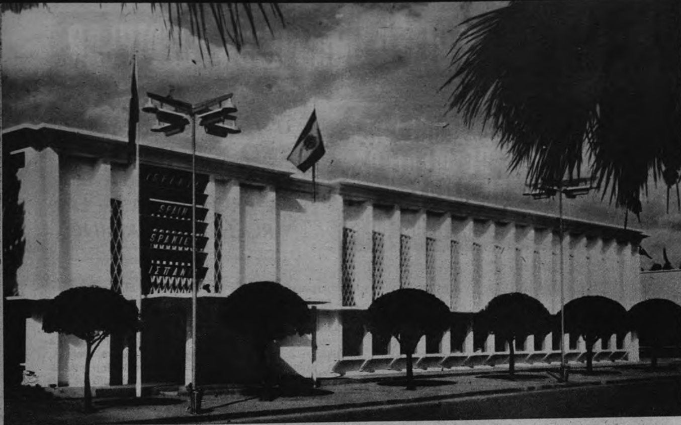
MUESTRARIOS ESPAÑOLES EN ES-MIRNA. —Este es el pabellón de España en la Feria Internacional de Muestras que se está celebrando en Es-mirna, Turquía, y donde nuestros productos han obtenido un éxito resonante