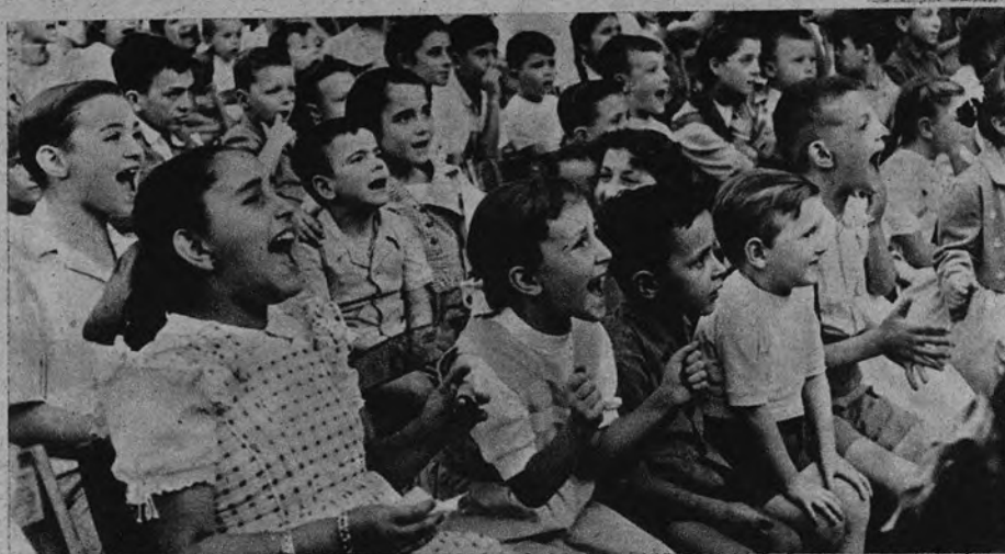
LAS FIESTAS DE LA MERCED. —He aquí dos momentos de Barcelona festejando a Nuestra Señora de la Merced, Patrona de la ciudad. Arriba, el pregón de los festejos, leído desde el balcón central del Ayuntamiento, fastuosamente iluminado. En la otra fotografía, una fiesta infantil.