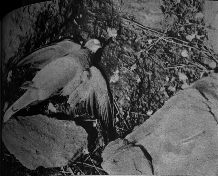
La tórtola, cuyo vuelo rápido y variado en días de viento exige soltura de movimientos y correr mucho la mano. Ahora esta especie nos deja para buscar los terrenos cálidos aptos para la hibernada.