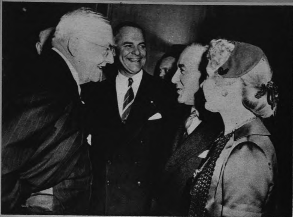
JURA SU CARGO EL NUEVO EMBAJADOR AMERICANO EN MADRID. —En el centro de la foto, muy sonriente, el señor Davis Lodge, nuevo embajador de los Estados Unidos en España, a quien acompañan su esposa, nuestro embajador en Washington y Foster Dulles, secretario de Estado.