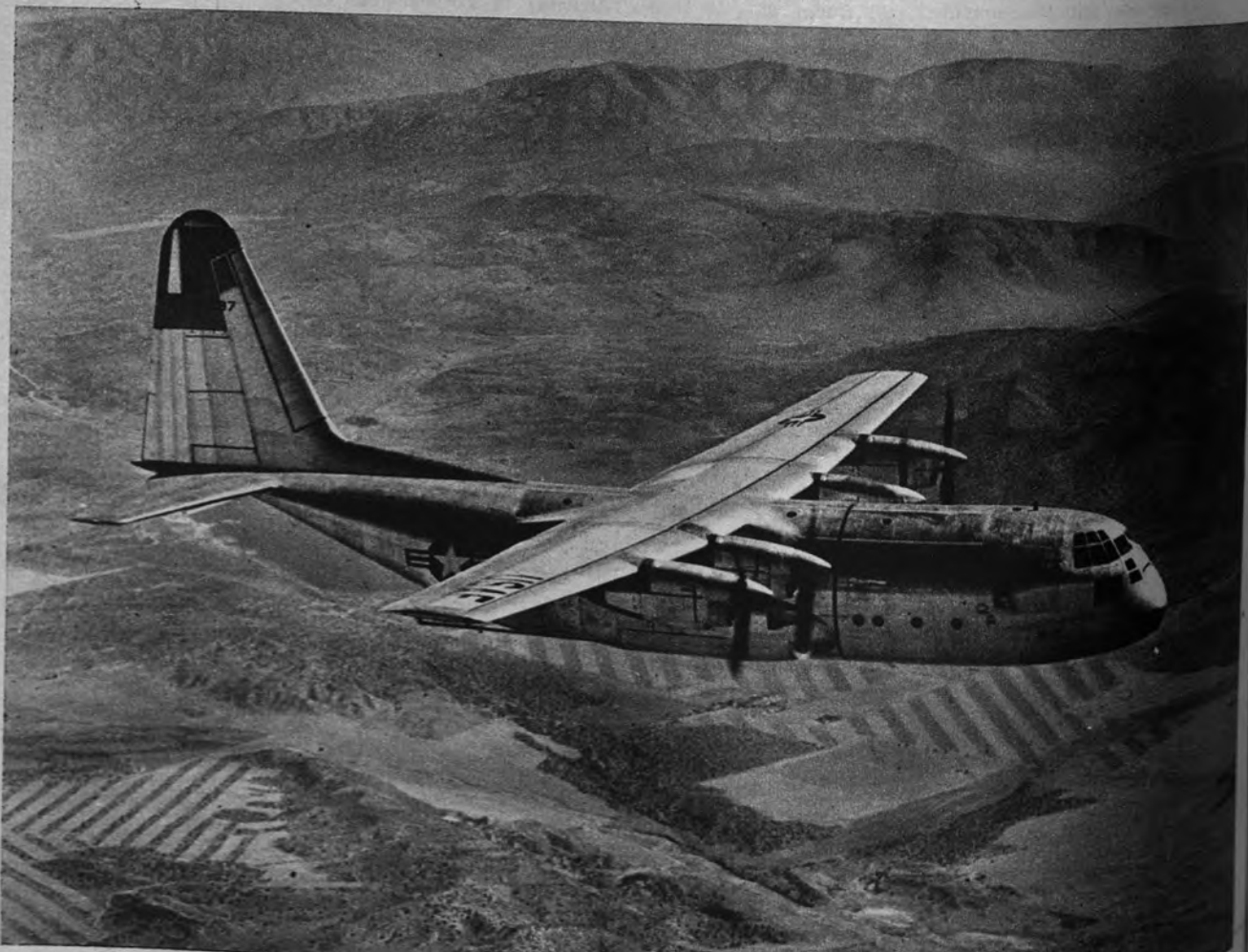
UN «HERCULES» ALADO. —Después de largos ensayos, se ha lanzado al viaje y a la serie el avión de transporte mayor y más rápido del mundo. Mi de 132 pies de envergadura, 95 de morro a cola y 38 de altura. En menos de una hora puede ser transformado en aparato hospital y despegar en pocos metros. Se le bautizó con el nombre de «Hércules»