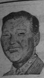
GEORGE Y. E. H.

Durante su estancia en Manila, el ministro de Asuntos Exteriores de la China nacionalista ha asegurado que su país luchará en defensa de las islas de Quemoy y Matsu sin tener en cuenta la actitud norteamericana.