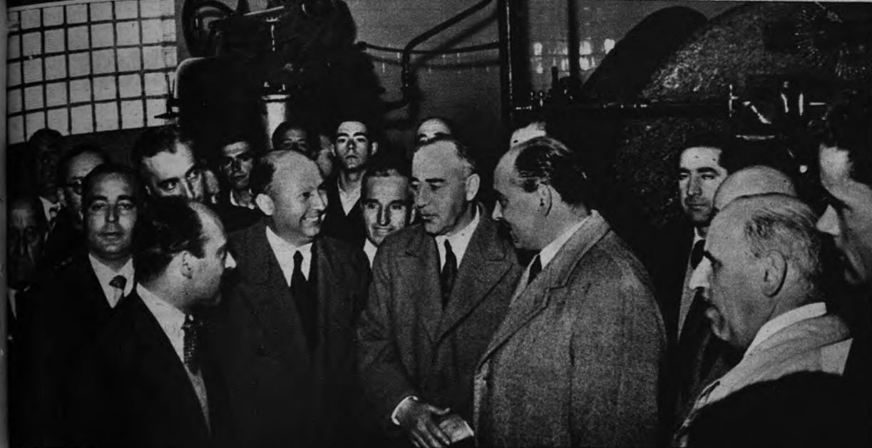
SE INAUGURAN CATORCE ALMAZARAS El Ministro de Agricultura, señor Cavestany, y el Delegado Nacional de Sindicatos, camarada Solís, acompañados por las autoridades y jerarquías de Jaén, inauguraron oficialmente, en el transcurso de un acto sindical celebrado en Martos, catorce almazaras. El vecindario de este pueblo y campesinos y trabajadores de otros lugares de Jaén asistieron a la inauguración y escucharon los importantes discursos pronunciados por el Ministro y el Delegado Nacional.