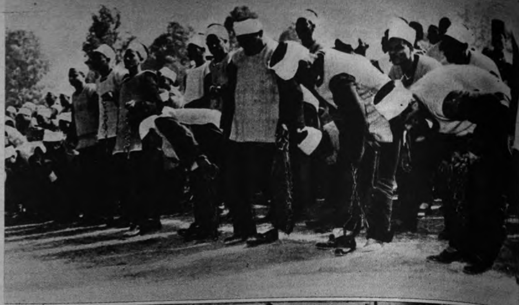
ABAJO LAS CADENAS. —El Gobierno egipcio ha suprimido el uso de cadenas y grilletes en las prisiones de su país. Los penados de la cárcel de Toura, en el acto de su desencadenamiento y en el desfile que siguió a la ceremonia.