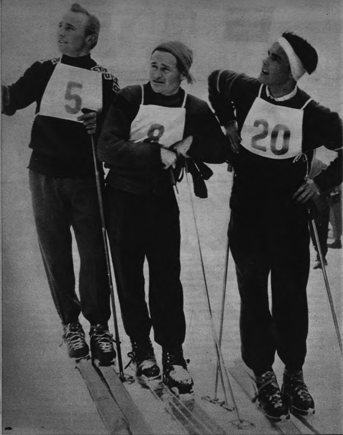
TRES GRANDES. —De izquierda a derecha vemos a Molterer con el número 5 en el pecho; Julien, con el 8, y Toni Sailer con el 20. Tres grandes del esquí, dos austriacos y un suizo.

La temporada internacional de esquí puede decirse que ha cumplido con la Semana del Mont Blanc el tercero y último acto por ahora de las grandes confrontaciones invernales, tras del veterano «Lauberhorn» de Wengen y la Semana de Kitzbuhel, triple programa de lujo del esquí mundial, con sus mejores ases alineados a la hora de partir rumbo a la endiablada danza del «slalom». Con estas tres solemnidades de la nieve se puede levantar algo así como un repaso al esquí 1955, cara a las pruebas aun pendientes, que durante este mes cerrarán los concursos del año preolímpico, precisamente por ello con doble interés para ir adivinando en la forma actual de los ases cuáles levantarán su bandera sobre las pistas de Cortina d'Ampezzo dentro de once meses. Por ahora los repasos son simples conjeturas. Pero siempre interesantes.