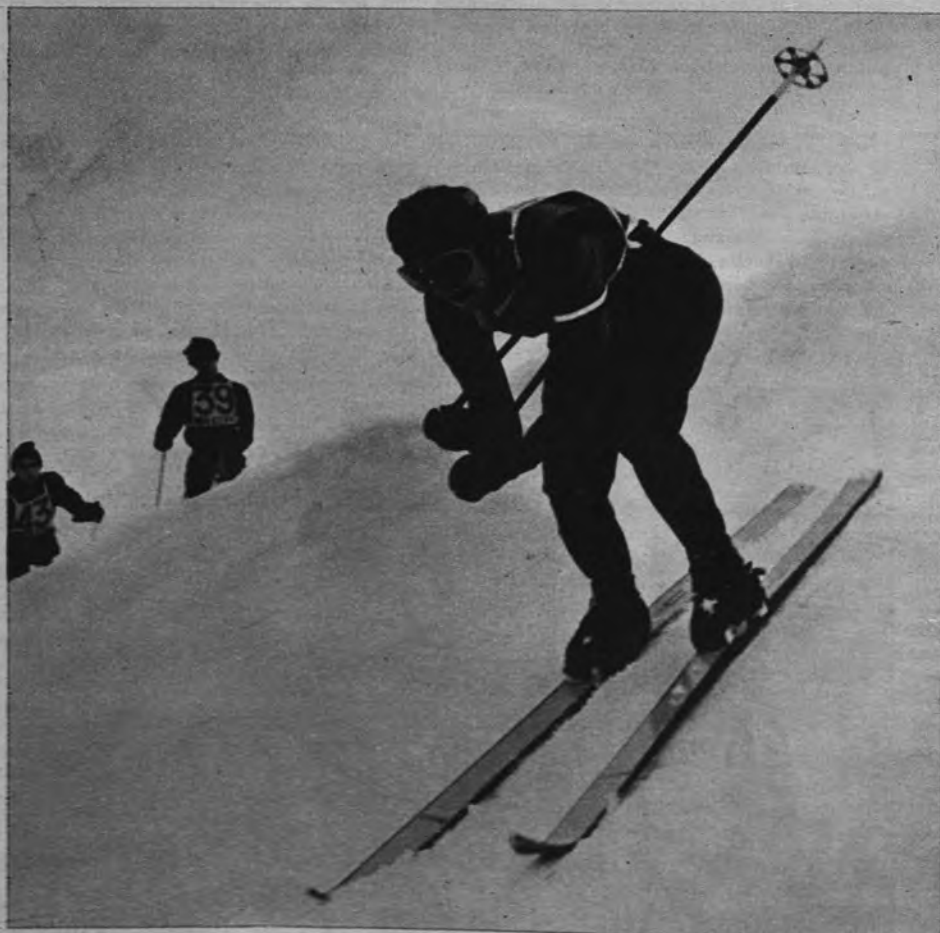
ANDERL MOLTERER. —El mejor esquiador actual, capitán de la selección austriaca y primer clasificado hasta el momento en el «Ski d'or», emprende su carrera por las pistas de Saint Gervais durante la Semana del Mont Blanc.