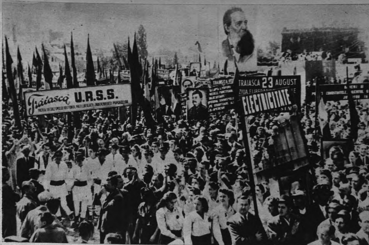
ESTO NO.—Los hombres que en Berna han asaltado la Legación comunista rumana eran anticomunistas que han querido llamar la atención del mundo ante el proceso de los rumanos que siguen oponiéndose a que el cielo de su patria sea manchado por las barbas comunistas de Carlos Marx.