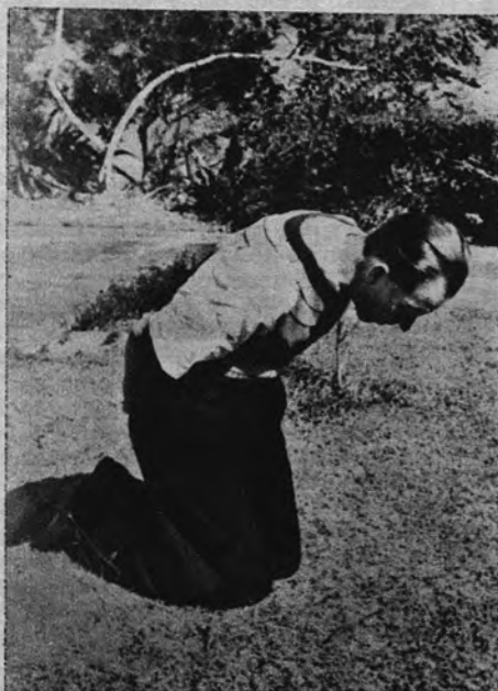
PROCEDIMIENTOS COMUNISTAS.—Los partidarios de la «coexistencia» debían recordar estas cosas: un misionero norteamericano fué obligado a permanecer así durante la celebración del juicio que le seguían los comunistas chinos «Delito»: haber protegido a los no comunistas.

rumanos que combaten en los Cárpatos y en las ciudades y que no arrian la bandera de su patria, la bandera donde canta el viento de las viejas luchas por la civilización cristiana. Y desde hace diez años, esta lucha se mantiene—aunque la silencian los hipócritas del conformismo y del aburguesamiento, la cobardía de los que no se atreven a hacer lo mismo—, aunque la máquina trituradora de la lla-