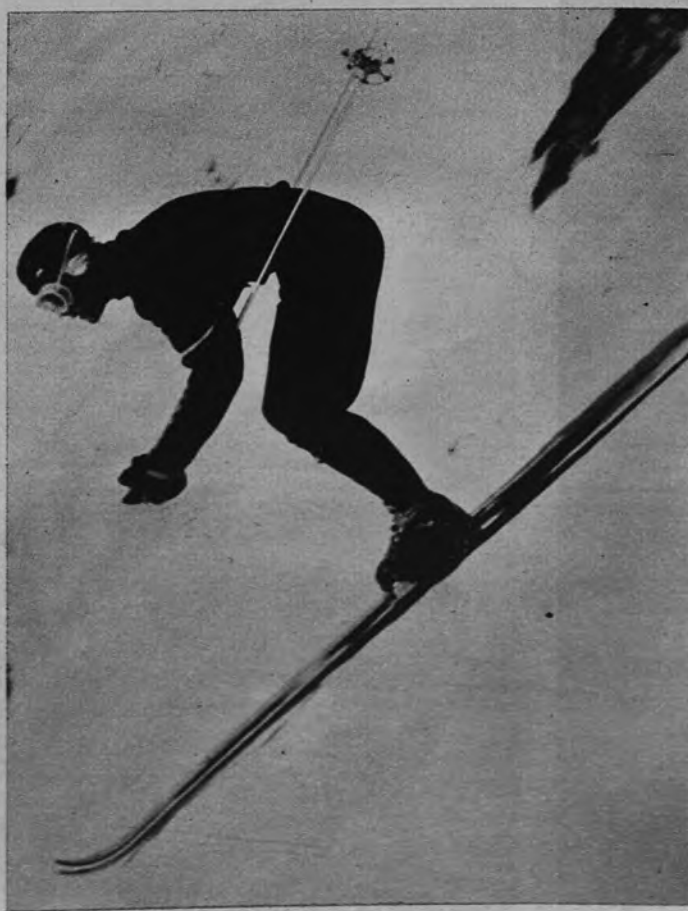
A TODA VELOCIDAD.—Toni Sailer ha sido recogido por la película fotográfica cuando desciende a toda velocidad cara al valle, vestido con su ajustado pantalón, que le proporciona cierto vago aspecto de Fantomas del hielo.

mo es natural, encabeza Austria la clasificación, con 480 puntos; seguida de Francia, con 175, y de Suiza, con 102. La jerarquía del esquí europeo—que quiere decir el esquí mundial—sigue un orden tradicional respecto al campeón. Pero el segundo puesto francés, en disputa con Suiza, debe reconocerse como un triunfo galo, que va renovando su equipo con hombres de refresco y deben seguir por delante de los suizos durante algún tiempo, por lo menos.