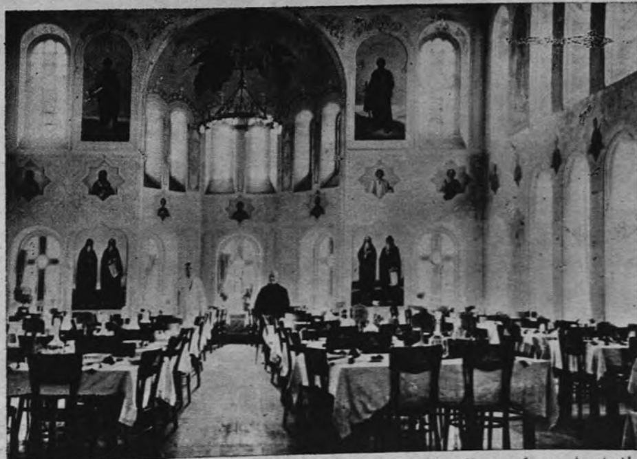
RUMANIA, ESCARNEGIDA.—Difícilmente podrán ser considerados por la conciencia de seres civilizados, representantes rumanos quienes han convertido las iglesias en salas de fiestas para las tropas rusas invasoras.