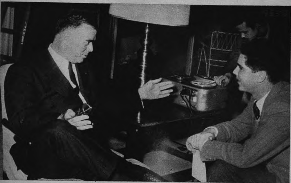
CONFERENCIA DE PRENSA. —El general norteamericano Van Fleet, antiguo comandante en jefe de las tropas que combatieron en Corea, fotografiado durante su conferencia de Prensa en Madrid