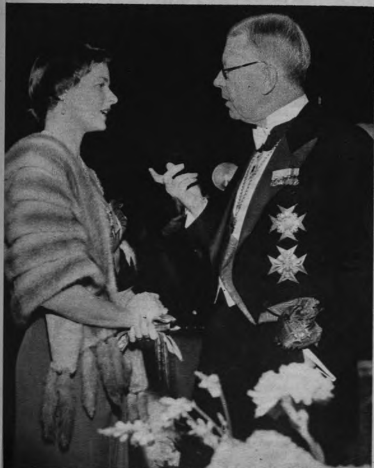
EL BAILE DE LA INOCENCIA. —No sabemos bien con qué motivo, pero todos los años se celebra en un hotel de Estocolmo el baile llamado de la Inocencia. Este año asistió Ingrid Bergman, que conversó con el Rey