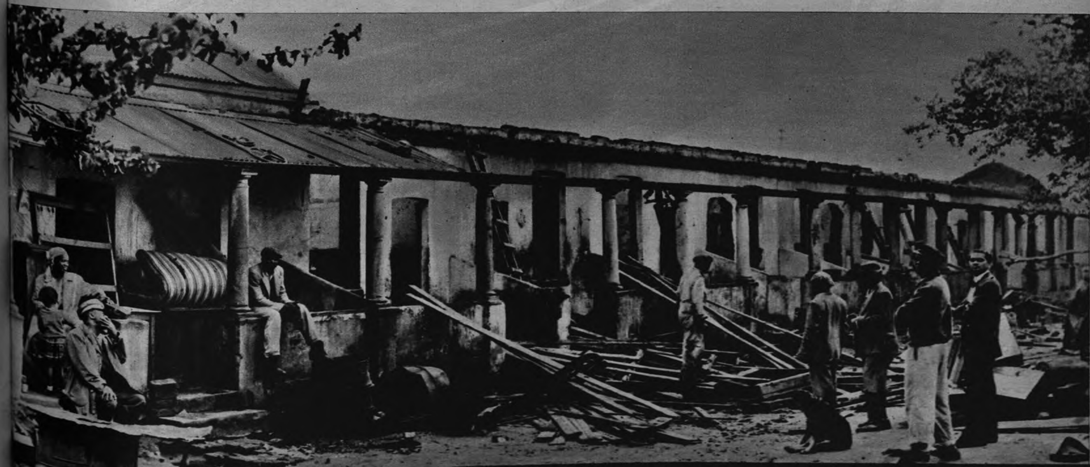
EL RACISMO EN AFRICA En Johannesburgo los negros no pueden vivir cerca de los blancos. Desde el suburbio de Sophiatown los de color son evacuados a nuevos hogares situados fuera del perímetro de la ciudad, y sus antiguas casas son destruidas. Esperemos que estas medidas racistas no le sean atribuidas a Hitler