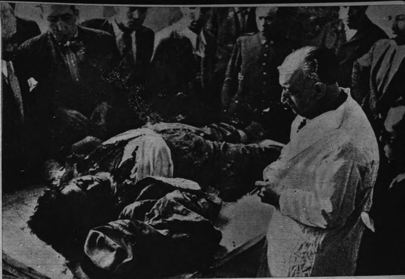
Después del espantoso asesinato decretado por el Gobierno, el cadáver de Calvo Sotelo fué llevado a la mesa del Depósito del cementerio del Este. Los doctores Piga y Aznar emitieron un luminoso informe sobre el execrable crimen.

El sacrificio de José Calvo Sotelo ha asignado a este político ilustre un puesto indiscutido en la Historia. Su figura no puede ser, por tanto, reivindicada con matices partidistas, porque ello equivaldría a empequeñecerla torpe y deliberadamente. La Historia no se escribe para el pasado, sino para el presente, y más aún para el futuro. Los millares de hombres españoles que ni siquiera habían nacido cuando se consumó el nefando crimen tienen derecho a que la figura de Calvo Sotelo—primero en la cronología de mártires que se inicia en julio de 1936—sea presen-