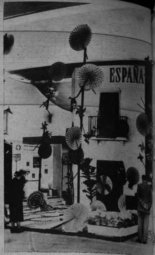
TEJIDOS ESPAÑOLES EN BRUSELAS. —Este es el pabellón que el Sindicato Nacional Textil ha instalado en el Salón Internacional de las Industrias Textiles, recientemente abierto en Bruselas.