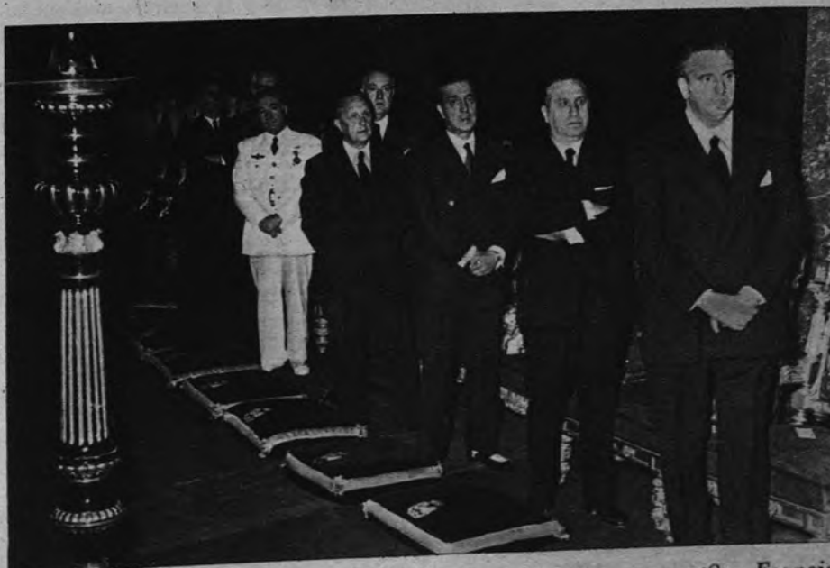
El Gobierno durante los solemnes funerales celebrados ayer en San Francisco el Grande con motivo del XIX aniversario del asesinato de Calvo Sotelo

tada en toda su pureza, al margen de colores y casuísmos, para que no sufra menoscabo la dimensión de ejemplaridad consustancial a todos aquellos que, por el holocausto de su vida, se han ganado un puesto en la crónica nacional, es decir, en la Historia.