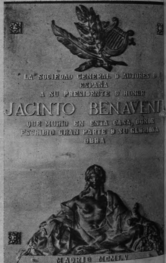
ANIVERSARIO DE BENAVENTE. —En la casa de la calle de Atocha, donde durante tantos años vivió el glorioso dramaturgo, fué descubierta ayer esta placa, obra del escultor Pinazo.