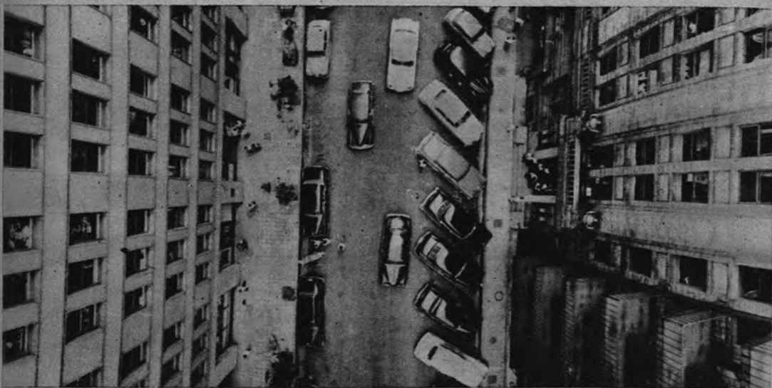
FOTOGRAFIA AEREA DESDE TIERRA. —Contra lo que pudiera creerse esta calle de Tokio no fué retratada desde un avión en vuelo a baja altura. La cámara se hallaba suspendida en un cable que unía los dos edificios opuestos, y el fotógrafo disparó el obturador desde el suelo, mediante un sencillo sistema de mando a distancia.