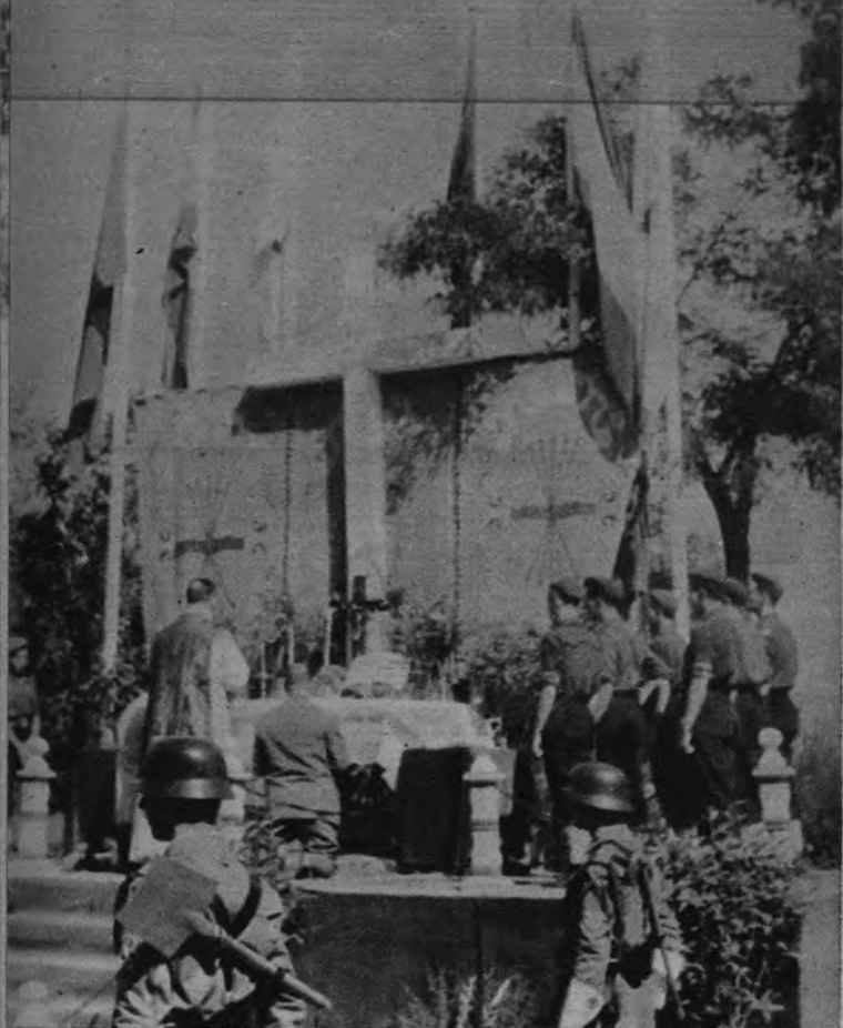
POR LOS CAIDOS DE LA DIVISION AZUL. —Ayer se cumplió el XIV aniversario de la salida de la División Azul. Los que regresaron y las familias de los que no volverán jamás, ofrecieron juntos sus oraciones por los ausentes, en una misa de campaña que se rezó en el paseo de Moret.