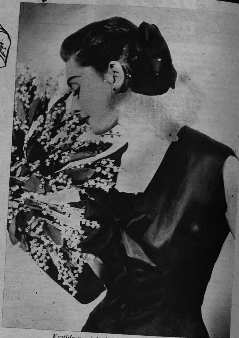
Vestido y original abanico, de Jean Patou

No hace falta advertir que en estas sombrillas, construidas por mitad con la técnica habitual de las