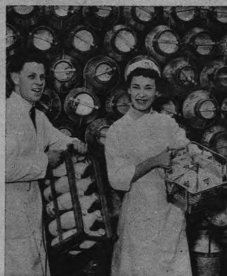
NUEVO ENVASE PARA LA LECHE. —En París se utiliza un nuevo sistema de embotellado para la leche. Se trata de recipientes de cartón en forma de pirámide, que se cierran herméticamente.