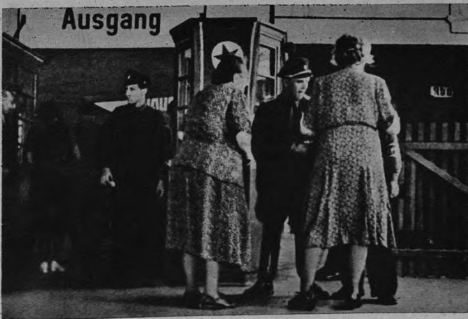
ALEXANDER PLATZ. —Fué el título de una famosa novela comunista de antes de la guerra. Sigue siendo el nombre de una estación del Metro situada en el sector soviético. Ante las entradas vigilan policías populares rojos

Si los almacenes de Stalin Allee—siempre H. O. «Handel Organisation»—ofrecen un aspecto relativamente occidental—aunque sin el menor intento de estética—, los que he visto en las calles más alejadas aparecen oscuros y polvorientos. Los compradores, antes de adquirir el más mínimo par de cordones de zapatos, tienen que presentar su documento de identificación como habitantes en el Berlín oriental. Y puede ocurrir, además, que no haya cordones para los zapatos. Igual sucede con el azú-