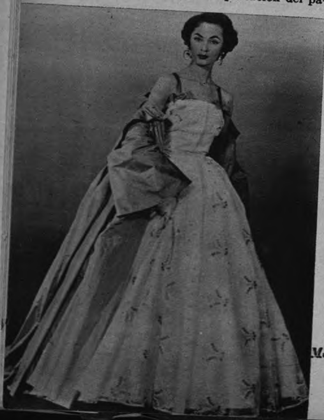
Modelo, de Pierre Clarence

Pues por más que los institutos de estética femenina clamen, con fervores renovados últimamente, contra los peligros de los rayos solares en el rostro de la mujer; aun que los especialistas de belleza adviertan con fórmulas protectoras que el sol mal administrado es un enemigo, y sepan ustedes que a las mujeres norteamericanas no les gusta verse excesivamente tostadas—por lo que es extraño no se opte aquí en seguida por el mimetismo—, la sombrilla sigue provocando siempre, en las latitudes más civilizadas, idéntica acogida: la risa.