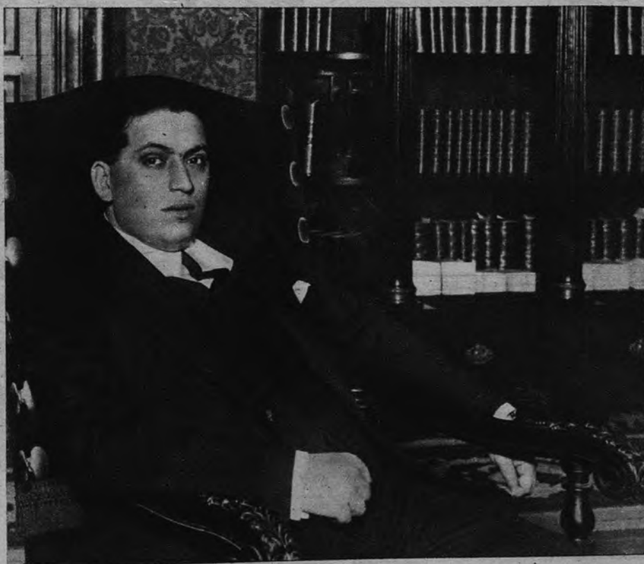
El insigne político y patriota, en los años en que, como Ministro de Hacienda del Gobierno del general Primo de Rivera, llevó la salud y el equilibrio a las arcas nacionales