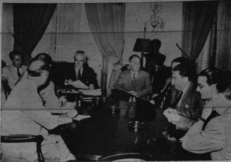
CONFERENCIA DE PRENSA. —El Ministro de Industria, señor Planell, expuso a los periodistas una relación detallada de los avances logrados en la producción de primeras materias y productos básicos durante la primera mitad del año. He aquí la conferencia de Prensa en el despacho del Ministro y en presencia del Subsecretario.