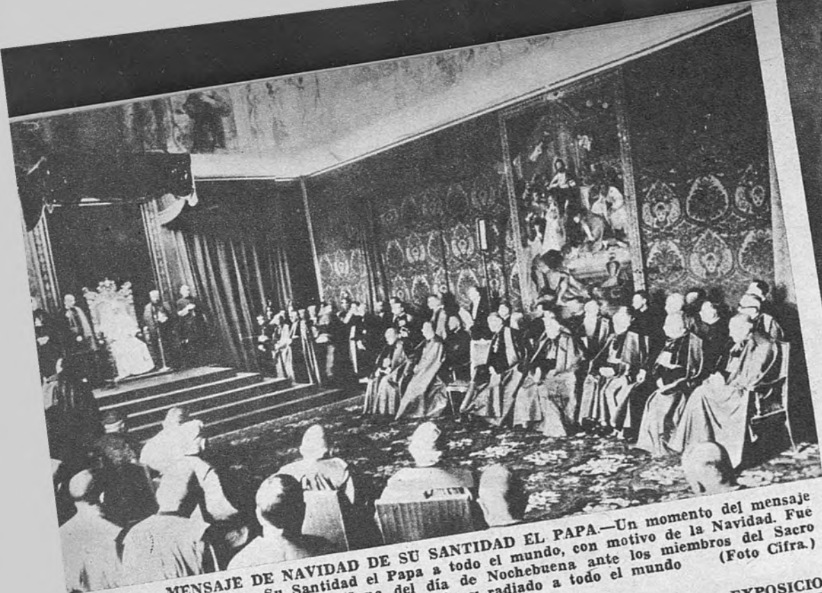
MENSAJE DE NAVIDAD DE SU SANTIDAD EL PAPA. —Un momento del mensaje dirigido por Su Santidad el Papa a todo el mundo, con motivo de la Navidad. Fue pronunciado en la mañana del día de Nochebuena ante los miembros del Sacro Colegio Cardenalicio, y radiado a todo el mundo