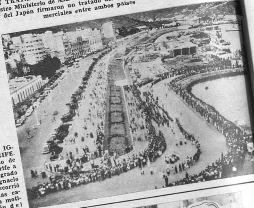
RELIQUIA DE SAN IG- NACIO, EN TENERIFE. Una vista del puerto de Santa Cruz de Tenerife a la llegada de la sagrada reliquia de San Ignacio de Loyola, que recorrió procesionalmente las calles tinerfeñas con motivo de la celebración del Año Ignaciano