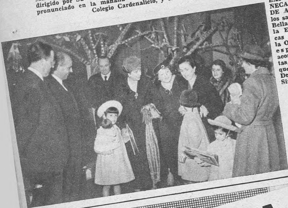
EXPOSICION DE MU- NECAS DE LA OBRA DE ARTESANIA. — En los salones del Círculo de Bellas Artes se inauguró la Exposición de muñecas organizada por la Obra de Artesanía. La esposa del Caudillo, acompañada de sus nietas, presidió el acto, al que también asistieron el Delegado Nacional de Sindicatos y el Jefe de la Obra de Artesanía