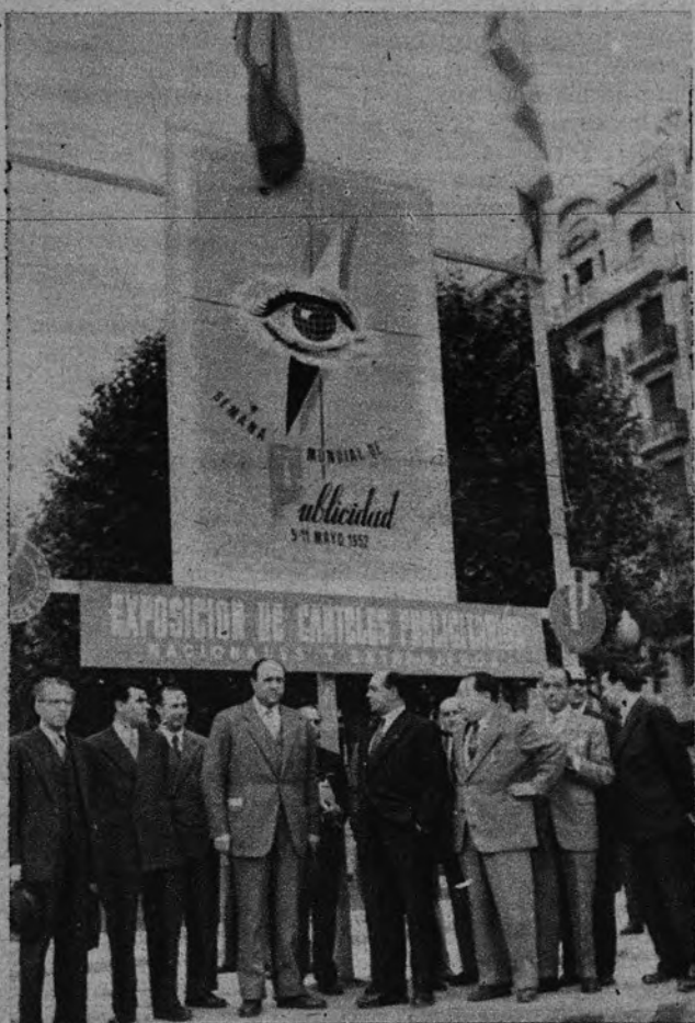
SEMANA MUNDIAL DE PUBLICIDAD. —El Delegado Nacional de Sindicatos, camarada Solís, acompañado de otras jerarquías y autoridades, visitó en Barcelona la Exposición de Carteles Publicitarios que allí se exhiben.