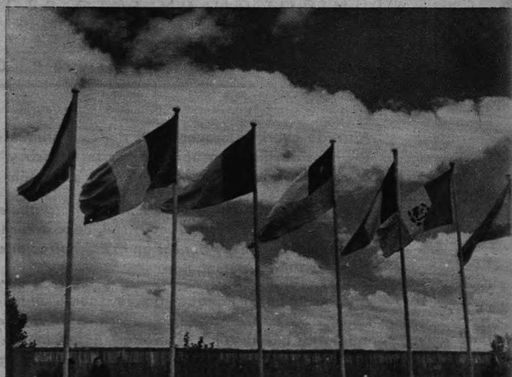
CONCURSO HIPICO INTERNACIONAL En la Casa de Campo se ha inaugurado el Concurso Hípico Internacional con mucha concurrencia de aficionados, que no se dejaron arredrar por el tiempo. He aquí las banderas de las naciones que envían sus equipos a competir con el nuestro.