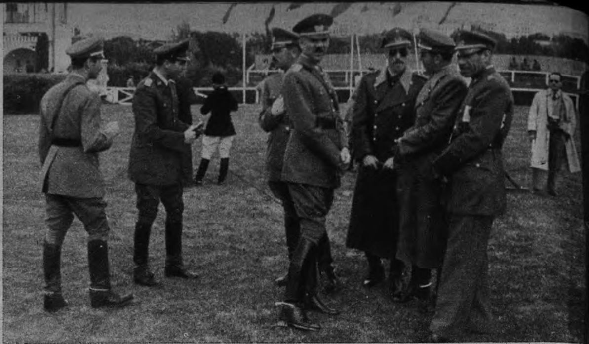
Oficiales de distintos países, que participan en el Concurso Hípico Internacional que se está celebrando en Madrid, durante un descanso.