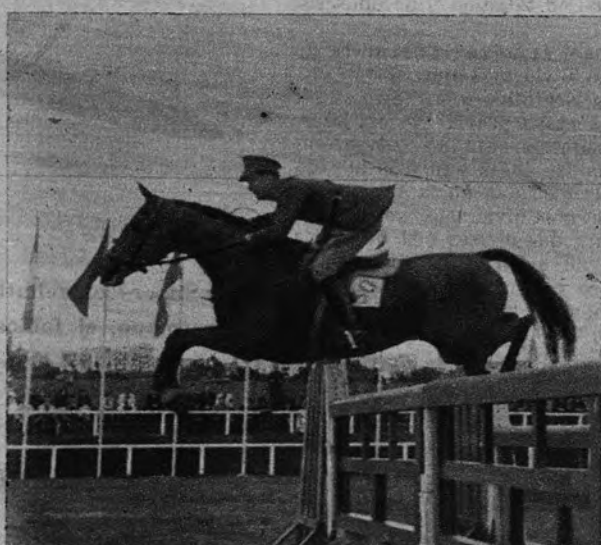
El capitán Magee, de Irlanda