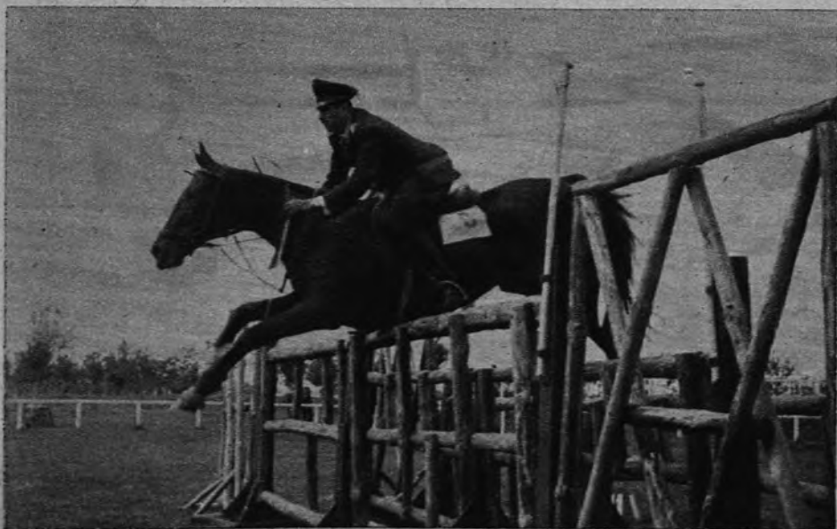
El teniente Mendoza, de Chile