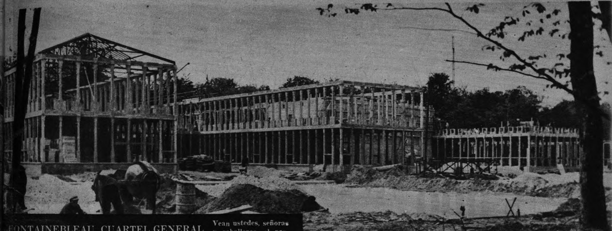
FONTAINEBLEAU, CUARTEL GENERAL Vean ustedes, señoras y caballeros, el proyecto y la realidad de lo que con el tiempo ha de ser Cuartel General de las fuerzas aéreas aliadas en la Europa Central. La obra se debe al arquitecto Pierre Brunelli, y comenzó el trabajo con el nuevo año.