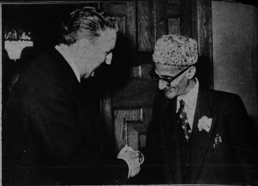
CARTAS DE ESTILO. —En la plaza de Santa Cruz, y ante el Ministro de Asuntos Exteriores, señor Martín Artajo, presentó copia de las cartas de estilo el primer embajador del Pakistán en España.