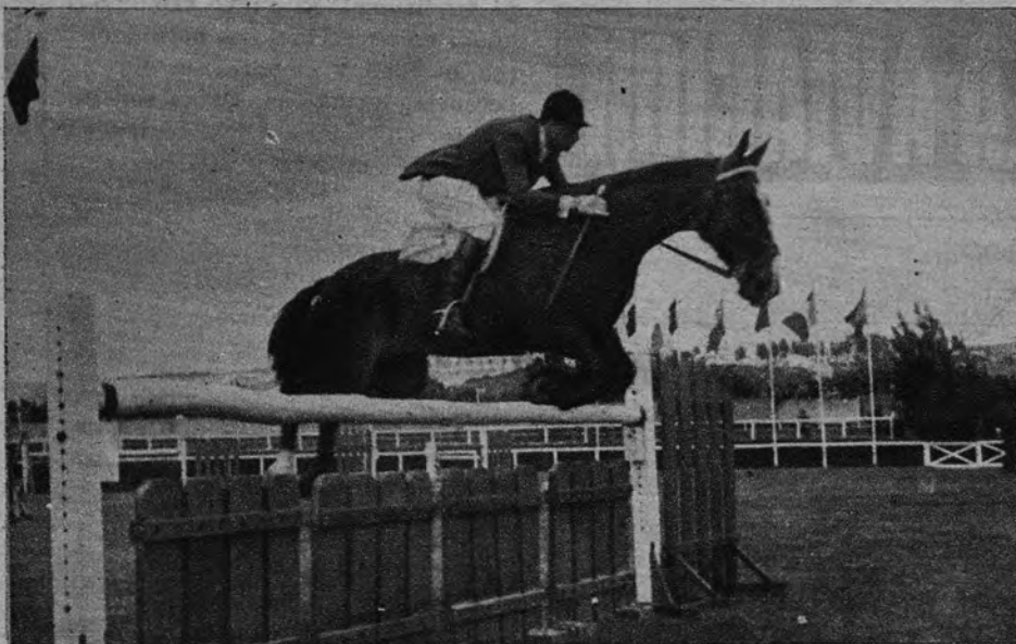
El español Goyoaga