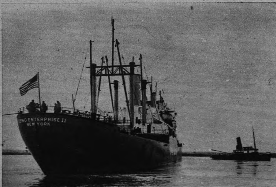
CARLSEN VUELVE A LA MAR. —He aquí, fotografiado en el puerto francés de El Havre, el «Flying Enterprise II», que manda Carlsen. Ha hecho la travesía sobre la misma ruta de su famosa y comentada aventura.