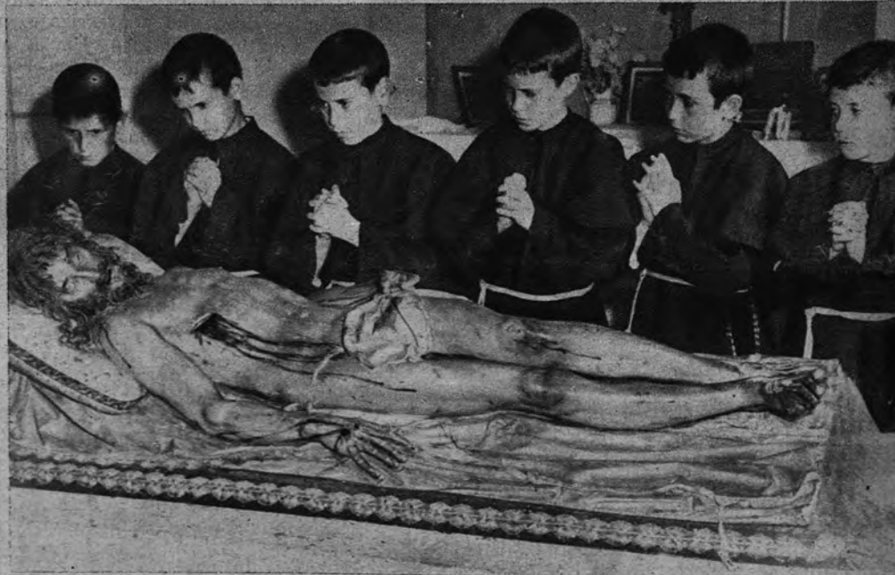
SEMINARIO DE EL PARDO. —Seminaristas capuchinos del Seminario Seráfico de El Pardo contemplan la bellísima y prodigiosa imagen yacente del Santísimo Cristo, allí venerada, y obra del inmortal Gregorio Hernández. Mañana domingo se celebra el Día del Seminario Seráfico de El Pardo

ARRIBA. —Madrid, sábado 10 de mayo de 1952