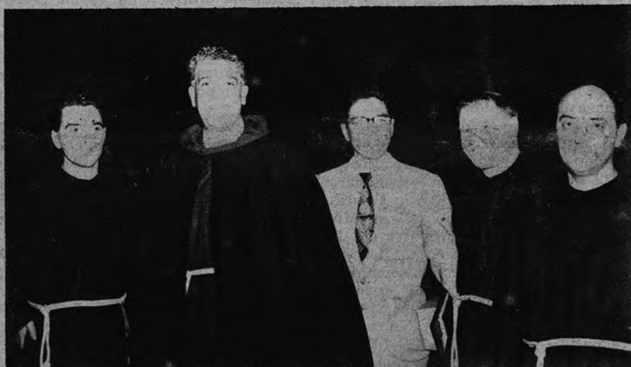
JOSE MOJICA, EN MADRID. —El que fué famoso actor cinematográfico, José Mojica, hoy fraile franciscano, se encuentra en nuestra ciudad, de paso para Barcelona, donde asistirá al Congreso Eucarístico Internacional.