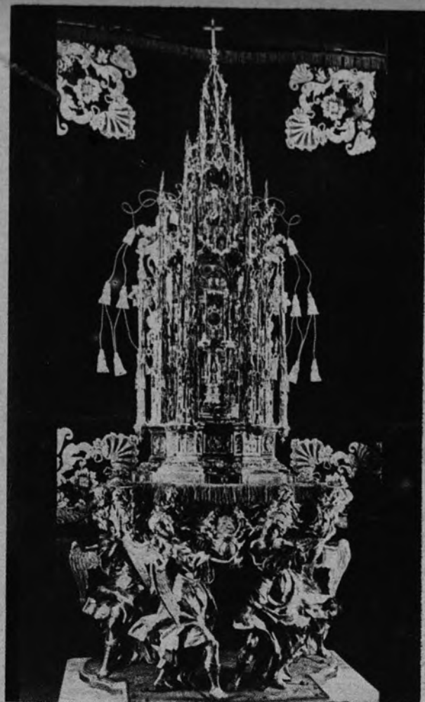
Custodia mayor, de Enrique de Arfe (siglo XVI), de la catedral de Toledo

DESDE aquel lejano día de los primeros años del siglo XIII, en que la beata Juliana de Cornillon tuvo la visión de una luna llena oscurecida por un lado mientras oraba, hasta 1246, en que el entonces obispo de Lieja, Roberto de Torfe, a instancia de las revelaciones de Juliana y después de haber oído el parecer de los doctores de la Iglesia, decidió convocar la fiesta del Santísimo Sacramento, el Corpus Christi, para el jueves siguiente a la octava de Pentecostés del año 1247, la orfebrería religiosa no conoció el motivo de su máximo esplendor.