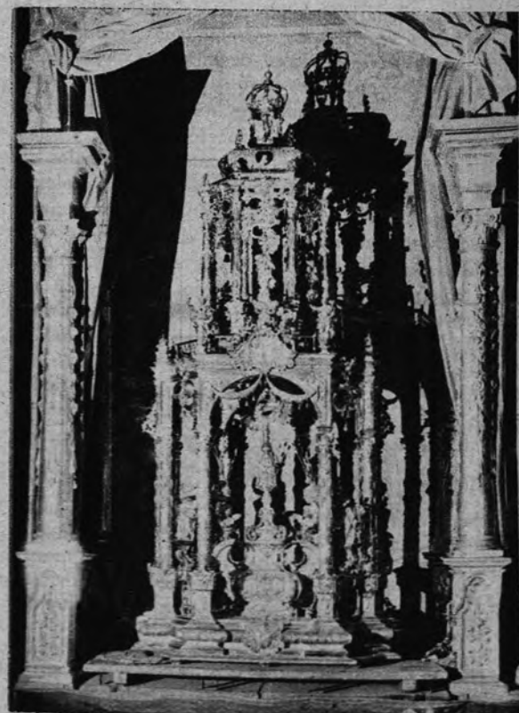
Custodia procesional de plata (siglo XVII), de la catedral de Tarragona