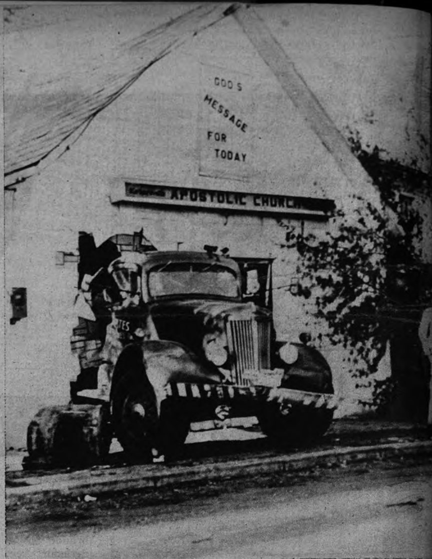
VIOLENTO DESPERTAR. —El conductor de este camión se quedó dormido al volante. Cuando se despertó, había chocado con tres automóviles y derribado la pared de una iglesia apostólica en Kirkerville (Ohio).