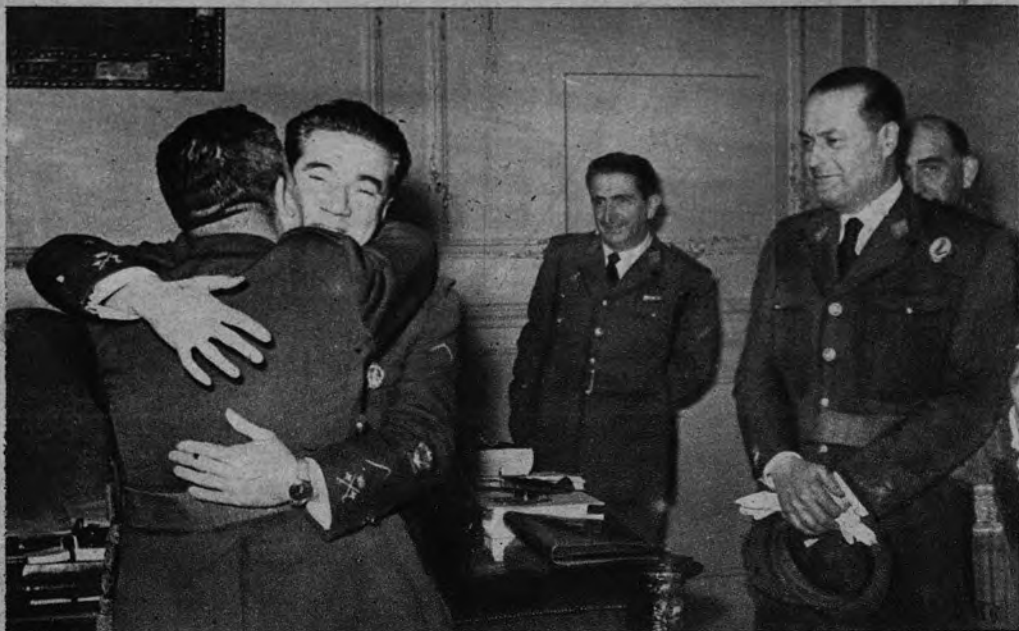
LA MEDALLA AEREA, AL MINISTRO DEL AIRE. —En la ceremonia de la imposición de la Medalla Aérea al Ministro del Aire, general González Gallarza, éste, ante el Ministro de la Gobernación, recibe la felicitación, cordialísima de su hermano.