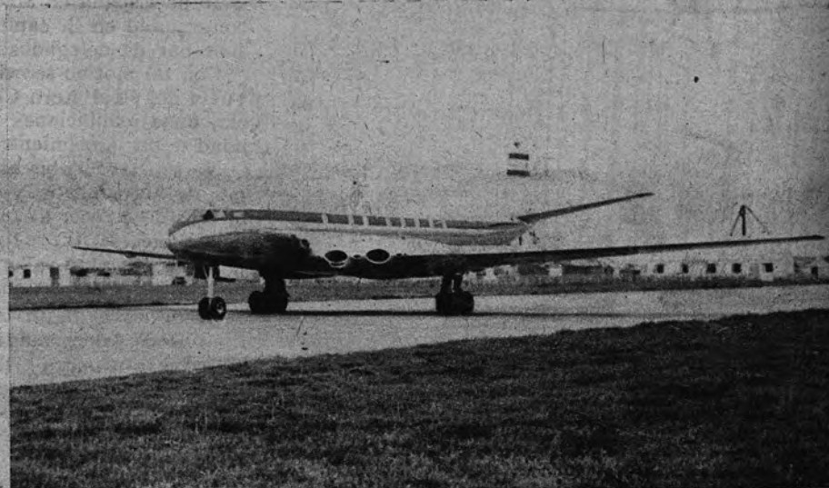
PASAJEROS A REACCION. —Este es el avión «Comet», provisto con motores de reacción. Ha inaugurado recientemente el servicio de pasajeros, llevando a bordo 36 personas, desde Londres a Johannesburgo (Unión Sudafricana).