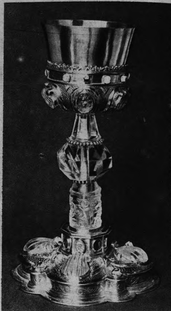
Cáliz de cristal de roca, de la iglesia de Santiago (Zamora)