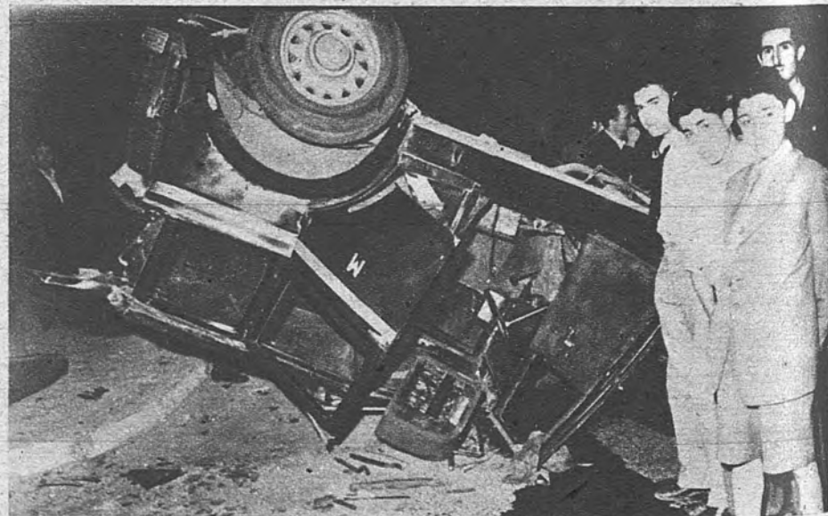
CHOQUE EN PUERTA DE HIERRO. —En este aparatoso estado quedó un taxi madrileño después del choque contra un turismo en las proximidades de Puerta de Hierro. A pesar de la violencia del accidente, sólo hubo heridos leves.

ARRIBA. — Madrid, jueves 19 de junio de 1952