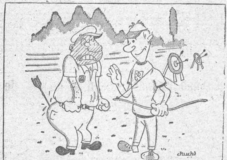
III CAMPEONATO DE TIRO CON ARCO, por "Chuchi"

Poblet-Sant. Hermandad Timoner. Bover-Corrales. Gual-Coscolluela. Damaso-Vidal Porcar. (Mencheta.)