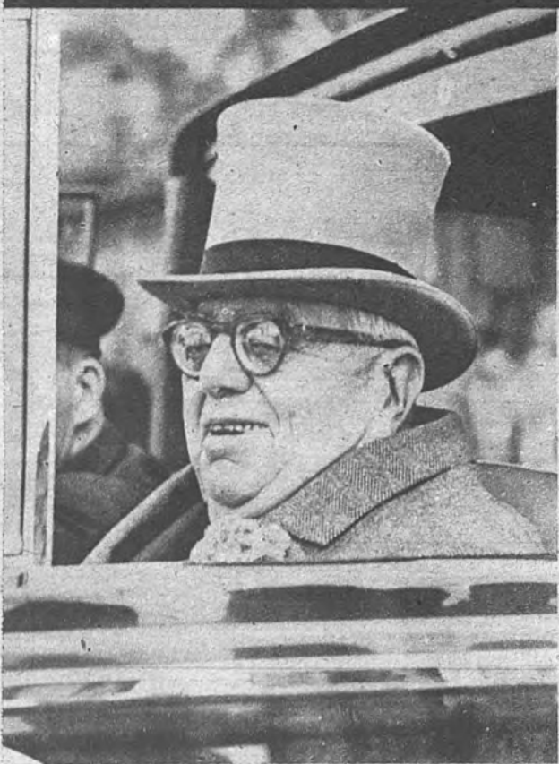
EL AGA KHAN, CONVALECIENTE. —No es precisamente entre mantas en sus habitaciones o en el pabellón de un sanatorio como se repone el Aga Khan de una reciente dolencia, sino presenciando el Derby de Chantilly desde su confortable «Rolls».