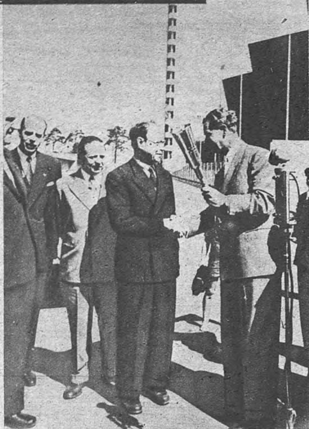
LA ANTORCHA OLIMPICA. —Un miembro del Comité Olímpico recibe la antorcha olímpica, que hoy será llevada en avión a Atenas, donde se encenderá el día 23, y será devuelta a Copenhague para que atletas, relevándose, la lleven a Helsinki.