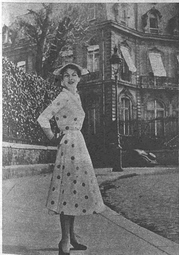
Modelo Manguin. El lunar en el traje de piqué.