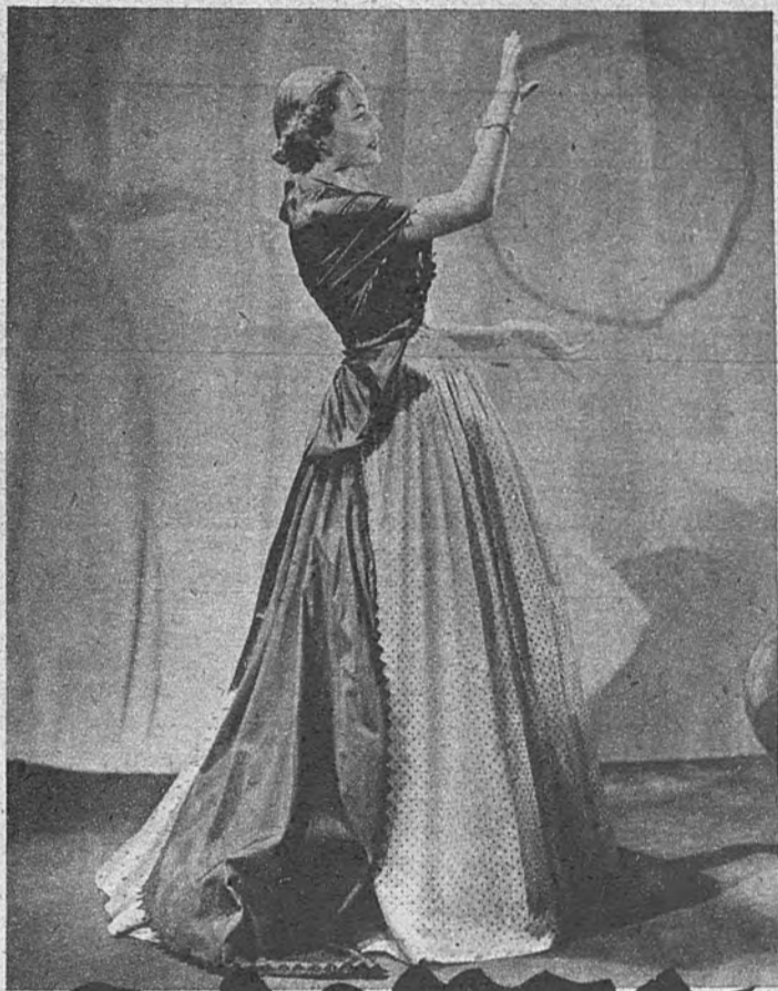
El lunar en el vestido de noche. Modelo de Manguin.

¿Cómo desligar, por ejemplo, al lunar de la gitanería errante?