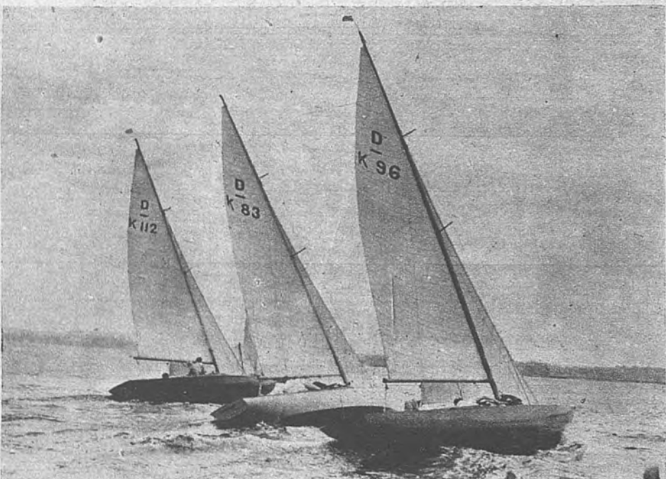
NAVEGA, VELERO MIO. —El Torquay Yacht Club se entrena en el Atlántico con vistas a la participación en la Olimpiada de Helsinki de un equipo inglés de yates a vela. Tres rápidos y diminutos veleros marchan en cerrada formación.