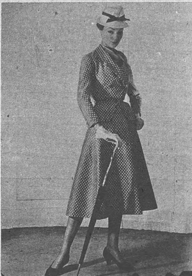
El lunar en el traje sastre de verano. Jacques Griffe.