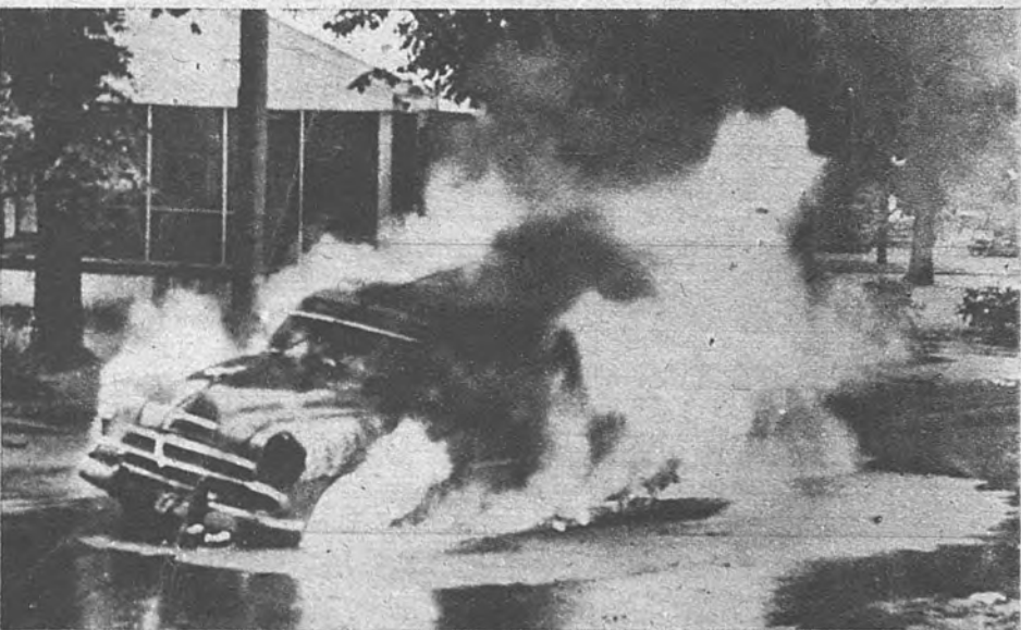
NO HUBO DESGRACIAS PERSONALES. —En una calle de Minneapolis al caer un cable de alta tensión incendió este coche, cuyos cuatro ocupantes pudieron escapar a tiempo de las llamas. Pero el coche quedó totalmente destruido.