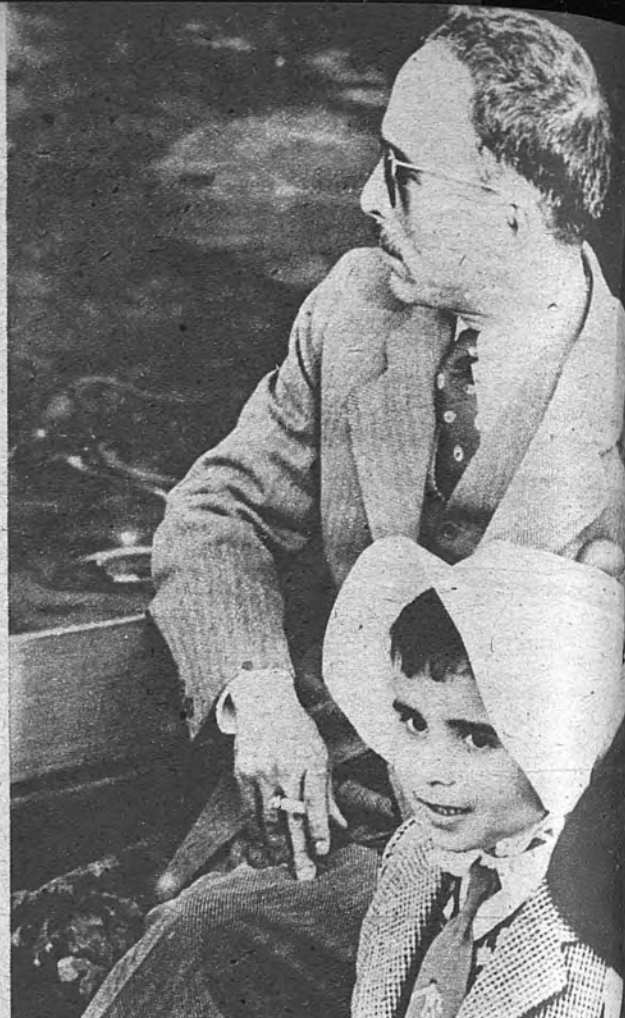
BUEN SEDANTE. —El Rey Talal de Jordania, que se encuentra en Suiza para ser sometido a curación de una enfermedad nerviosa, pasea por las tranquilas aguas del lago de Ginebra en compañía de su hijo Hassan, de cinco años.