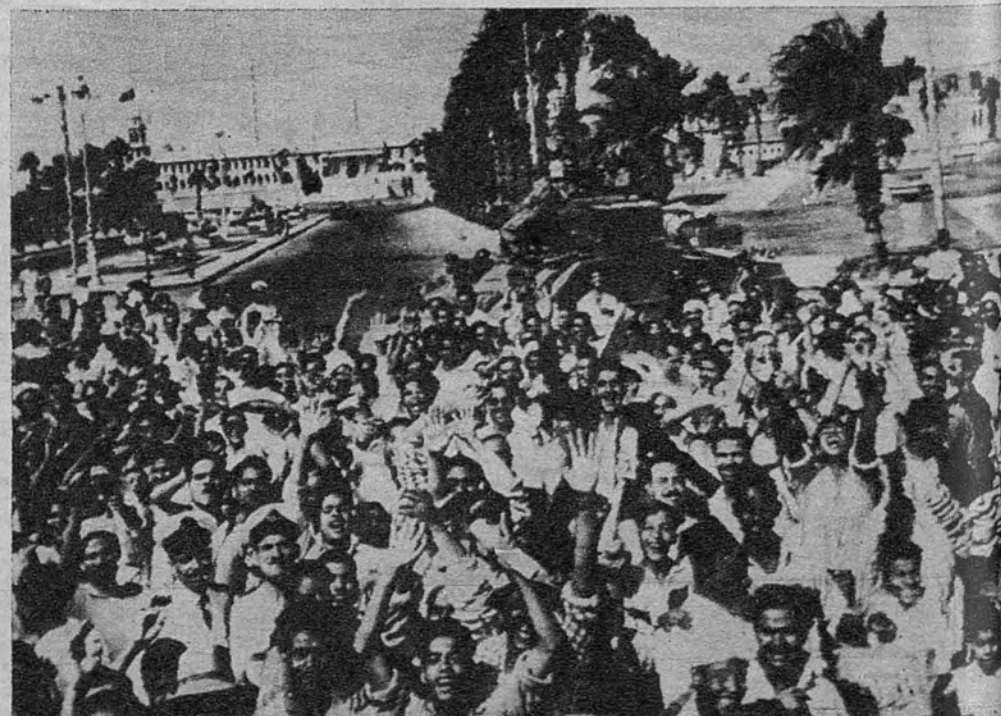
ABDICACION EN EL CAIRO. —Un grupo de manifestantes egipcios da señales de júbilo cuando se hizo público que el Rey Faruk había abdicado en su hijo, el príncipe Ahmed Fuad, desde ahora Ahmed Fuad II.