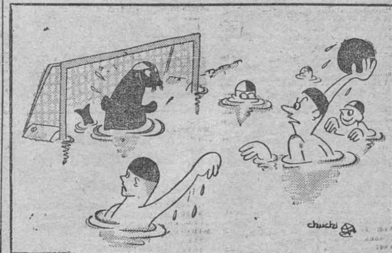
OLIMPIADA, por "Chuchi"

Como es sabido toman parte en estas pruebas las Escuelas que resultaron vencedoras en los concursos anteriormente celebrados del sector, y los aparatos, cuyo lanzamiento se efectuará durante los días de prueba, corresponden a la clase de veleros, motor libre y motor de vuelo circular. (Mencheta.)