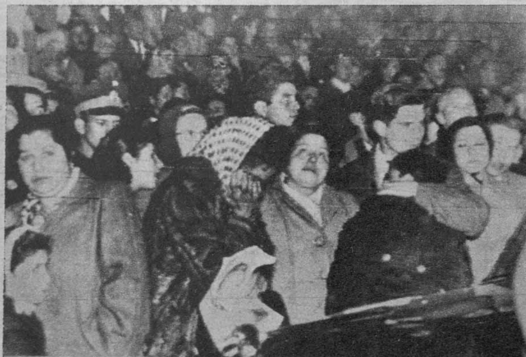
DUELO EN BUENOS AIRES. —Entre la multitud congregada ante la casa presidencial argentina se produjeron conmovedoras escenas de emoción al conocerse la noticia del fallecimiento de Eva Duarte de Perón.