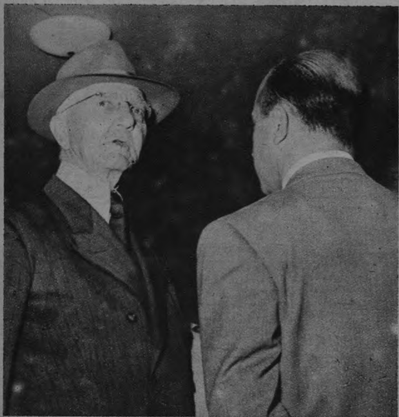
EL MAGO DE LAS FINANZAS, EN MADRID. —Ha llegado a Madrid el famoso financiero alemán doctor Schacht. Procede del Oriente Medio, adonde fué llamado por los Gobiernos de Siria y de Egipto para un cambio de impresiones sobre la situación económica de aquellos países.