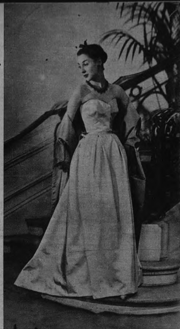
«Versalles», en satén rosa (el chal, rosa también). De Christian Dior.

UNA de las huellas, buena o mala, que nos ha dejado el romanticismo es la de querer calificar todavía a las personas—encasillándolas en los medios del arte, de la política, de la ciencia, de la economía, del trabajo manual, etcétera—por su aspecto físico.