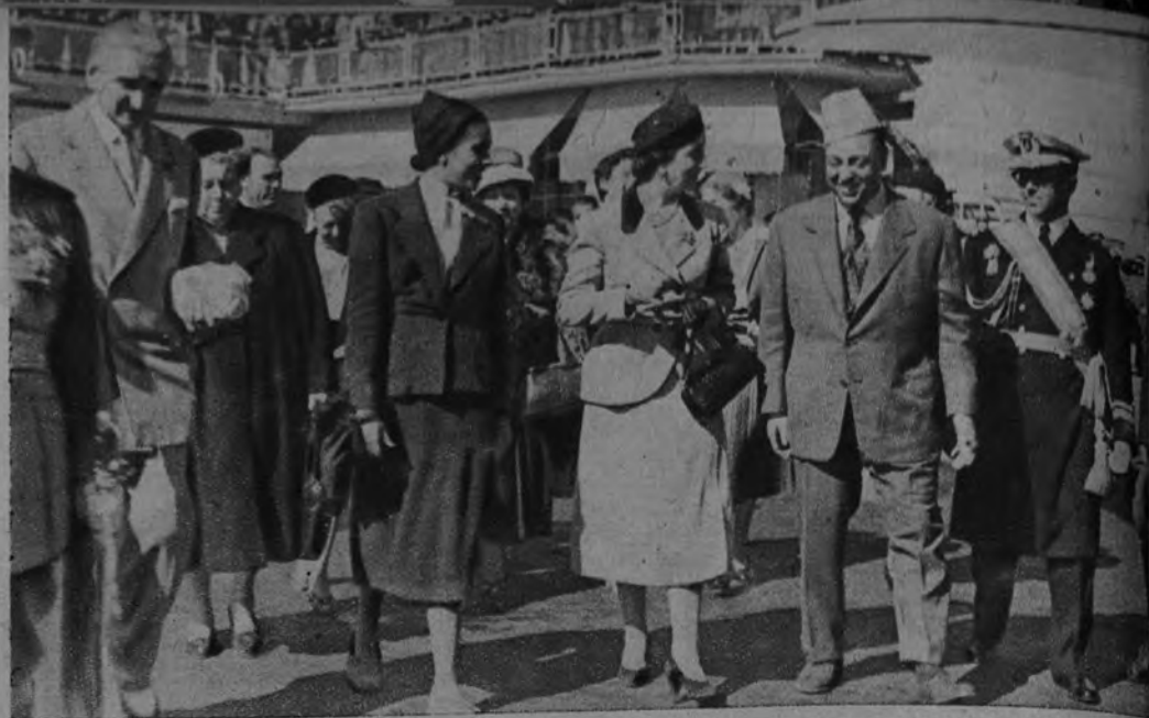
SU ALTEZA IMPERIAL EL JALIFA REGRESA A TETUAN. —En avión, han regresado a Tetuán Su Alteza Imperial el Jalifa y su esposa, después de su visita a Madrid y otras ciudades españolas. Doña Carmen Polo de Franco acudió al aeródromo de Barajas a despedirlos.