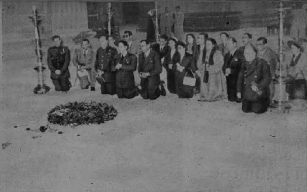
PORTUGUESES ANTE LA TUMBA DE JOSE ANTONIO. —Un grupo de la Liga de Antiguos Graduados de la Mocidade Portuguesa ha rendido homenaje a la memoria de José Antonio. Sobre la tumba del fundador de la Falange depositaron una corona de laurel.