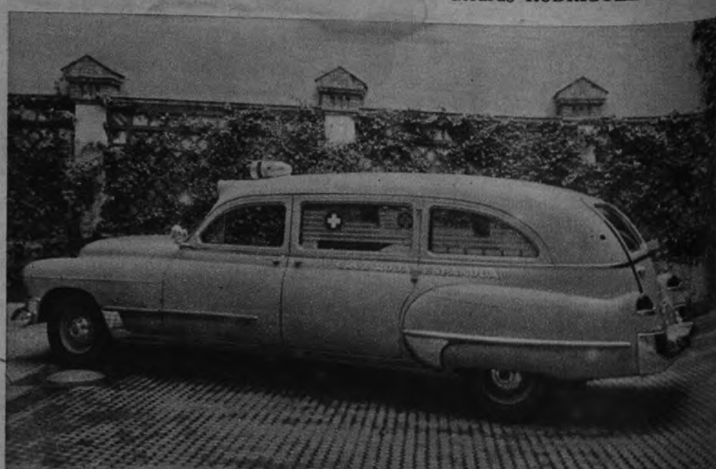
He aquí una de las doscientas dieciséis ambulancias con que cuenta para sus servicios la Cruz Roja Española. Se trata de un moderno vehículo que fue regalado a nuestro organismo nacional por una empresa financiera cubana.