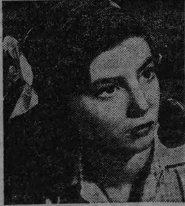
La pequeña Mivella, personaje central de "Mañana será tarde", ha sido encarnada por la gran actriz Pier Angeli, a la que nuestro público admira profundamente. "Mañana será tarde" será presentada próximamente por Chamartín en un salón de la Gran Vía madrileña.