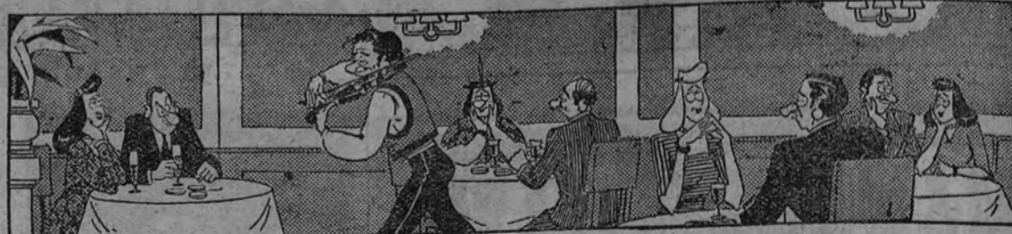
"L'AMOUR... TOUJOUR... L'AMOUR"

GOYA.—7, 11: El crepúsculo de los dioses (Gloria Swanson-Eric von Stroheim).