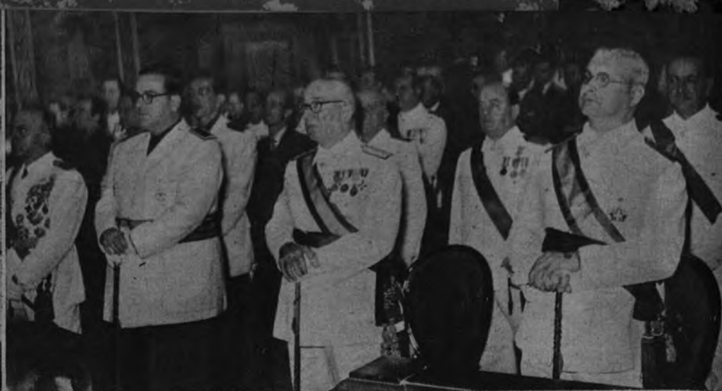
EL DIA DEL CAUDILLO EN PROVINCIAS. —El Alcalde de Barcelona, al frente del Ayuntamiento en pleno, expresó su adhesión a Franco ante el Capitán General de Cataluña. En Cartagena, el Ayuntamiento y el Consejo Local de la Falange conmemoraron con un solemne tedéum la fecha del dieciséis aniversario de la elevación del Caudillo a la Jefatura del Estado.