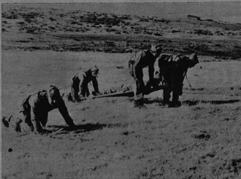
Cuatro camilleros de la Cruz Roja se ejercitan en un supuesto táctico en el Campamento de la Morcuera, donde se celebran todos los años los correspondientes cursillos y maniobras.

Pero no está de más refrescar ahora un poco la memoria sobre el funcionamiento y desarrollo en España de este organismo internacional en la víspera del sorteo de la Lotería, cuya recaudación, en un cincuenta por ciento, es la más importante fuente de ingresos fijos con que cuenta la Cruz Roja Española. El otro cincuenta por ciento se destina a otras obras benéficas de la Sanidad Nacional, como el Patronato Nacional Antituberculoso, la lucha contra el cáncer, etcétera... Puntualicemos: Este sorteo de mañana no es sólo la más importante fuente de ingresos, como acabamos de indicar, sino la única por cuanto a la Asamblea Suprema de la Cruz Roja se refiere; ya que la llamada «Fiesta de la banderita» está organizada por las distintas Asambleas locales, que son las que se benefician de sus recaudaciones.