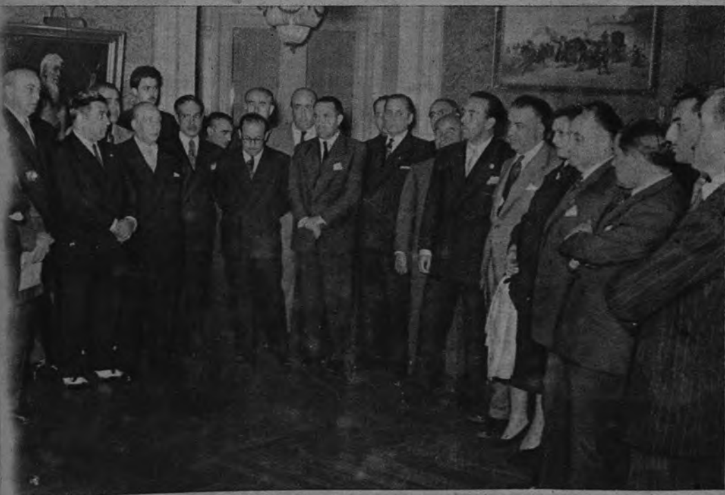
ENTREGA DE PREMIOS. —El Presidente de la Diputación madrileña, marqués de la Valdavia, entregó los premios recientemente concedidos a un grupo de queridos colegas, entre los cuales figuran cuatro de esta casa.