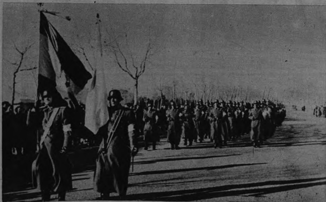
El presidente de la Cruz Roja Internacional, M. Krueger, visitó hace unos meses nuestra capital. Y las tropas españolas del organismo sanitario le rindieron honores, desfilando, con sus uniformes y brazaletes, precedidos de la bandera nacional y de la organización.