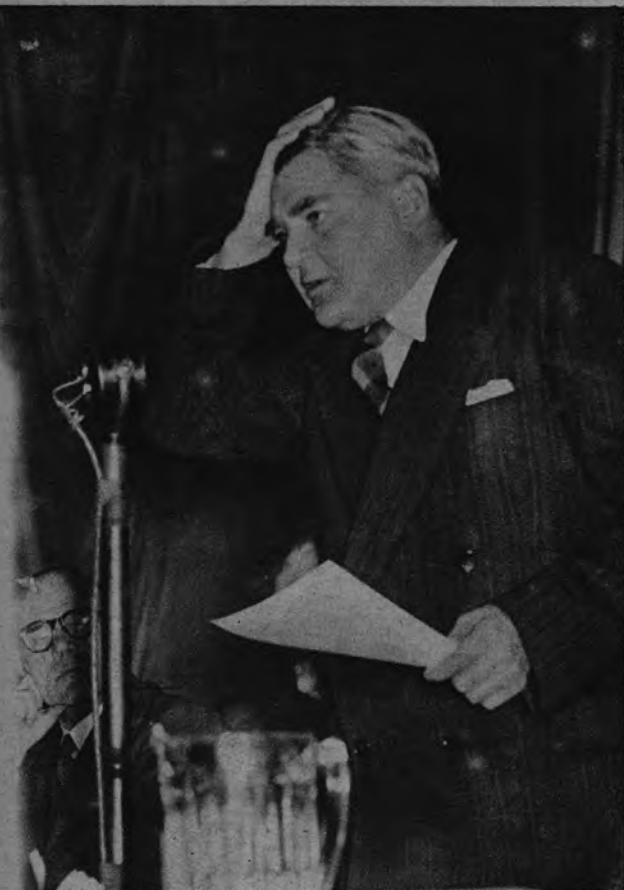
LOS LABORISTAS HABLAN DE LO SUYO. —Aneurin Bevan, jefe del ala izquierda y prosoviética de la camuflada quinta columna inglesa, se alisa el cabello, quizá calmando así la clásica «tempestad bajo un cráneo». Y la señora Bessie Braddock, miembro del Parlamento, pronuncia un discurso en apoyo de sus convicciones, que la foto no especifica de qué lado están.