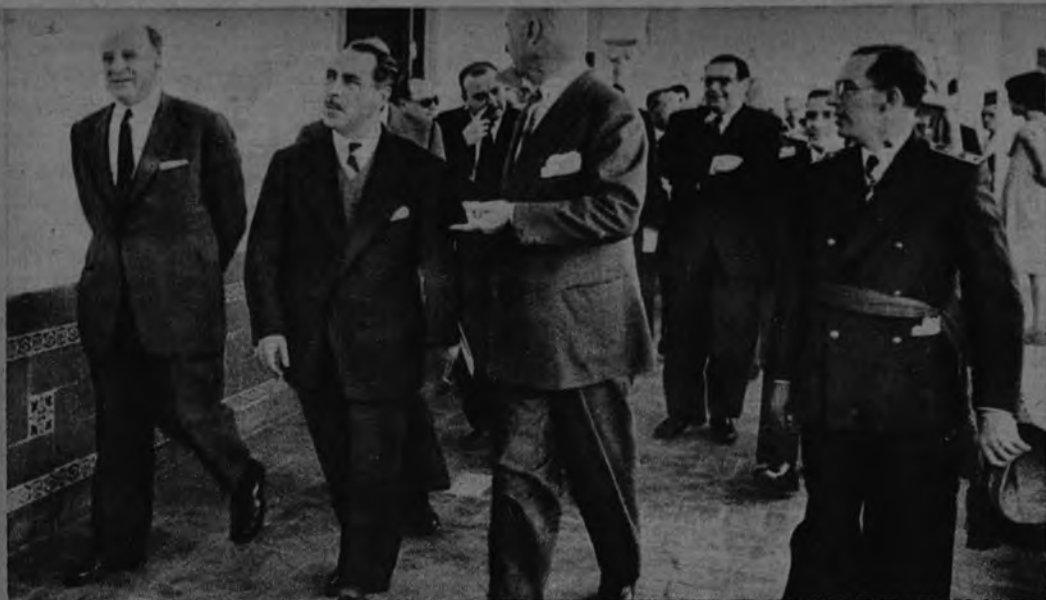
INSTITUTO LABORAL. —El director general de Enseñanza Laboral, camarada Rodríguez de Valcárcel, ha inaugurado en el Cortijo de Cuarto, de Sevilla, un Instituto Laboral.