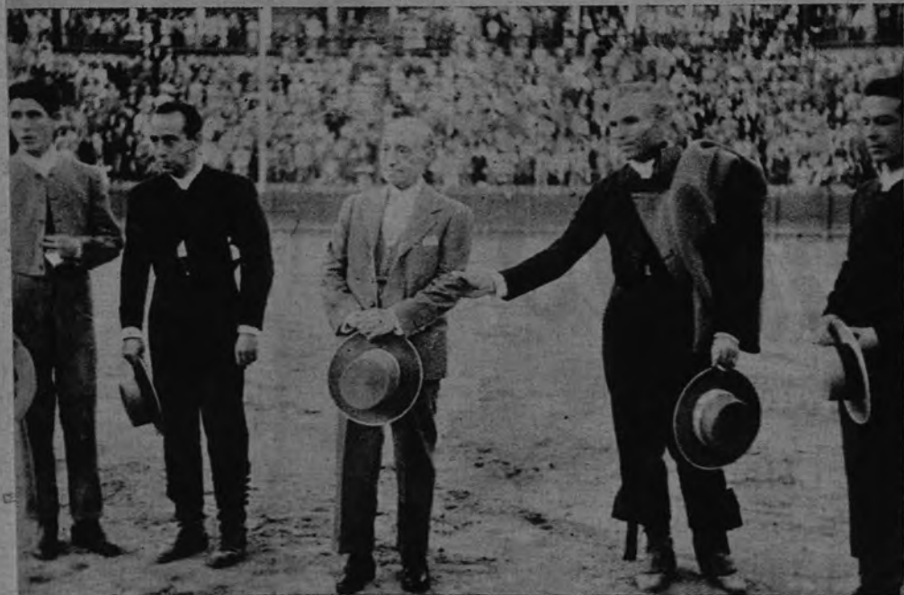
HOMENAJE A «EL GALLO». —Rafael Gómez, «el Gallo», acaba de celebrar sus bodas de oro como matador de toros. Domingo Ortega, Gallito y otros toreros se han reunido en la arena de la Maestranza sevillana en su homenaje.