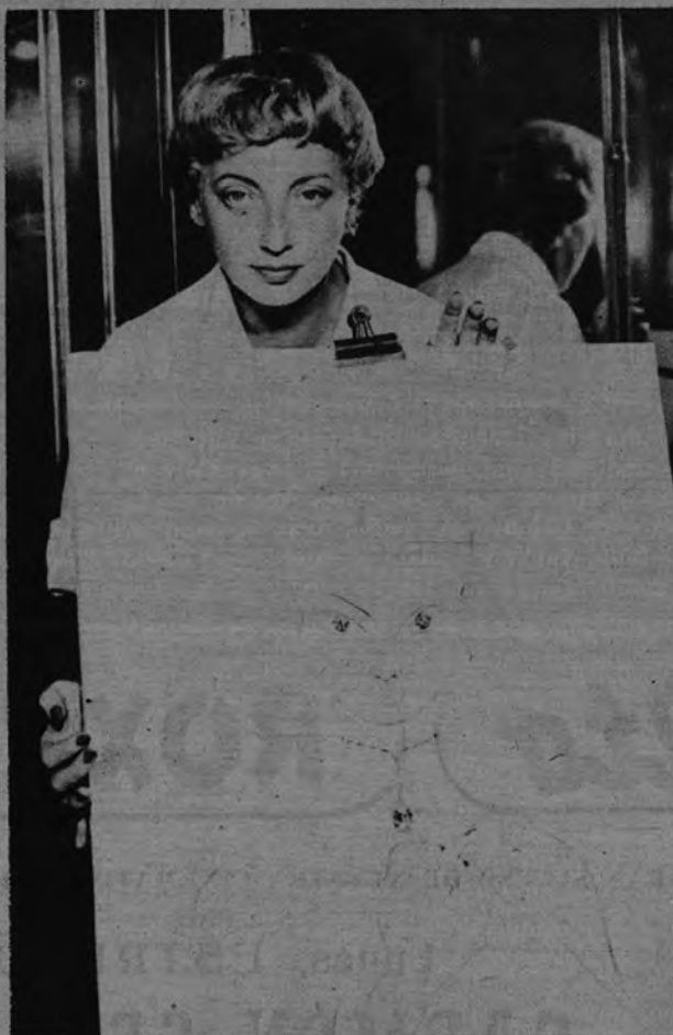
AUNQUE NO LO PAREZCA. —Este dibujo está valorado en catorce millones de pesetas. El dibujo es sólo un pretexto de Bouchérom para exponer tres diamantes, que van engarzados en los ojos y en el colgante.