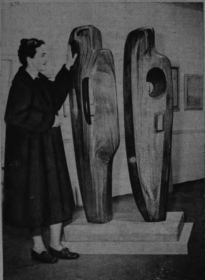
ADIVINANZA. —Bárbara Hepworth ha expuesto en Londres dos cosas hechas en madera africana. Bárbara titula a su obra «Hombre y mujer». A nuestros lectores dejamos la adivinanza de este híbrido jeroglífico.