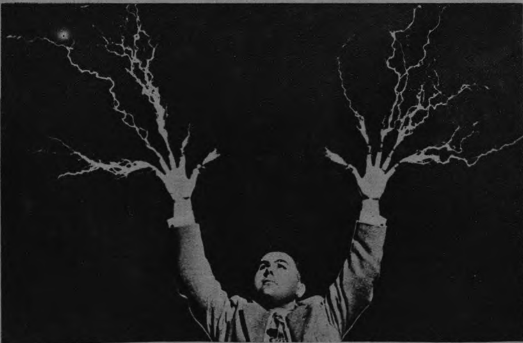
«PASEN, SEÑORES, PASEN». —Aunque parezca un número de barraca de feria, se trata de un evangelista que, tras del sermón, entretiene de esta curiosa manera. Al doctor Speake parece salirse el infierno por la punta de los dedos.