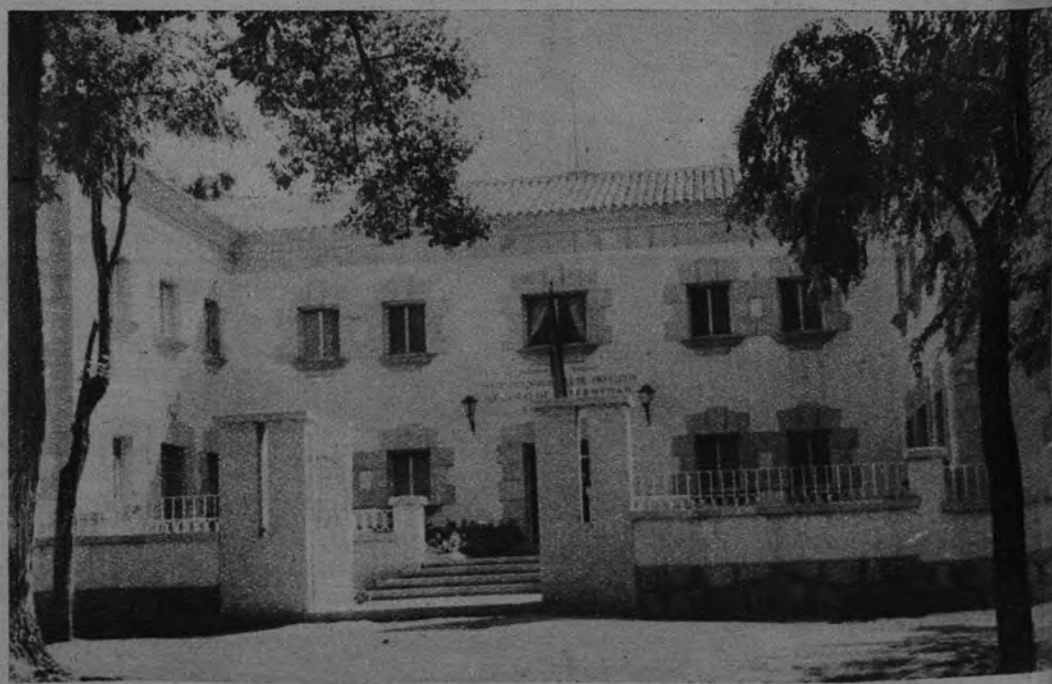
NUEVO AMBULATORIO. —En Trujillo ha sido puesto en servicio un Ambulatorio del Seguro de Enfermedad. A la inauguración asistieron representantes de veinticuatro Montepíos Laborales.