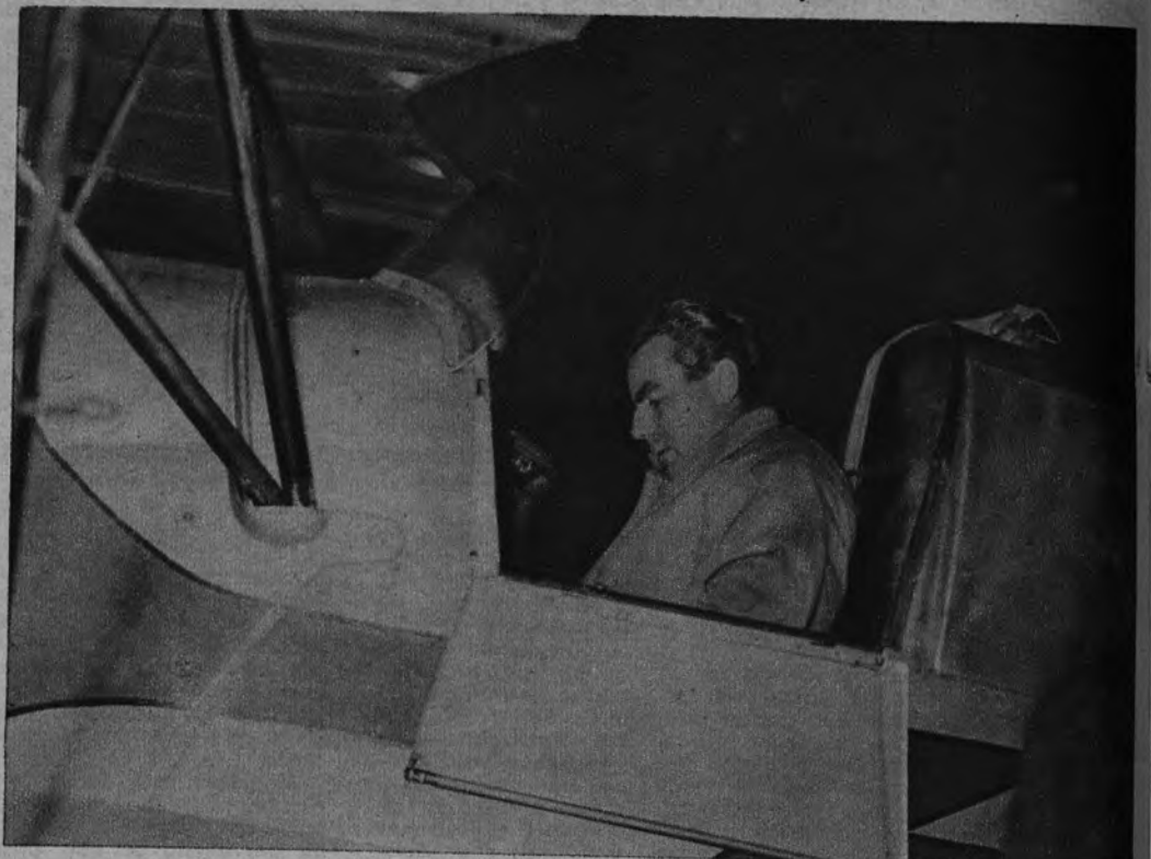
AS DE LA AVIACION. —El príncipe Cantacuzino acaba de llegar a Madrid. El as rumano de la aviación, que ha derribado sesenta y un aviones rusos, triunfó sobre pilotos de todo el mundo pilotando un aparato español durante un reciente certamen internacional.