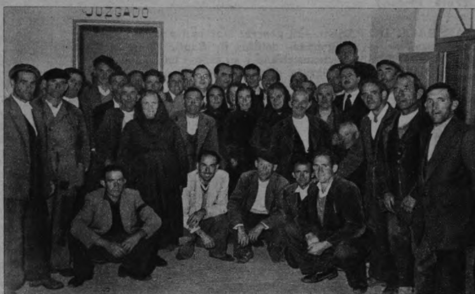
Un grupo de labradores de Torreiglesias (Segovia) que se han convertido en propietarios de las tierras que desde tiempo inmemorial venían cultivando sus antepasados.

piraban desde antaño a convertirse en propietarios de las parcelas entregadas a su cuidado.