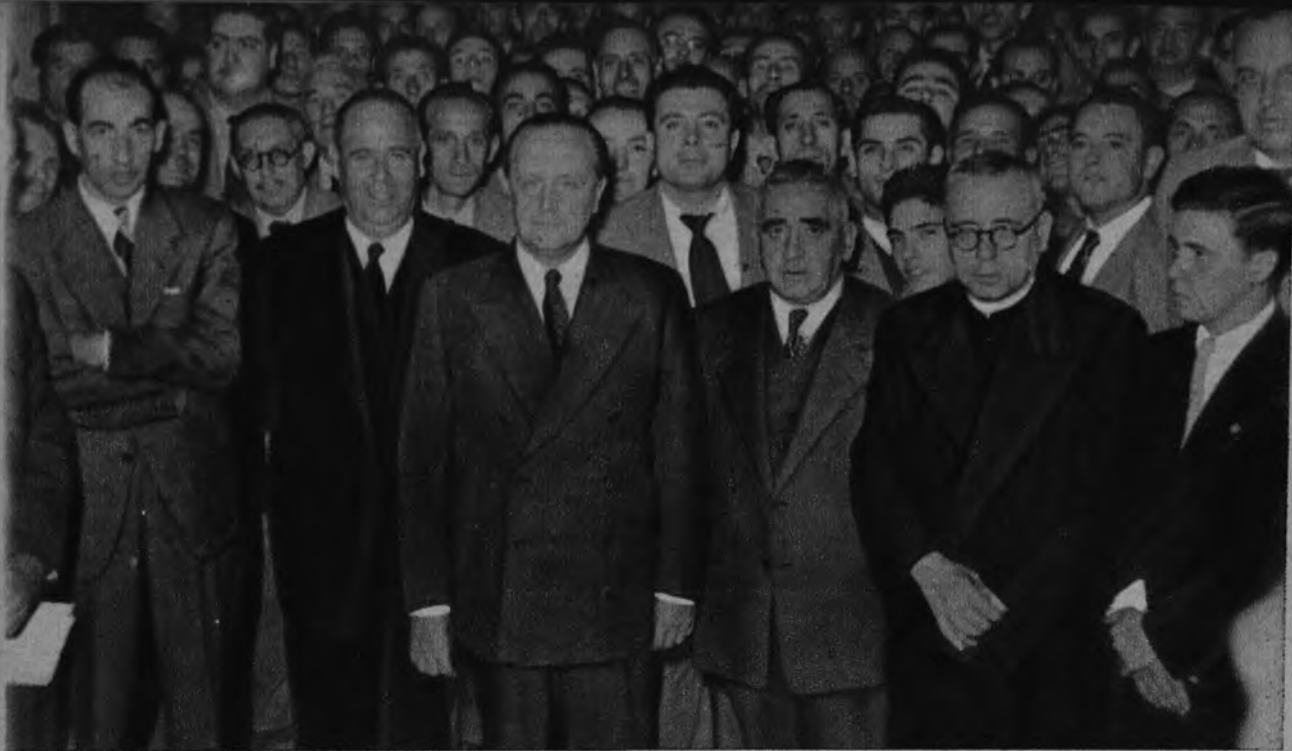
PRODUCTORES EN SECRETARIA GENERAL. —El Ministro Secretario General del Movimiento, camarada Raimundo Fernández-Cuesta, ha recibido en su despacho a los productores de la empresa modelo «San Jorge», de Játiva, que actualmente realizan un viaje de vacaciones.