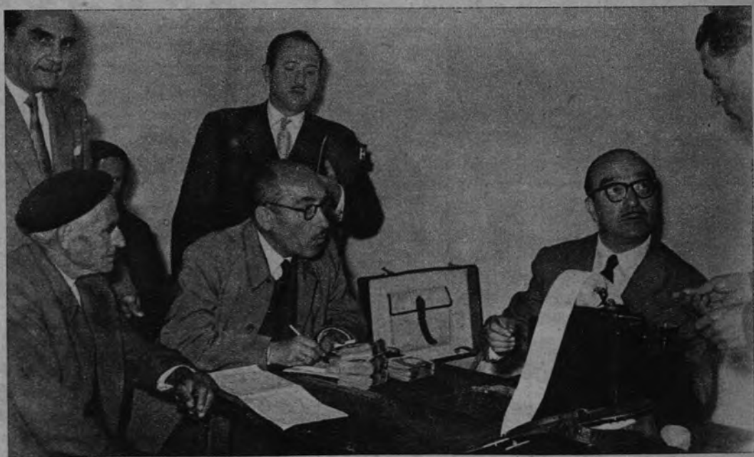
Momento de la entrega de cuatrocientas mil pesetas prestadas a los labradores de Torreiglesias (Segovia) por la entidad de Crédito y Ahorro «Cibeles», Caja Previsora de Crédito, de Barcelona.