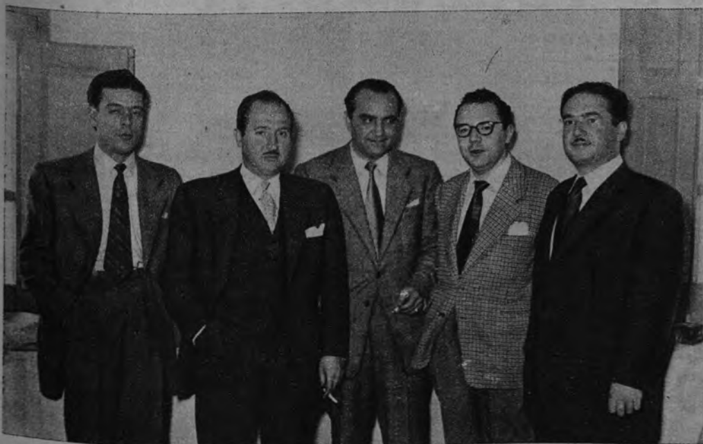
Los representantes de la entidad privada de Crédito y Ahorro que ha contribuido a la solución del problema de Torreiglesias, momentos antes de la formalización del préstamo concedido a los labradores de dicho pueblo.