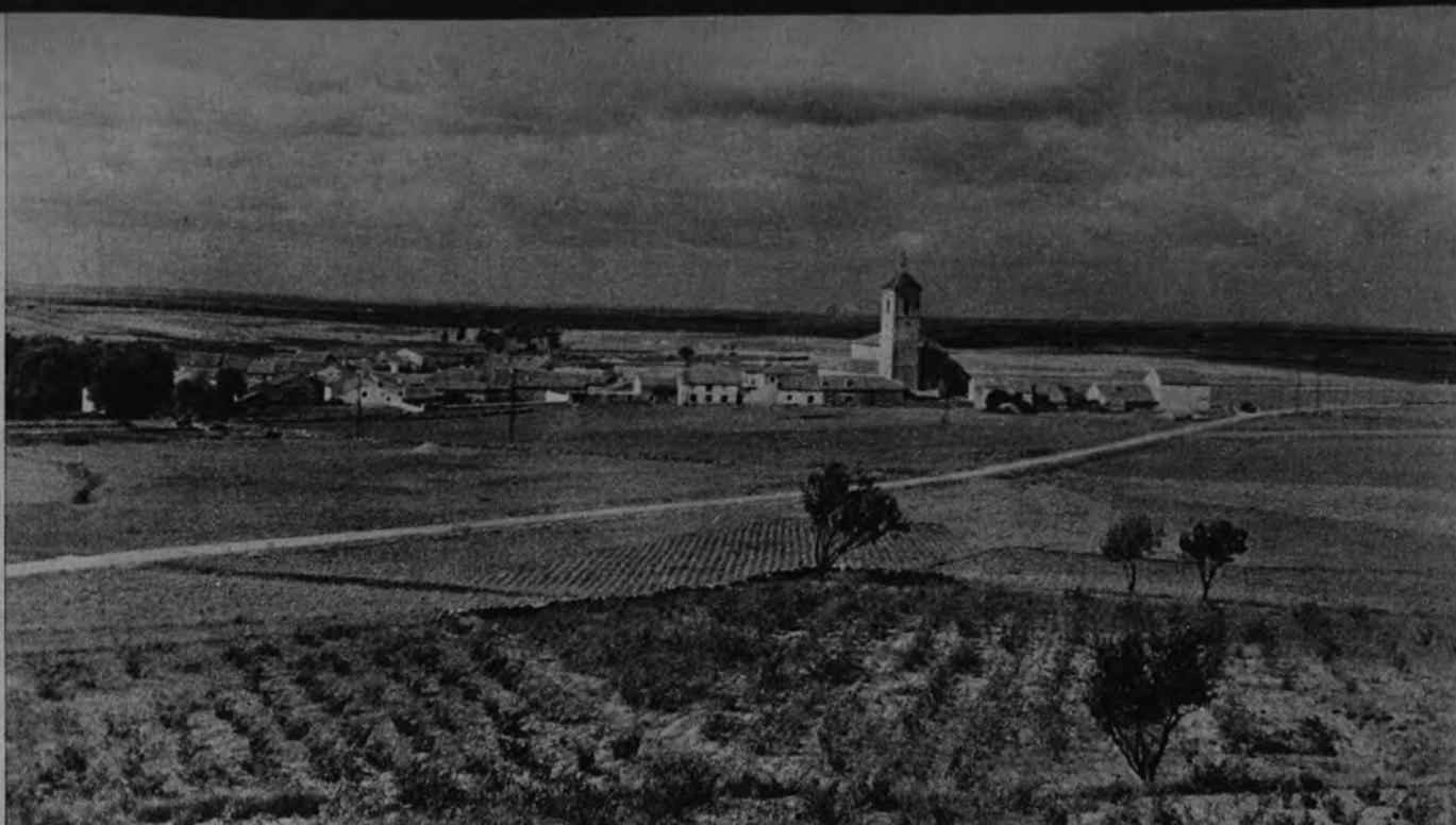
Vista general de Torreiglesias (Segovia), pueblo del que tratamos en este reportaje.

Estos colonos, que han entregado a la tierra en que nacieron lo mejor de su vida y de sus ilusiones, as-