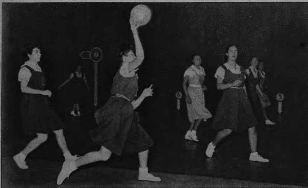
FESTIVAL DEPORTIVO. —A beneficio de las colonias escolares, se ha celebrado un brillante festival artístico-deportivo, que alcanzó un rotundo éxito. Durante el mismo, dos equipos de baloncesto de la Sección Femenina disputaron un reñido encuentro.