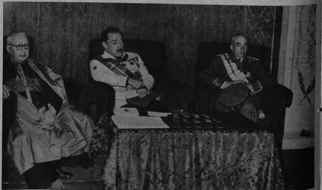
CONSEJO DEL FRENTE DE JUVENTUDES. —En Navarra se ha clausurado el VIII Consejo Provincial del Frente de Juventudes. El acto estuvo presidido por los Gobernadores Civil y Militar y por el obispo de la diócesis.