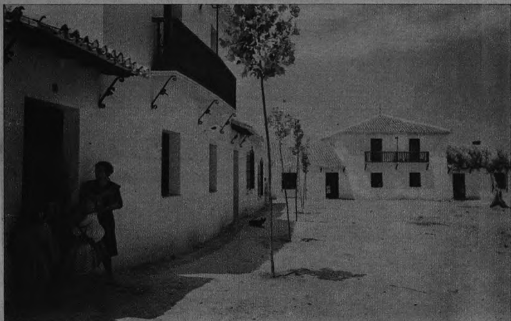
INSTITUTO NACIONAL DE COLONIZACION. —En la finca «Lachar», de Granada, visitada por el Caudillo, se alza la hermosa blancura de este pueblo nuevo, que la obra del Régimen ha construido para residencia de los campesinos que explotan dicha finca.