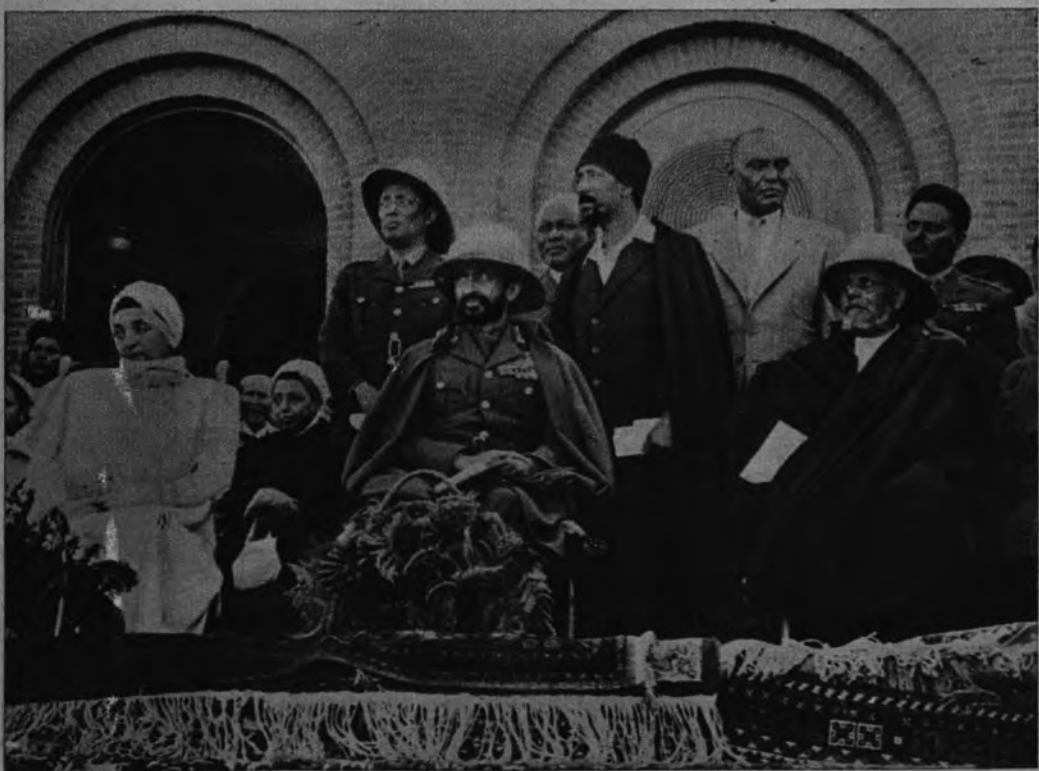
FEDERACION. —Haile Selassie y su esposa la Emperatriz de Abisinia reciben el homenaje de los sacerdotes coptos de Asmara, capital de Eritrea, que acaba de federarse con Abisinia. La real pareja se desplazó a Asmara con el fin de dar lustre a los festejos.