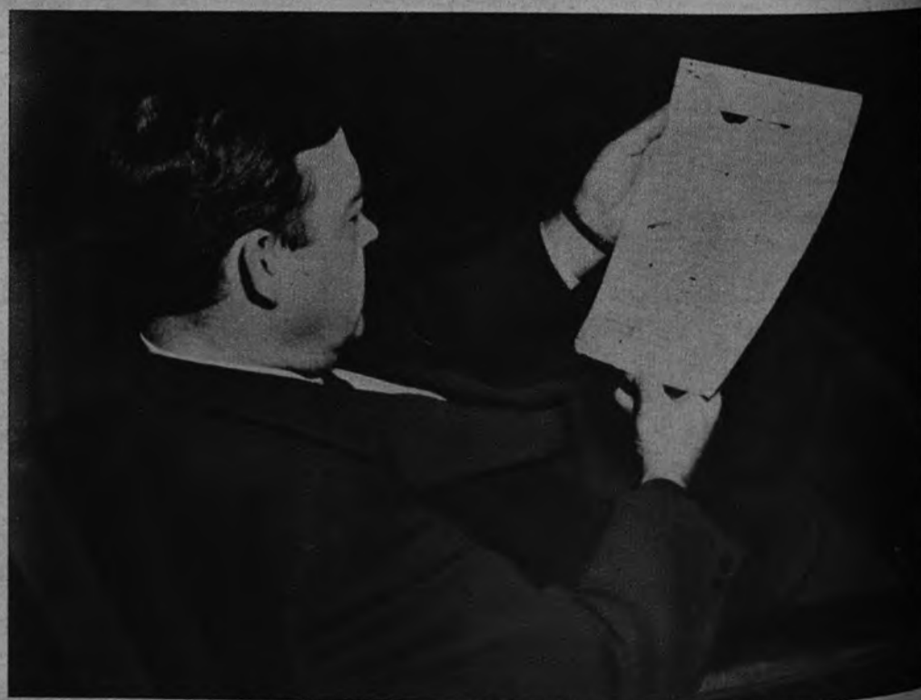
CARTA DEVUELTA. —Mr. Luther Evans, director de la Biblioteca del Congreso de los Estados Unidos, examina el original de la famosa carta de Colón, que ahora ha sido devuelta a España con motivo de la Fiesta de la Hispanidad.