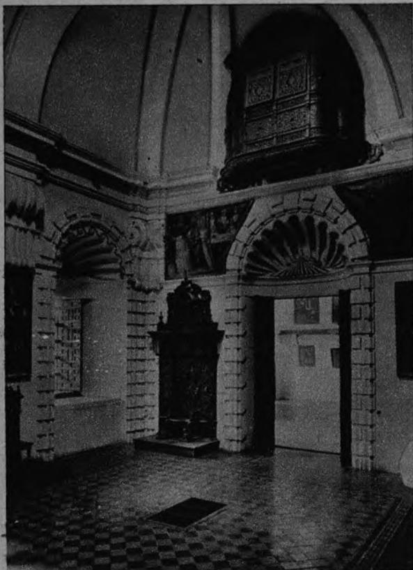
LA UNIVERSIDAD DE SAN MARCOS. —La vieja Universidad de San Marcos, en Lima, donde Javier Conde pronunció una de sus más resonantes conferencias durante su permanencia en la capital peruana.

LOS resultados del viaje que Javier Conde, el director del Instituto de Estudios Políticos, ha realizado por cuatro países americanos en los últimos meses, están perfectamente definidos y condensados en las líneas que el «Diario Ilustrado», de Chile, le dedicaba en su número del día 1 de septiembre último.