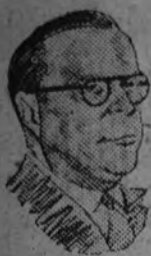
LESTER PEARSON Ministro de Negocios Extranjeros del Canadá, que ha sido elegido presidente de la séptima reunión de la Asamblea General de la O. N. U., inaugurada ayer.