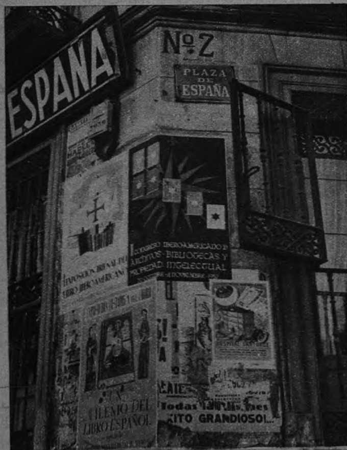
LA LETRA HISPANICA. —Madrid ha reunido nombres famosos, eruditos e investigadores de la lengua castellana en ocasión del I Congreso Iberoamericano de Archivos, Bibliotecas y Propiedad Intelectual. En torno al Congreso hay toda una extensa y activa muestra de la letra hispánica.