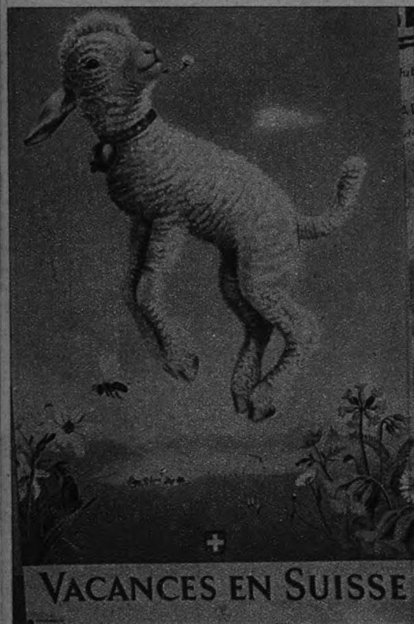
TURISMO. —Desde las paredes urbanas, este delicioso cartel rompe gozosamente la tradicional llamada de Suiza. El país que mejor ha sabido comerciar con sus relojes y con su nieve, pone con este sencillo cartel cátedra de la mejor técnica propagandística.