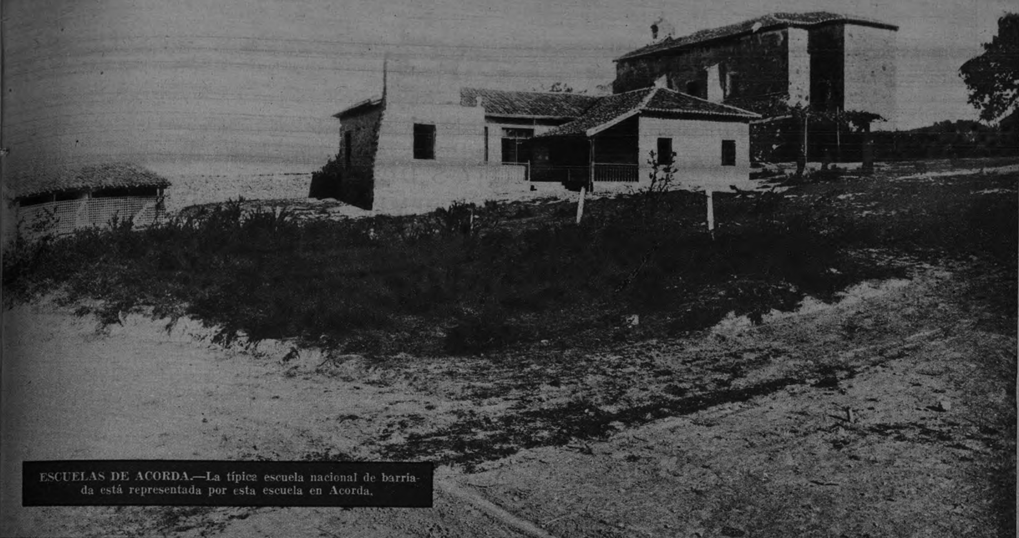
ESCUELAS DE ACORDA.—La típica escuela nacional de barriada está representada por esta escuela en Acorda.