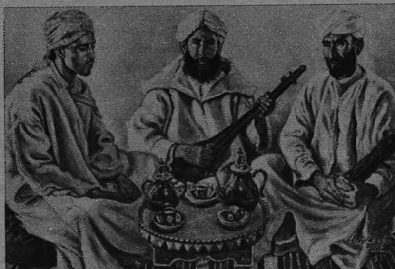
EXPOSICION LAMBARRI. —Lambarri ha abierto una completísima Exposición sobre temas africanos en el Círculo de Bellas Artes. Treinta y un cuadros figuran en esta acabada muestra de la obra de Lambarri.