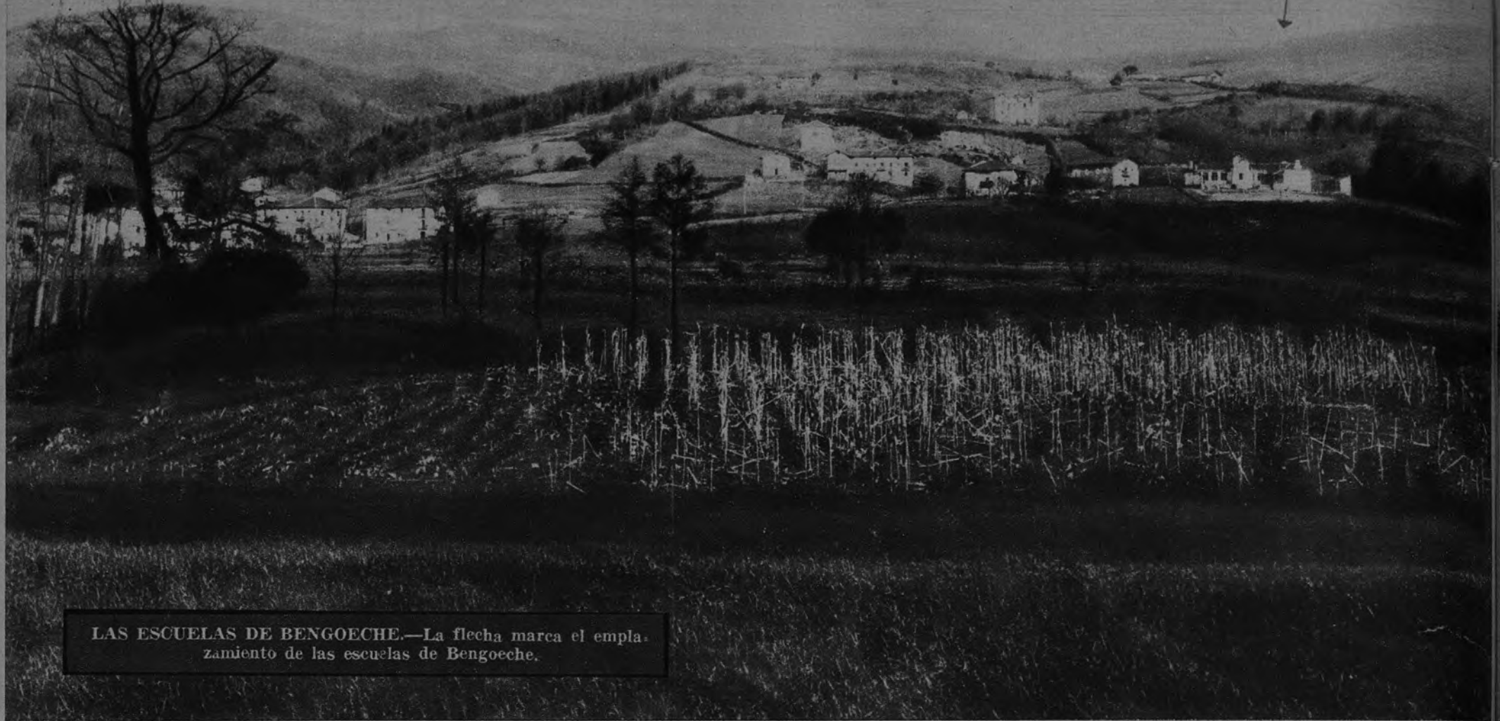
LAS ESCUELAS DE BENGOCHE.—La flecha marca el emplazamiento de las escuelas de Bengoeche.