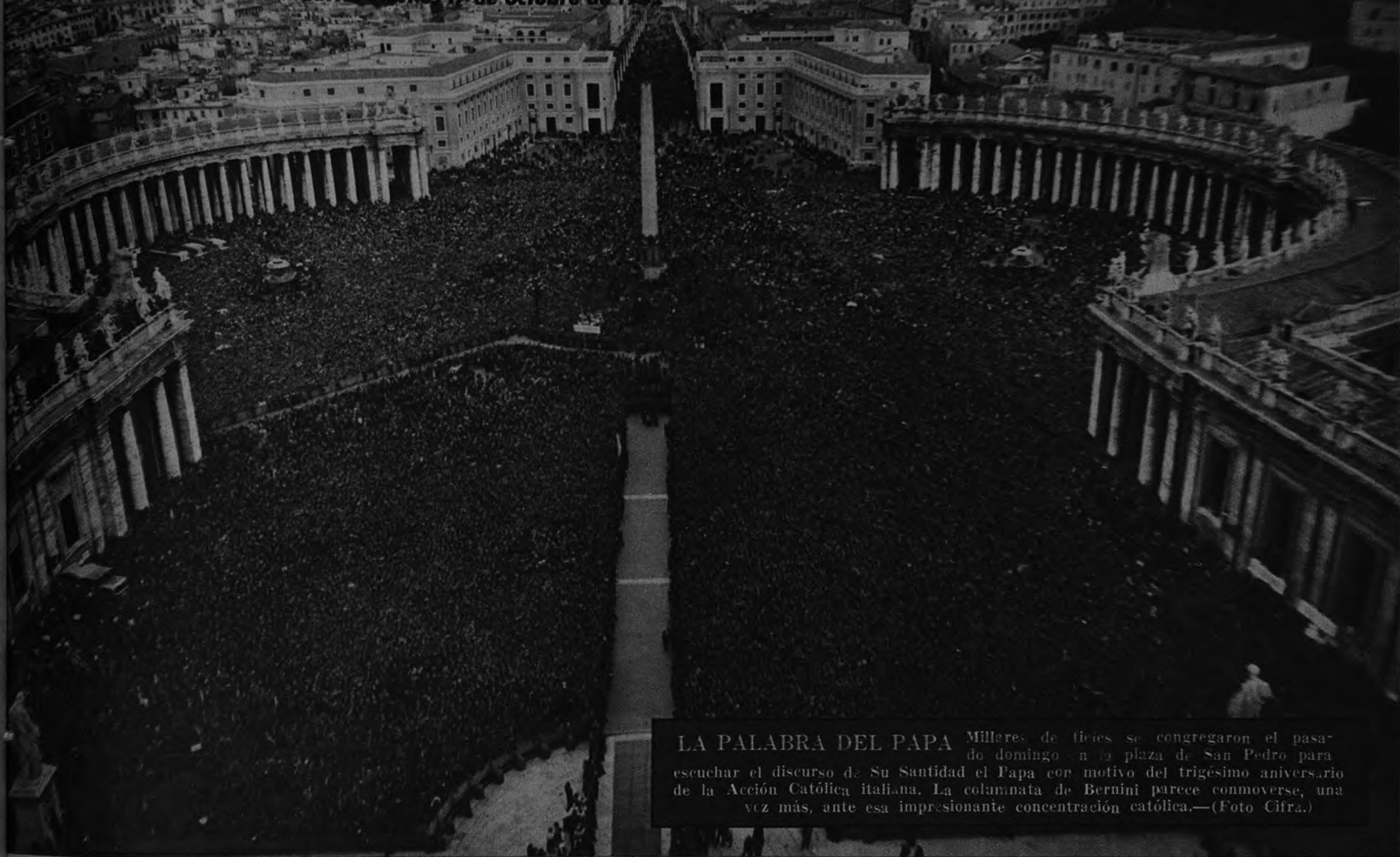
LA PALABRA DEL PAPA Millares de fieles se congregaron el pasado domingo en la plaza de San Pedro para escuchar el discurso de Su Santidad el Papa con motivo del trigésimo aniversario de la Acción Católica italiana. La columnata de Bernini parece conmoverse, una vez más, ante esa impresionante concentración católica.