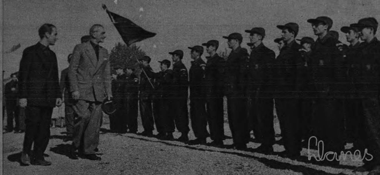
CAPATACES MECANICOS. —El Frente de Juventudes, en primera línea siempre, entrega al quehacer de España esta promoción de capataces agrícolas, nueva especialidad oficialmente reconocida por el Ministerio de Agricultura. En la Granja-Escuela de Quinto de Ebro, Elola pasa revista a la primera promoción.