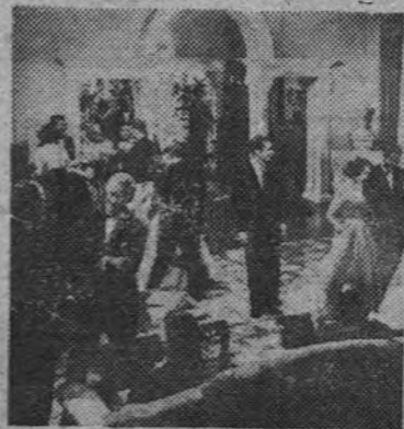
Fotograma de "Un lugar en el sol", superproducción que será presentada por Mercurio Films y que tiene como protagonistas a Montgomery Clift, Elizabeth Taylor y Shelley Winter, bajo la dirección de George Stevens

Genial realización de JOSE LUIS SAENZ de HEREDIA