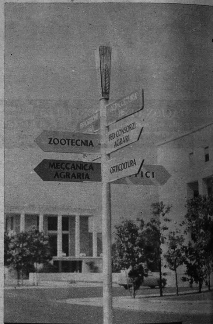
Poste indicador de las diferentes secciones de que constará la Exposición Internacional de Agricultura de Roma.

«En el orden textil se prepara asimismo algo muy completo: desde mostrar el campo cultivado de algodón hasta el desfile de modelos, con la participación de casas de modas italianas y extranjeras. También tendrá gran importancia el capítulo vitivinícola, pues precisamente durante el año próximo se celebrará en Italia el VII Congreso Internacional de dicha modalidad agrícola. Directivos de la Oficina Internacional del Vino acaban de reunirse en Roma para estudiar la participación de dicho organismo. Ni que decir tiene