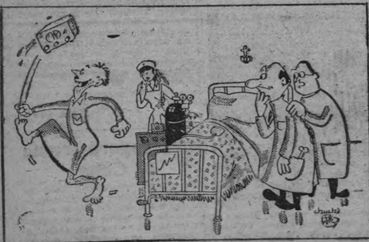
MORIBUNDETE, por «Chuchi» —¿Lo ves? Ya te decía yo que no debíamos darle oxígeno.

Mañana a mediodía el equipo marthará a su habitual residencia de concentración, el pueblo de Salinas, donde estará hasta momentos antes del encuentro. (Mencheta.)