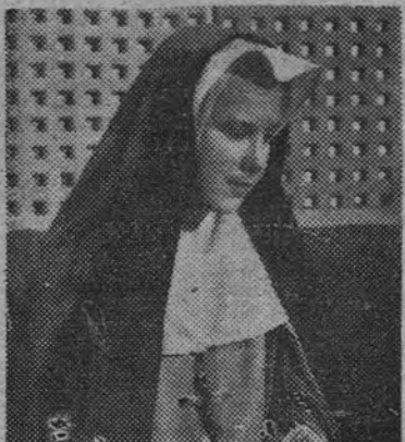
"Sor Intrepida", que ha dirigido Rafael Gil y que muy pronto será presentada por Mercurio Films, ofrece una admirable actuación de la estrella francesa Dominique Blanchar