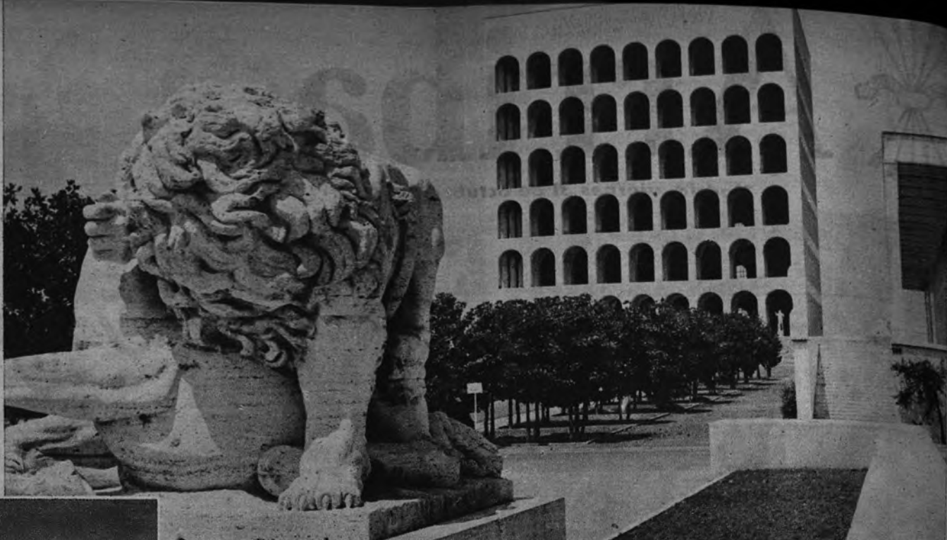
Monumento en Travertino y Palacio de la Civilización al fondo, donde quedará instalada una de las secciones de la Exposición Internacional de Agricultura de Roma de 1953. En la parte superior de la fachada sigue esculpida una frase de Mussolini que exalta al pueblo italiano.

«La participación española en la Exposición—dice nuestro interlocutor—comprenderá dos sectores: el particular y el oficial. El primero lo deben constituir aquellos productos que representan la base de nuestras exportaciones agrícolas. Un ensayo de lo que deben exponer los particulares puede hacerse a través de la Feria del Campo, que se celebrará en Madrid antes que la Exposición de Roma. En este sentido—añade—, he entrado ya en contacto con los organizadores de