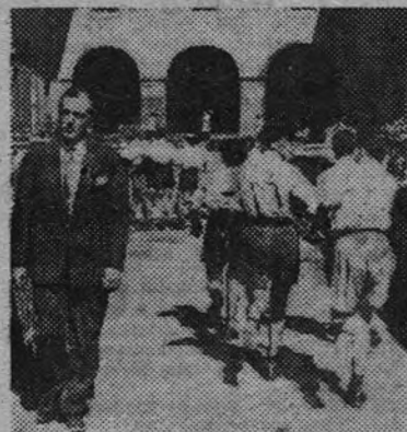
Vittorio de Sica, intérprete de "Mañana será tarde", en una escena de esta superproducción italiana, que será presentada por la distribuidora Chamartín

Una historia de amor tan electrificante, que ni aun los seres más apasionados desearían vivirla!