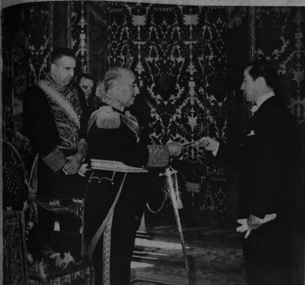
PRESENTACION DE CREDENCIALES El nuevo embajador del Ecuador en España, don Ruperto Arcón, presenta sus cartas credenciales a S. E. el Jefe del Estado durante la ceremonia celebrada ayer en el Palacio de Oriente con asistencia del Ministro de Asuntos Exteriores.