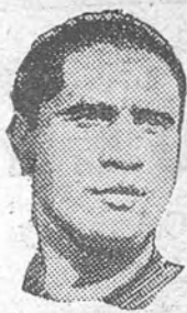
GAINZA Capitán del equipo nacional, a quien la Federación Española de Fútbol ha concedido el Premio de Oro al Mérito Futbolístico con motivo de haber jugado frente a la Argentina su 25 partido internacional.