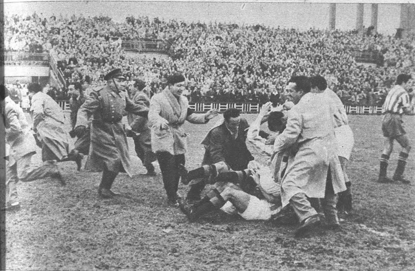
EL JUBILO DE UN EMPATE. —Empatar en casa es perder un punto positivo. Pero cuando la igualdad se obtiene tras ir perdiendo claramente, da lugar a escenas de júbilo como esta del campo de Zorrilla.