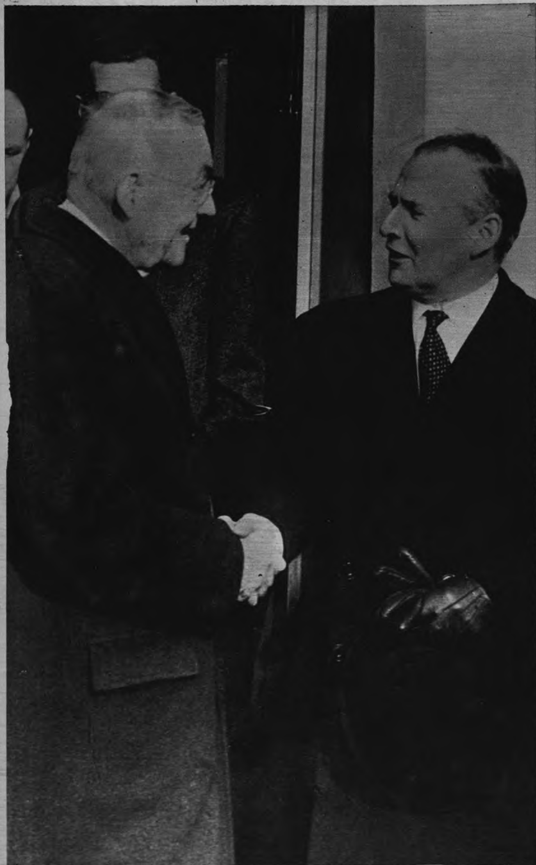
FOSTER DULLES LLEGA A LONDRES. —El secretario británico de Asuntos Exteriores, Selwyn Lloyd, da la bienvenida a su colega norteamericano, Foster Dulles, a su llegada al aeropuerto de Londres para entrevistarse con Macmillan.