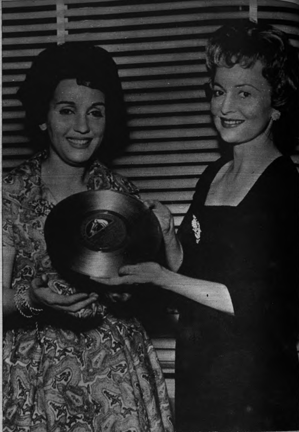
PRIMER MILLON. —Gloria Lasso y Olivia de Havilland protagonizan la ceremonia en que nuestra cantante recibe un disco de oro, recuerdo del primer millón de microsuros editados en Francia con el argumento de su voz.