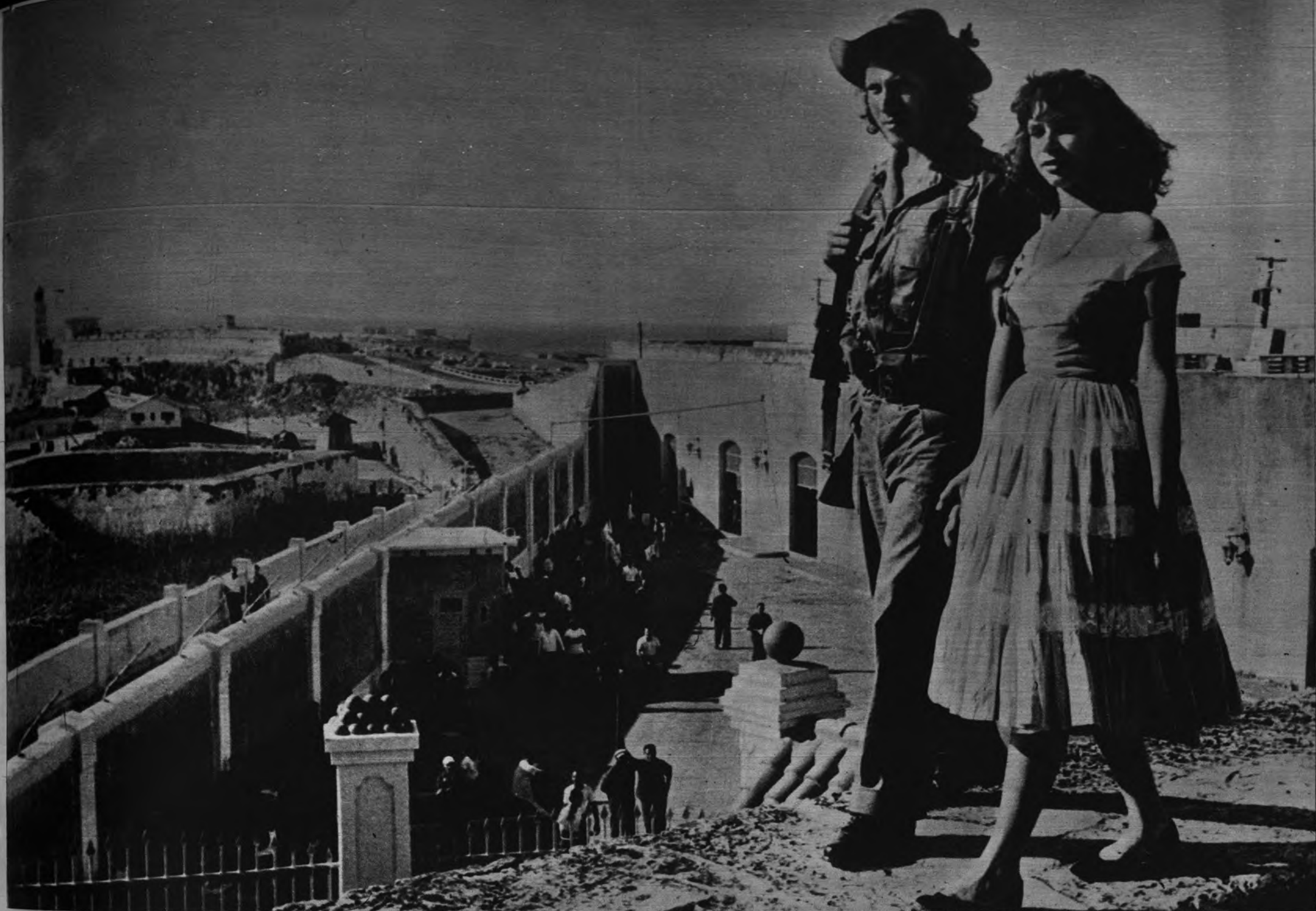
CENTINELA ALERTA. —Un soldado del Ejército de Fidel Castro monta centinela sobre el muro exterior de la fortaleza de La Cabaña, a la entrada de la capital de Cuba, convertida en prisión de seguidores de Batista. Le acompaña, cogida de su mano, la que debe de ser su novia. Los reclusos, en el patio, contemplan el ir y venir de la pareja, mientras les llega la hora de comparecer ante los tribunales que habrán de juzgar su responsabilidad.