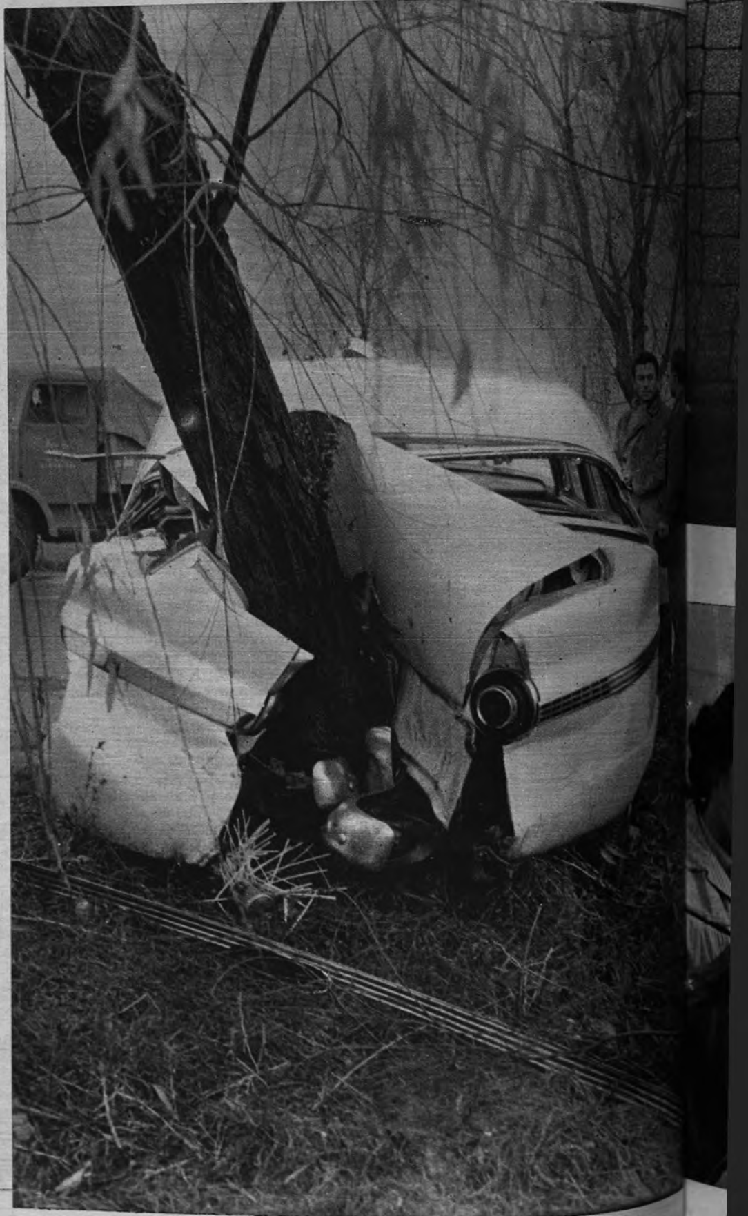
LA LLUVIA, CULPABLE. —El accidente, esta vez, ha ocurrido a consecuencia de la lluvia. Un automóvil de marca extranjera sufrió un patinazo en la autopista de Castelldefels, Barcelona, estrellándose con un árbol. No hubo víctimas.—(Cifra.)