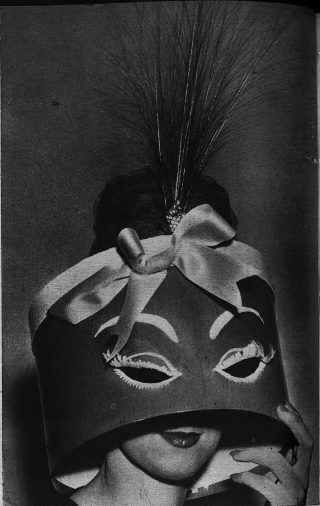
EL SOMBRERO Y LA CAJA. —A veces algunas prendas apetece menos que el envoltorio en que nos llegan. Esta es ocasión de competencia. La modelo luce el sombrero y también la caja que le sirve de recipiente, en una exhibición de moda