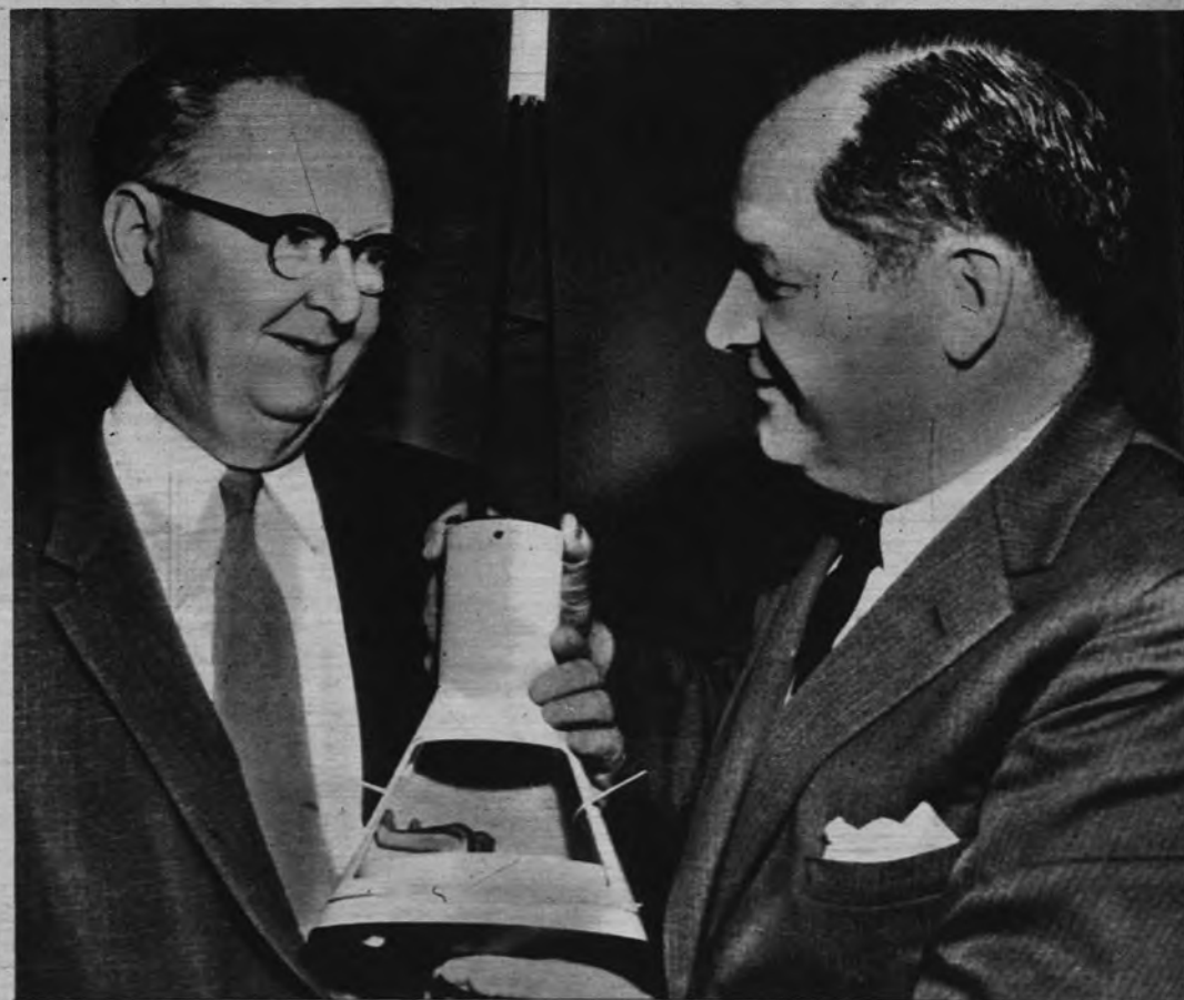
CAMAROTE AL ESPACIO. —Este modelo de cápsula pudiera ser el alojamiento del hombre del espacio en el proyectil vehículo de su aventura. Lo examinan dos altos funcionarios de la Administración del Espacio, de los Estados Unidos.