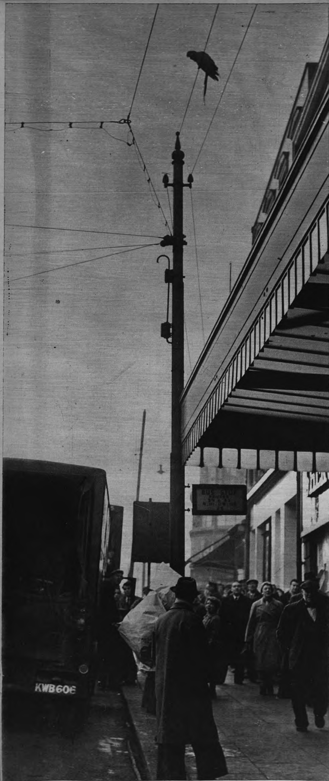
FUNAMBULO. —El guacamayo azul y rojo fugado de una pajarería de Sheffield mientras hacían la limpieza del establecimiento, se dedicó a equilibrios y bromas en los cables eléctricos antes de ser aprehendido y devuelto a su percha. (Cifra.)