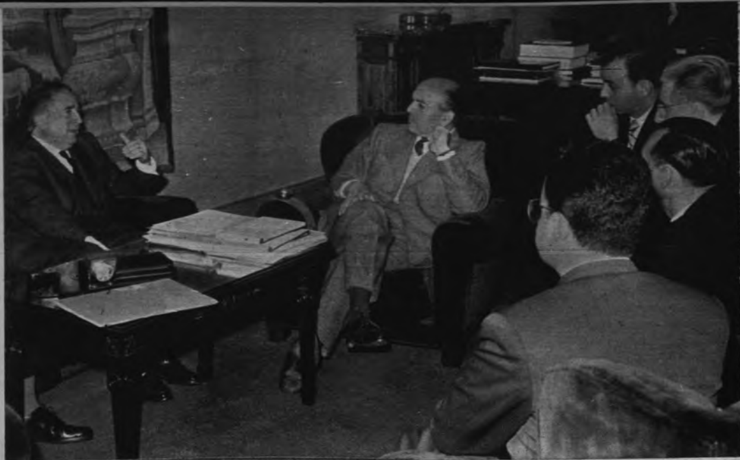
SOLIS RECIBE A LOS TITULARES MERCANTILES. —El Ministro Secretario General del Movimiento con los miembros del Consejo Superior de Colegios Oficiales de Titulares Mercantiles de España, a los que recibió en su despacho oficial