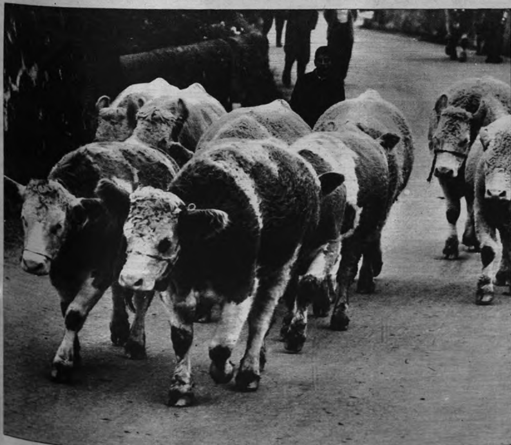
SIN CUERNOS. —Novedad en la ganadería suiza: ganado bovino sin cuernos. La ha introducido en el país un granjero de Lonay, que opera a sus animales cuando son muy jóvenes, para evitar que luego, al ser adultos, se hieran unos a otros