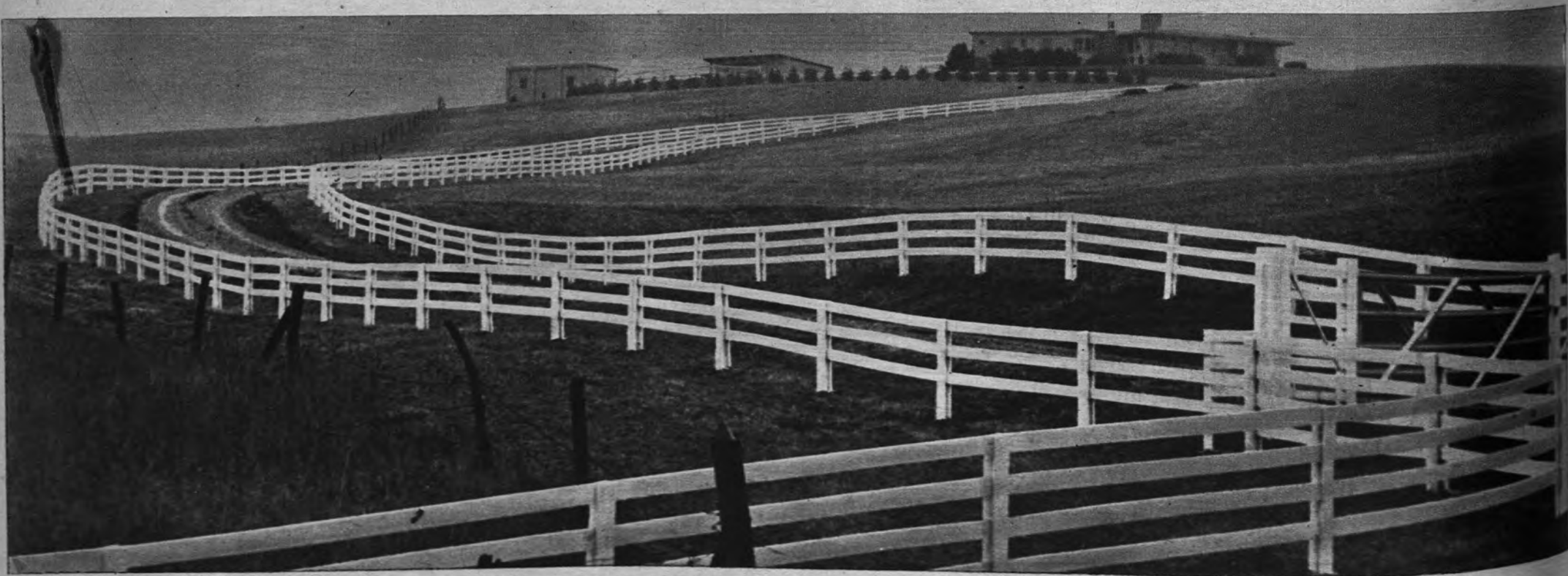
UNA PISTA QUE MAS PARECE UN LABERINTO. —No se invita aquí, como en los antiguos dibujos rompecabezas, a buscar el gorro del cazador o el gato escondido en alguna parte. Este tetragrama blanco que señala fronteras dibuja una caprichosa trayectoria sobre el terreno y parece refrendar el concepto de la relatividad, pues todo resultado depende de la perspectiva del espectador. Todo el conjunto parece de este modo, sí, un laberinto.