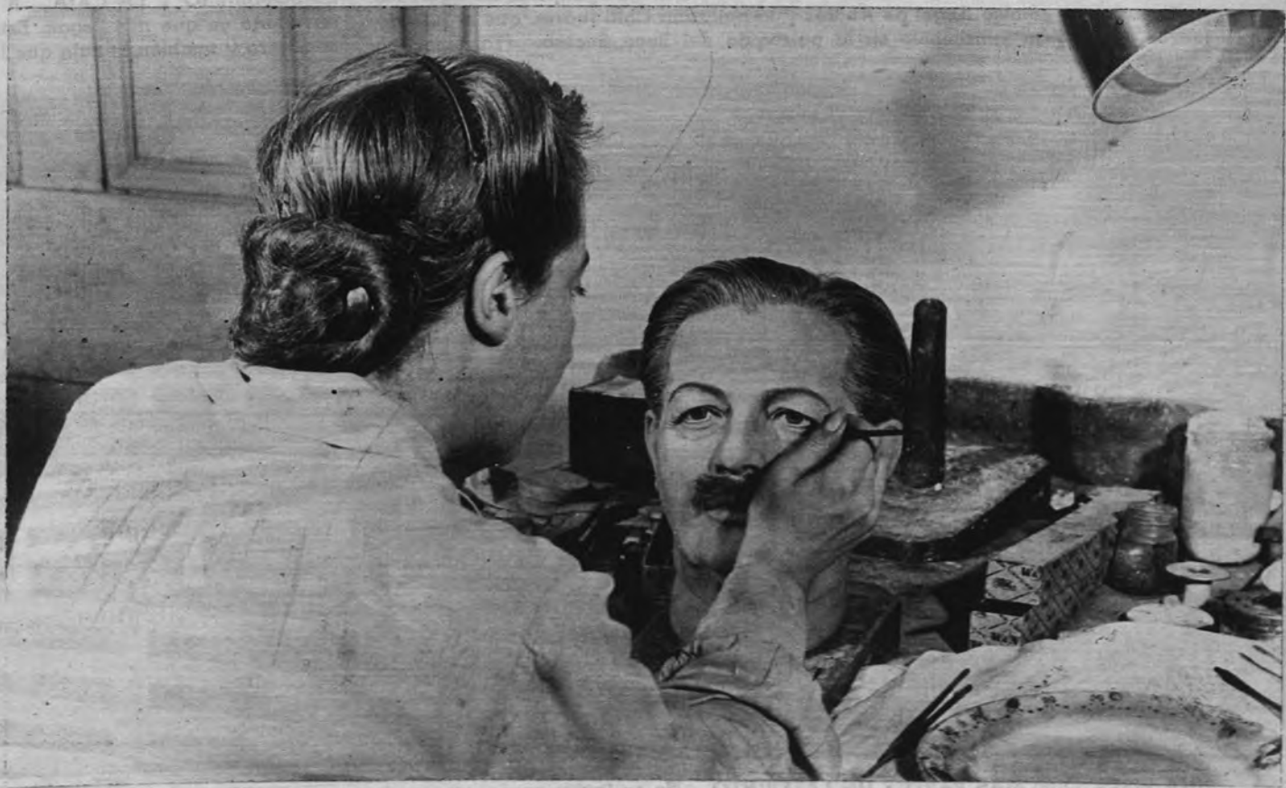
KRUSTCHEV y MACMILLAN, AL MUSEO DE CERA. —El museo londinense de figuras de cera aumenta su colección con dos figuras de la máxima actualidad política de nuestro tiempo. En la ocupación delicada y escrupulosa de preparar los rostros moldeados de los nuevos museables vemos a la señorita Vera Brand en el estudio del famoso Museo Madame Tussaud. Las nuevas piezas, fácilmente reconocibles, son Krustchev, a la izquierda, y Macmillan, a la derecha.