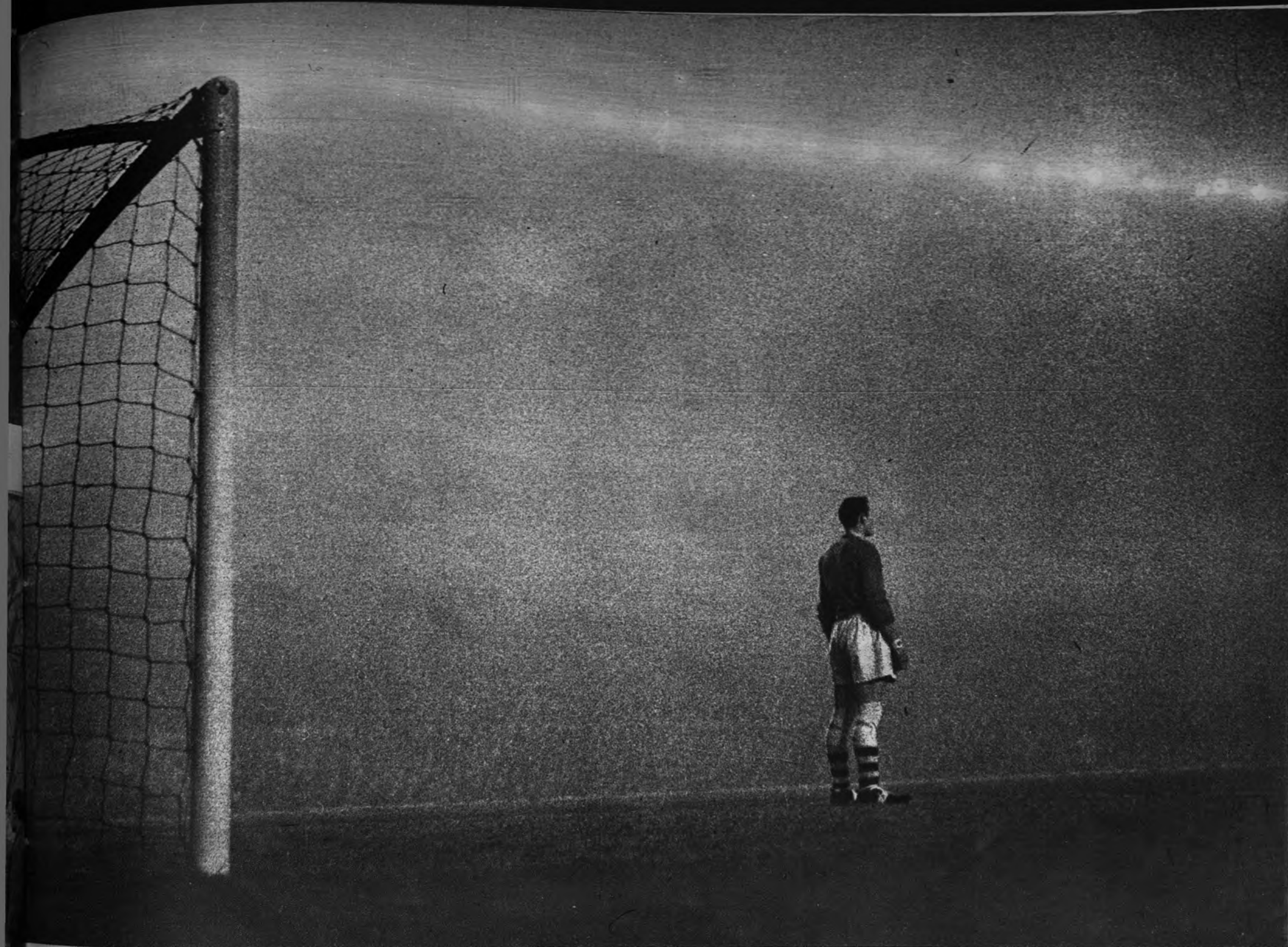
EL PORTERO. SOLO ANTE LA NIEBLA. —La niebla ha difuminado todos los perfiles del estadio, las siluetas de los espectadores, y es como si el cancerbero del Arsenal, Jack Kelsey, montara la guardia ante una soledad inmensa y gris. Sólo la red y los postes cobran vida en medio de ese panorama oscuro que presidió el encuentro para los cuartos de final de la Copa de Inglaterra entre los equipos del Arsenal y el Manchester, que ganó el primero.