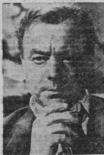
Heinz Rühmann, el famoso actor, en una distinta y extraordinaria interpretación dramática de «El cebo», la película de Ladislav Vajda producida por Chamartin-Praessens

¿Cuál cree usted que es el verdadero sexo débil?... Este film, chispeante y espectacular, le ofrecerá, entre sonrisas y lágrimas, la inesperada respuesta