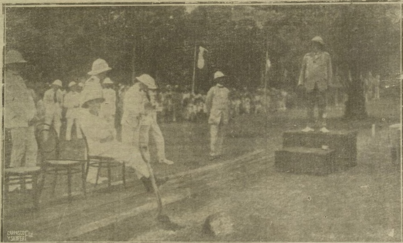
VIAJE DE CLEMENCEAU A SINGAPOUR. EL EX PRESIDENTE DEL CONSEJO DE MINISTROS DE FRANCIA PRONUNCIANDO UN DISCURSO EN STRAITS SETTLEMENTS, DESPUÉS DE INAUGURAR LAS OBRAS DE UNA AVENIDA QUE LLEVARA SU NOMBRE.

Y como su redactor médico pide al vecindario le facilite datos para proseguir su campaña iniciada, de alto interés nacional, por aquello del «salus populi», nosotros, que formamos parte de ese vecindario del que solicita datos el redactor médico del amado colega, como sujeto paciente del mismo, se los vamos a dar, en cantidad abundante, que aligere el ánimo y que produzca la desesperación de amarguras infinitas de los que, por torpeza, incuria e incapacidad de nuestros directores de esta nación, tan brutalmente descuidada, havamos te-