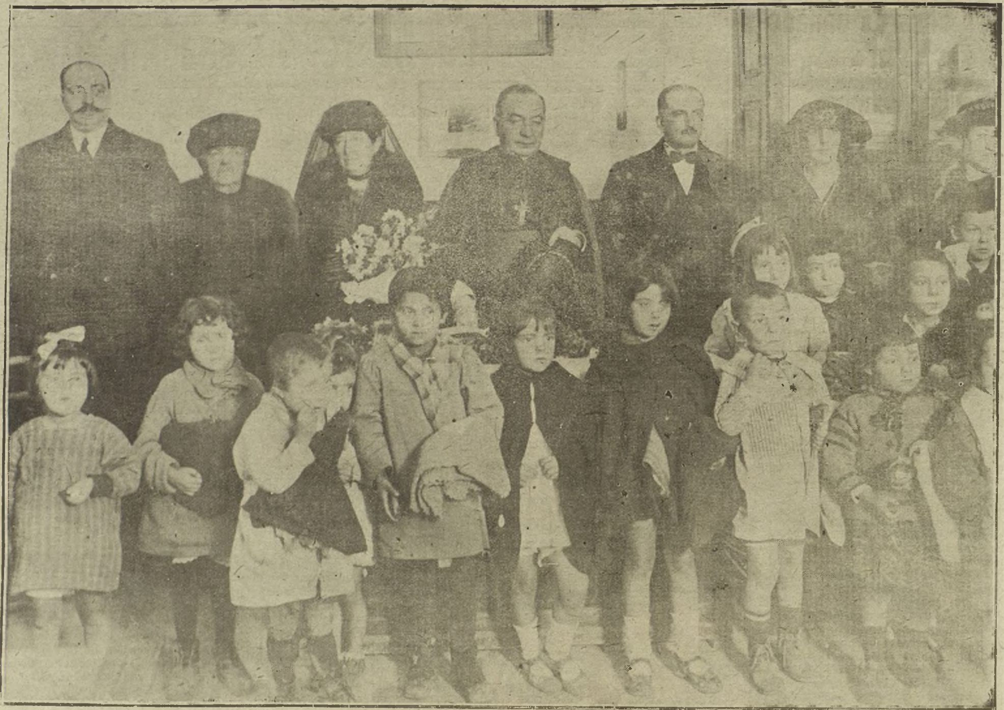
EL BISPO DE MADRID-ALCALA, PRESIDIENDO EL REPARTO DE ROPAS, VERIFICADO EN EL COLEGIO REINA VICTORIA.

nido, tengamos que sufrir, estemos pasando las horribles y destructoras consecuencias de esos torpes abandonos.