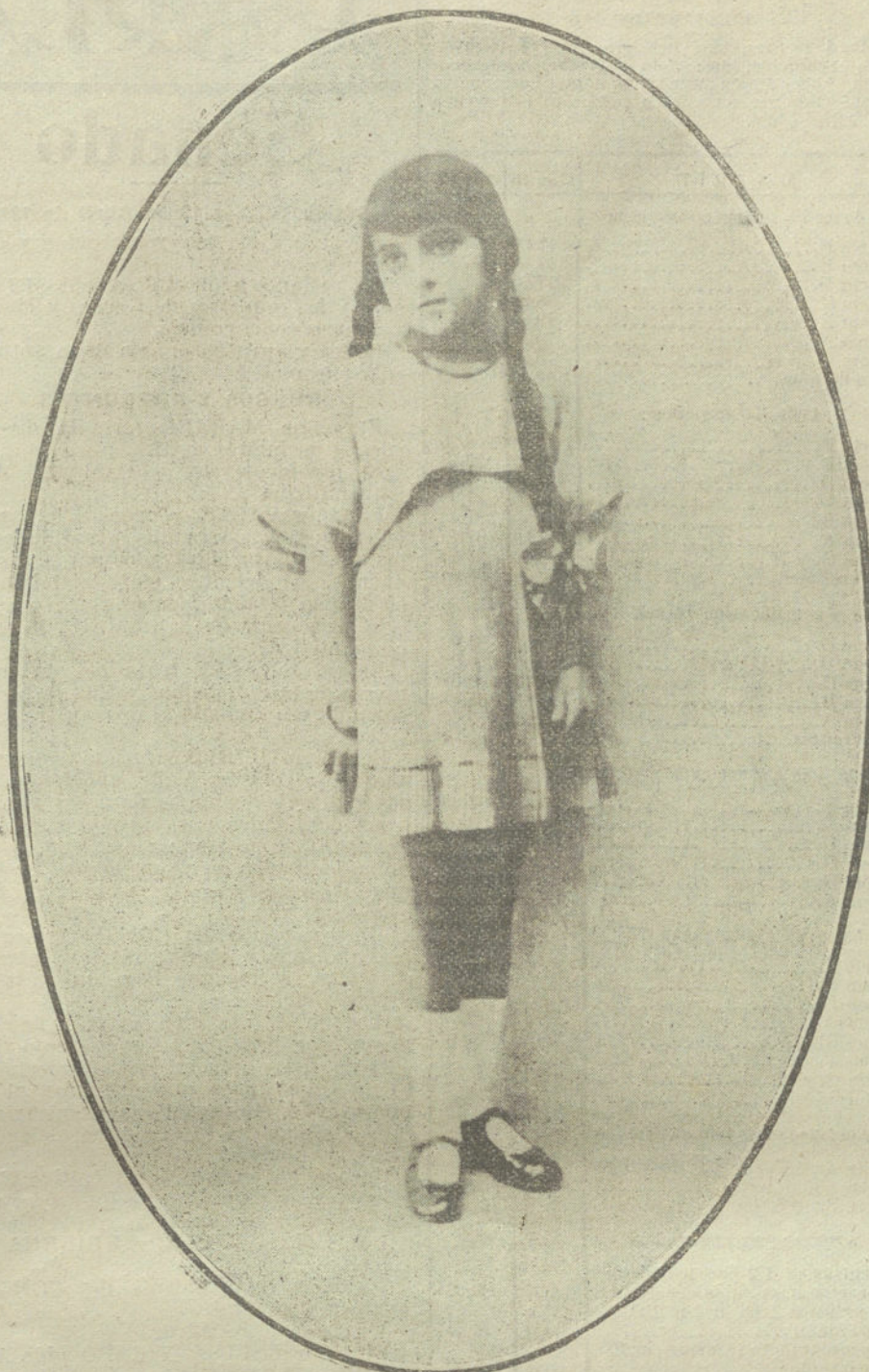
Traje de niña, sencillísimo y elegante, modelo de la casa Ernestino.