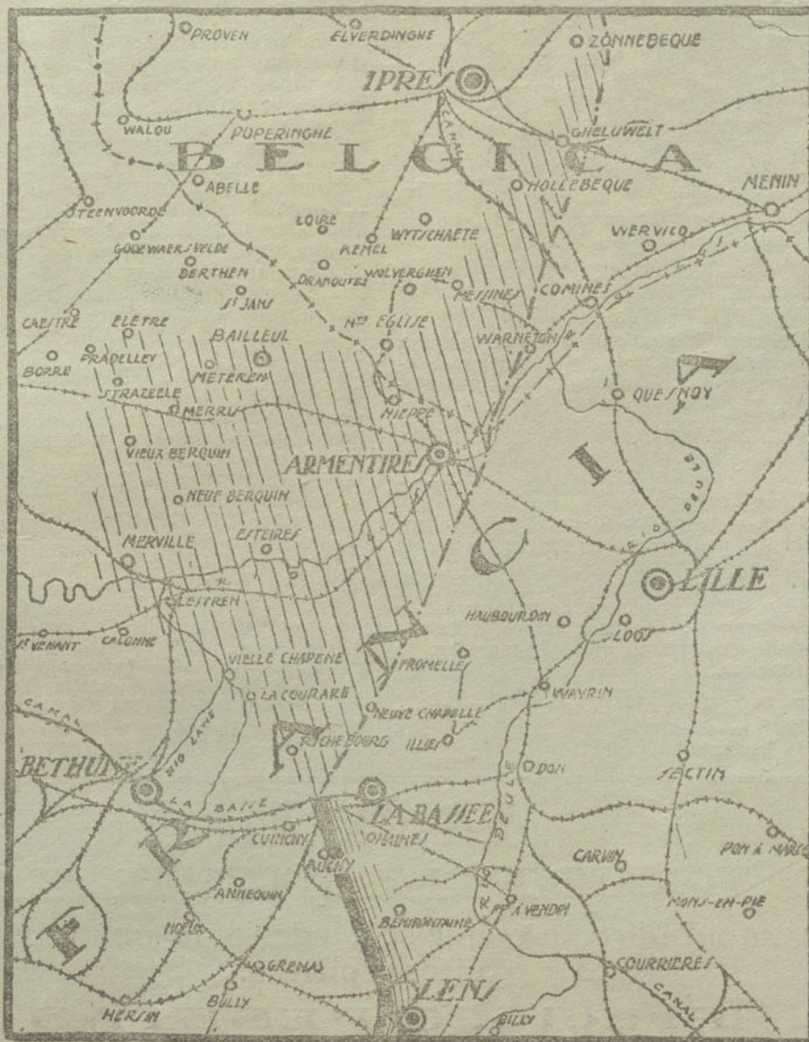
Zona del Norte de Francia, donde tienen lugar los encarnizados combates de la ofensiva alemana.

La oposición está casi limitada a los representantes del Ulster y a un pequeño grupo de unionistas, capitaneados por lord Salisbury; pero este personaje no se opondrá al proyecto si ha de provocar su actitud una grave crisis ministerial.