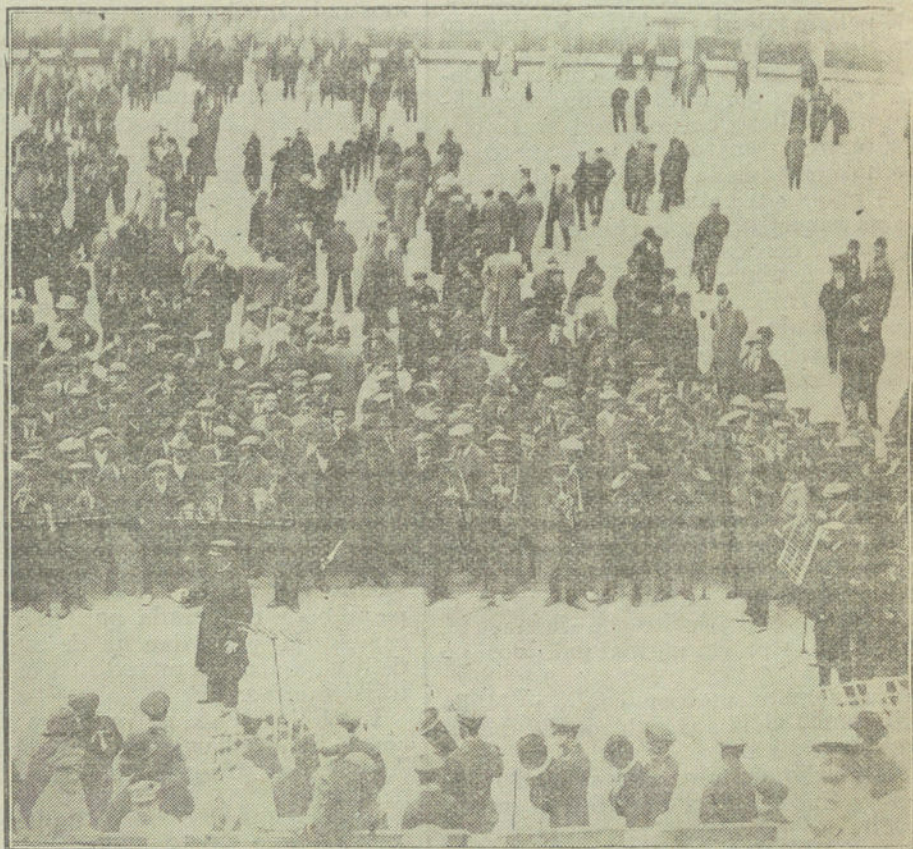
La banda de música en el redondel de la plaza momentos antes del despaño.

Hoy, 21 de Abril, celebra su fiesta onírmistica la bella Primavera, que viene con un mes de retraso... ¡Cosas de Ventosa! Hace su presentación con la Sierra cubierta de nieve, y anteayer hemos contemplado el fenómeno de que hiciera calor, lloviera y cayeran copos de nieve en el mismo día.