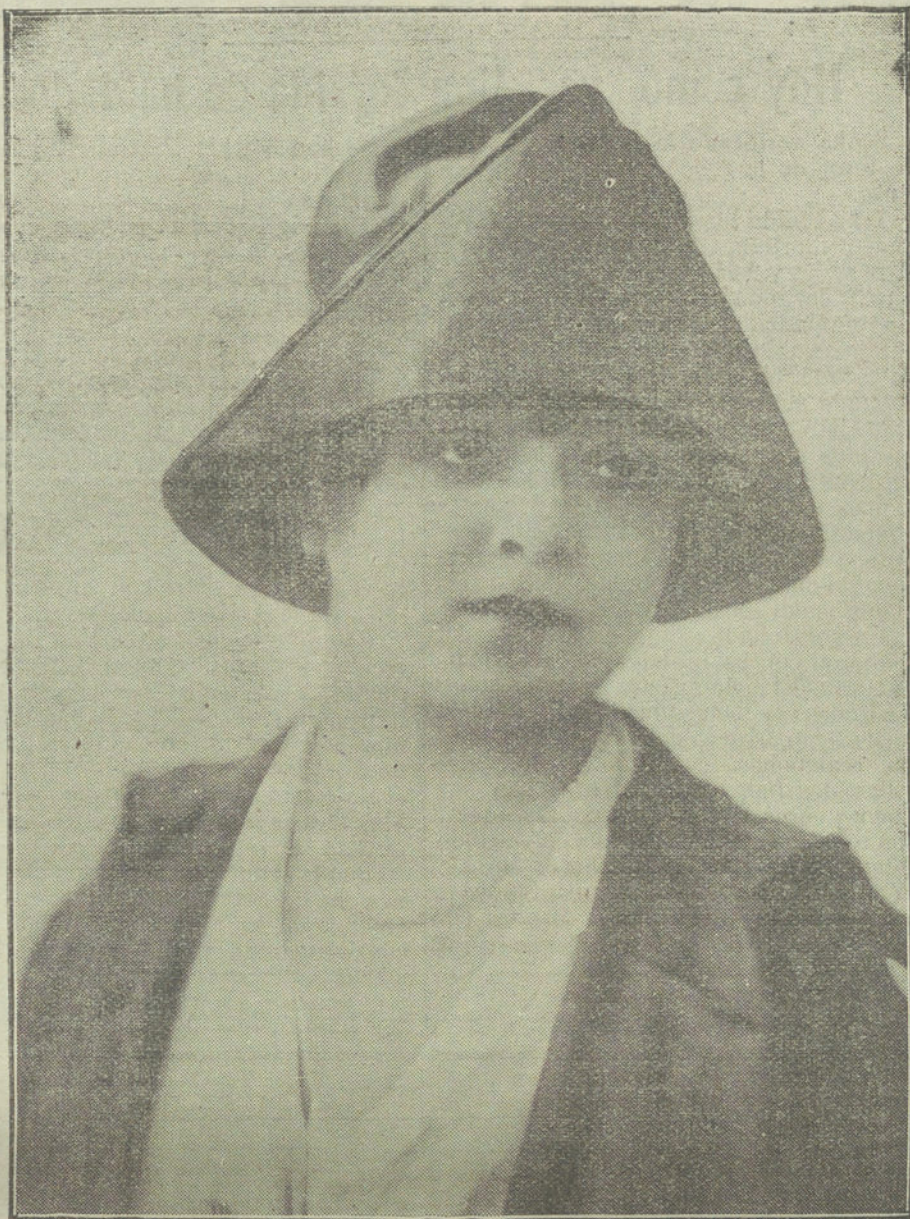
Elegante sombrero de primavera, modelo de la casa Dolcay.