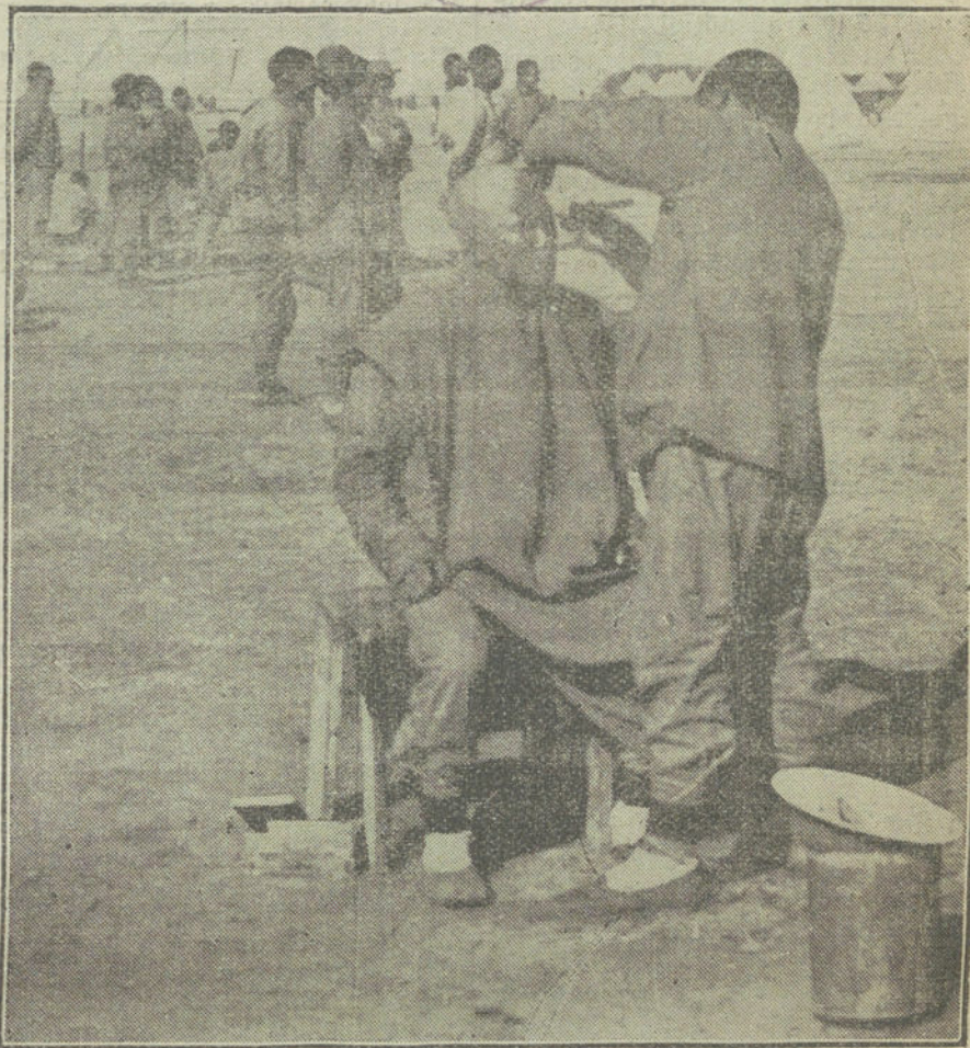
LA VIDA EN CAMPAÑA.—La hora del aso en un campamento de senegaleses, del Norte de Francia.