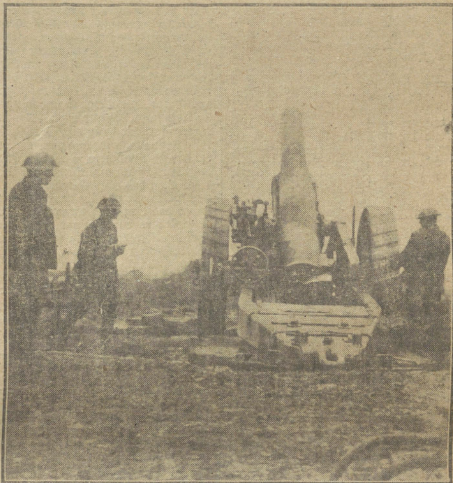
LA LUCHA EN FRANCIA.—Artilleros franceses disparando un cañón de largo alcance.

«Los cartuchos, que en los zocos de estas kabilas llegaron a alcanzar a principios de la quincena el precio de 14 pesetas la docena, han bajado a ocho pesetas, siendo debido este abaratamiento a la importación de bastantes cartuchos que, SEGUN TODOS LOS INFORMES, PROCEDEN DE TÁNGER.»