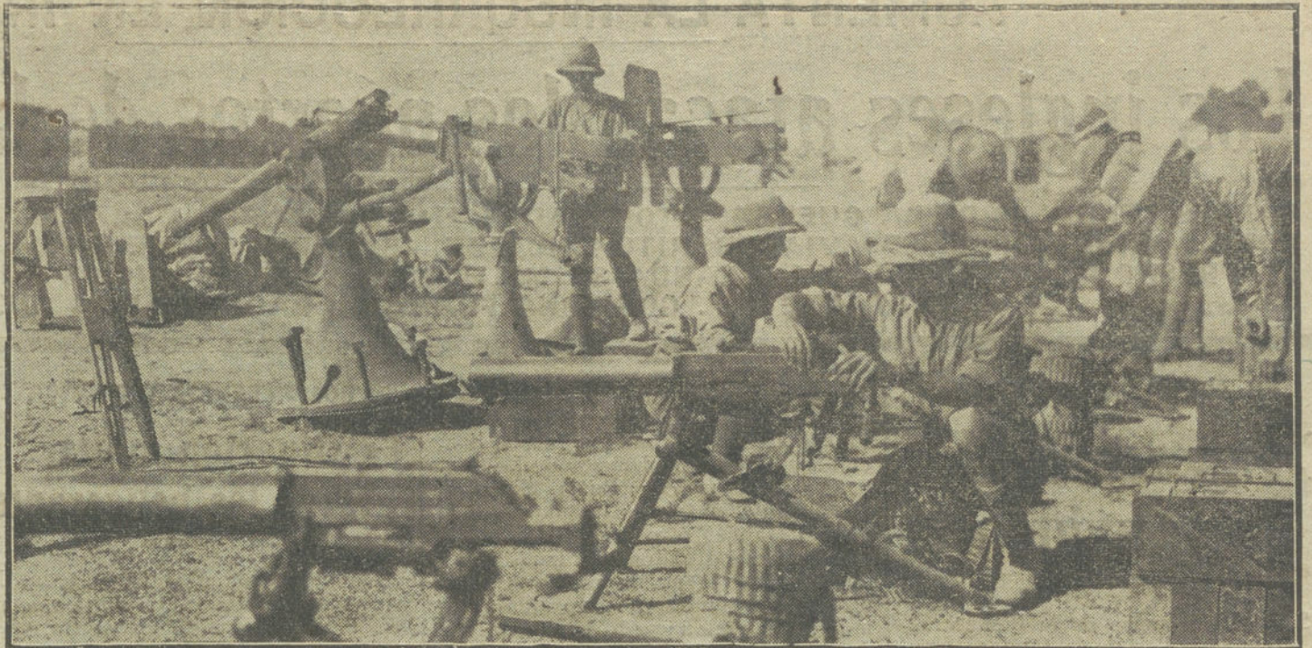
Taller de recomposición de cañones y ametralladoras, en un campamento del Norte de Francia.

Las cartas para el interior, los Estados Unidos, la India y las colonias autónomas deberán franquearse con timbres de un penique y medio; las tarjetas postales, con uno de un penique. Esta tasa producirá este ejercicio 3.400.000 libras esterlinas. Los timbres sobre cheques costarán dos peniques en lugar de uno. Lo