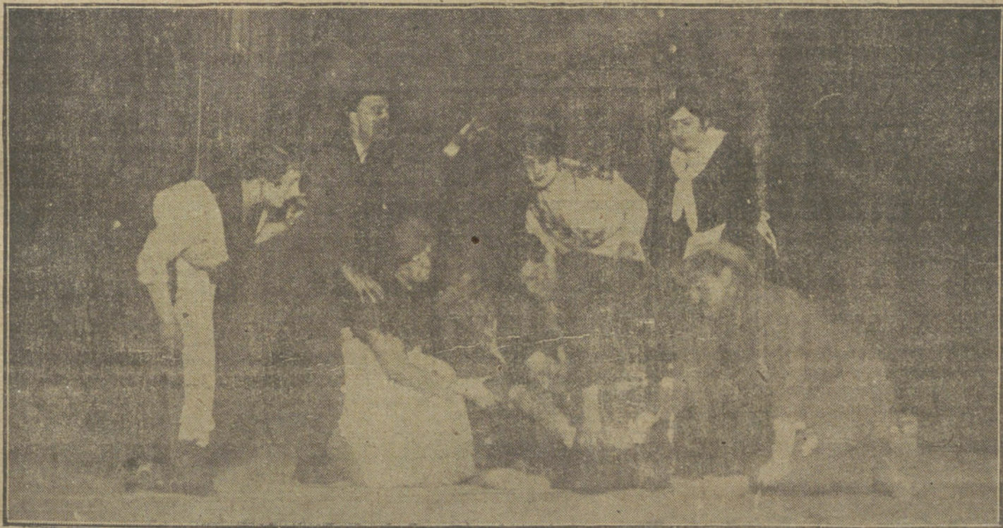
Una escena de «La mala vida», drama de Vallmitjana, que se estrena esta noche en el teatro de Eslava.

Pero antes hemos de ponernos en condición legal de que se nos reconozca este derecho. Es decir, antes tendremos que ocupar toda la frontera de la zona internacional y todo el litoral del Estrecho, desde Punta Altares a Benzú, que son territorios de nuestro protectorado. Porque mientras nuestra dominación no alcance más que a los aduares de Melusa, en los límites de Tánger, y al aduar de Bel-lines, en la costa del Estrecho, la ocupación de esa plaza, como medida de orden, podrá ser discutida por los que