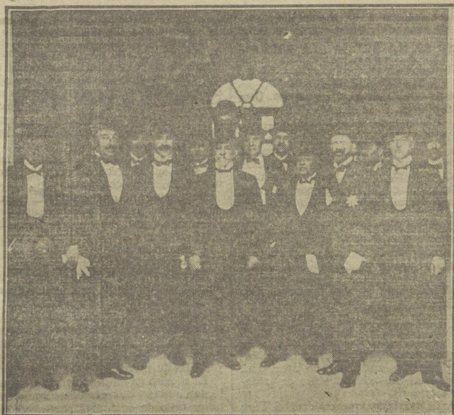
La Mesa del Congreso, que ha ido esta tarde á Palacio á entregar á S. M. la contestación al Mensaje.