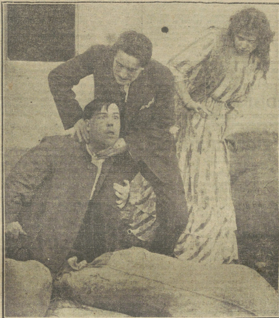
«El señorito, al verse reprimido por Pope Luis, se abalanza sobre él tratando de ahogarlo.» Un momento de la notable película «La España trágica».