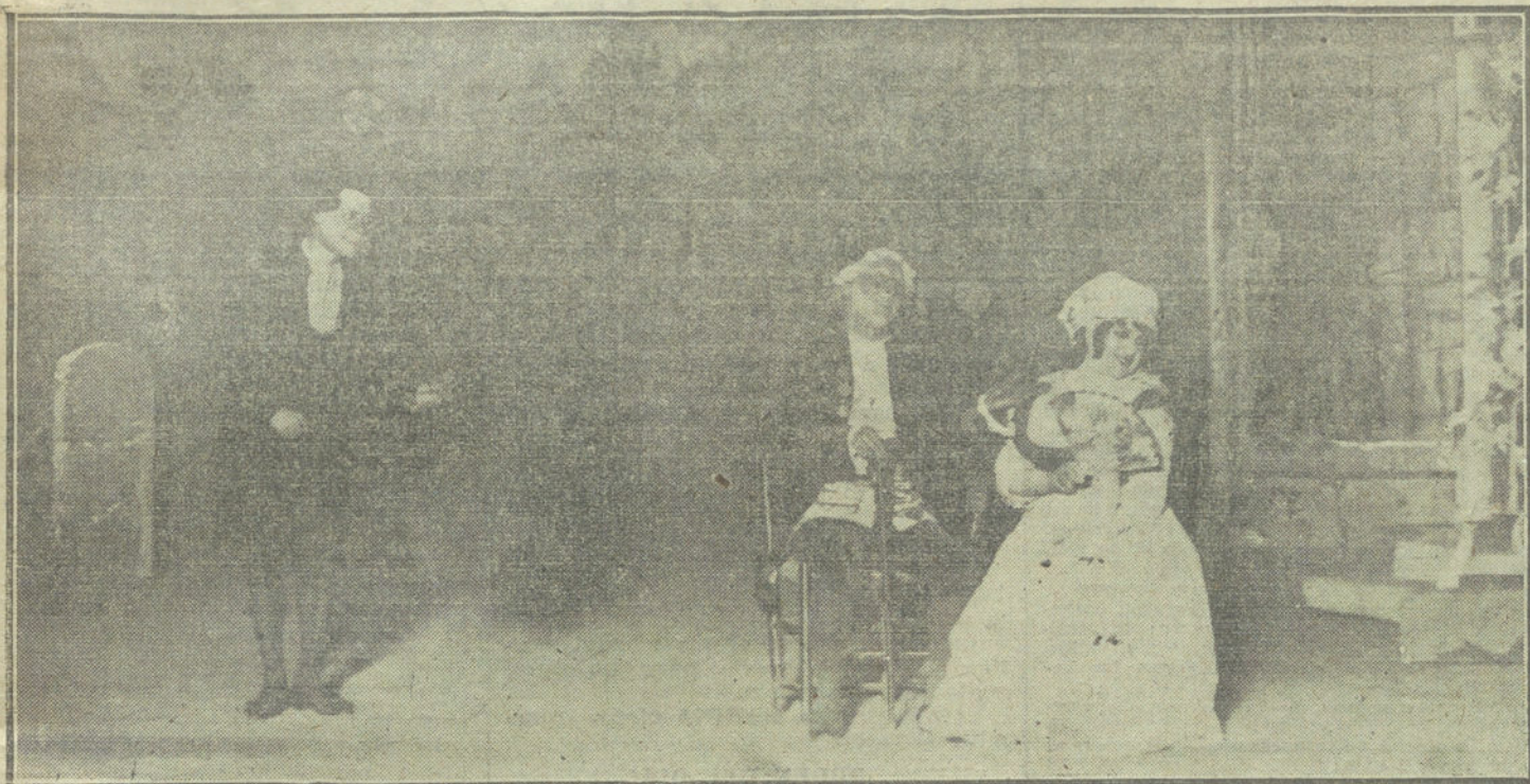
Una escena de «El minué real», obra que se estrena esta noche en el teatro de Apolo.

mana y del bombardeo de París se refleja en la situación de las finanzas francesas y de la Bolsa de París. El Gobierno se ve ante la necesidad de utilizar en creciente medida el Banco de Francia. Mientras desde principios de 1918 hasta el comienzo de la ofensiva alemana, los anticipos del Banco de Francia ascendían a 150 millones de francos semanalmente, aumentaron en la semana del 21 al 28 de Marzo en 300 millones; del 28 de Marzo al 4 de Abril en 800 millones de francos.