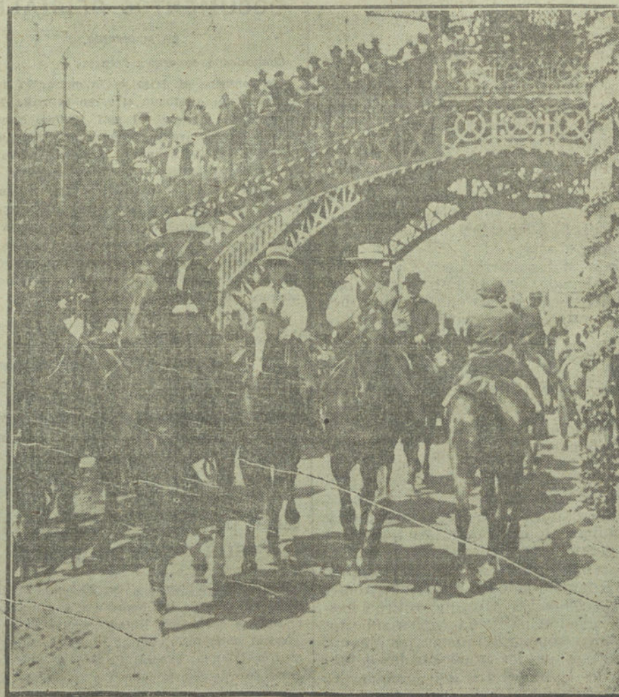
LA FERIA DE SEVILLA.—Un detalle del paseo.