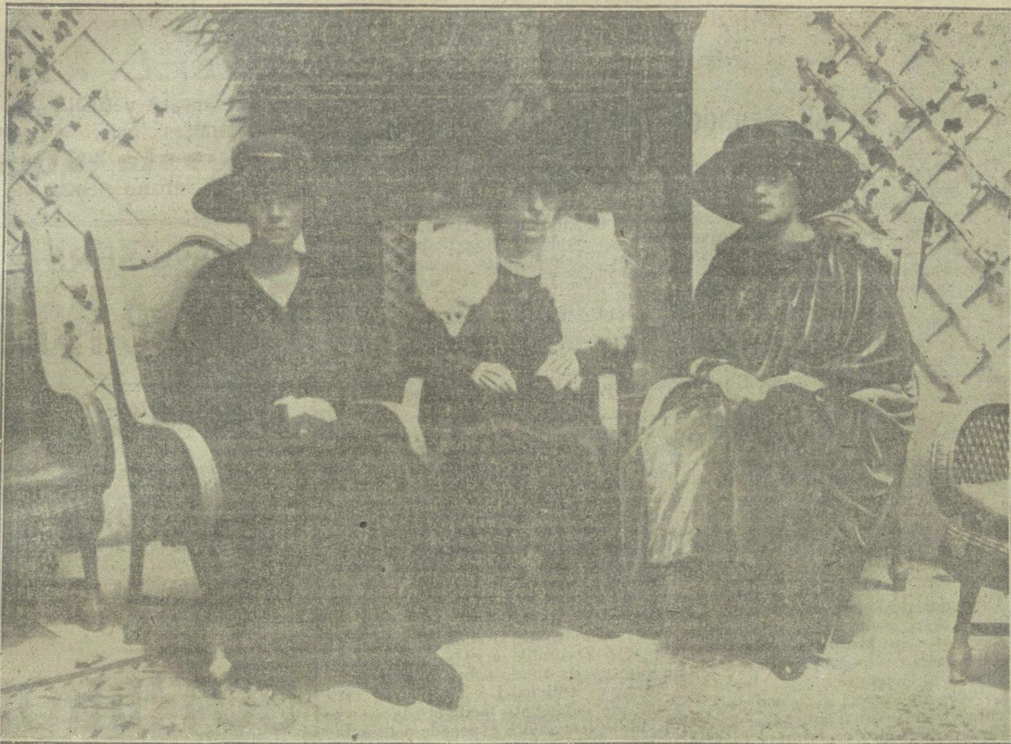
La Princesa Doña Beatriz de Borbón y sus dos hijas en el hall del Hotel Ritz, donde se alojan durante su permanencia en Madrid.