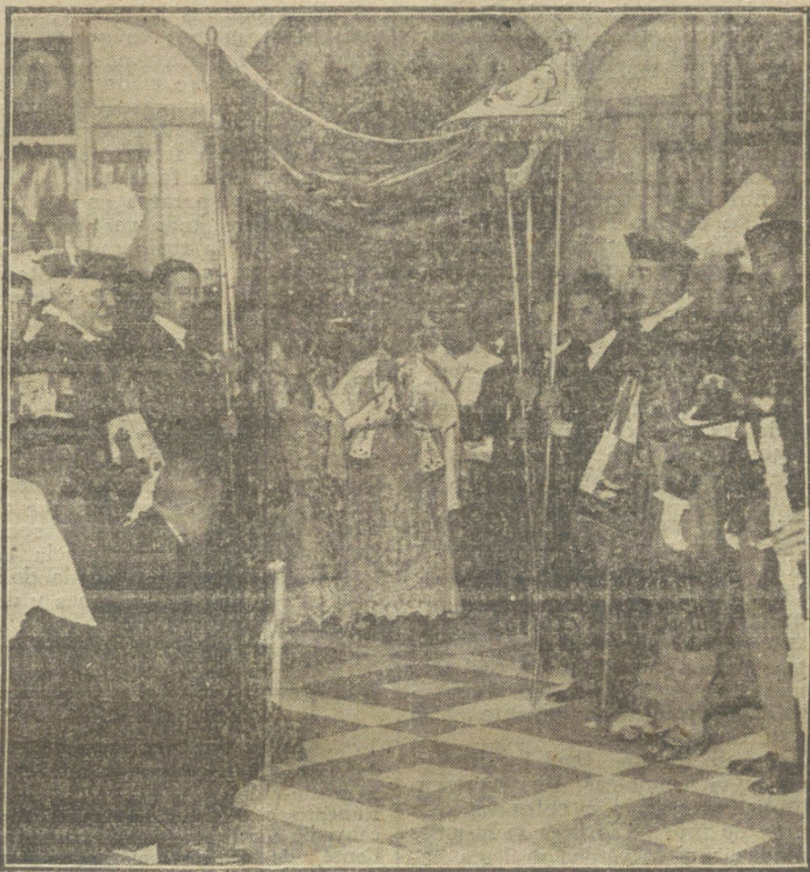
Ceremonia de administrar la Comunión a los enfermos del Hospital general, acto verificado esta mañana.

El día que aborrecer la paz, ese Ejército que hoy pelea dejará el fusil para combatir con la máquina y la herramienta. Una nación estará