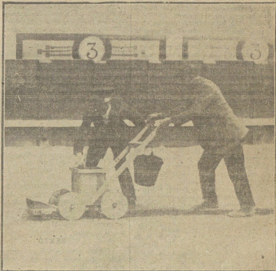
Ingeniero. Aparato que se emplea para el brazado de la raya roja en el ruedo de la Plaza de Toros.

Vamos á ver una corrida de reses «murubeñas», así, con b de burro, como escriben los confectionadores de los carteles de Madrid, ó con v de «vaya cardo!», según rezan los programas andaluces, que deben ser los de «la propia ternera».