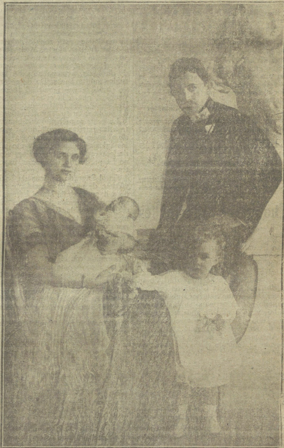
El Emperador de Austria, Carlos I, que hizo cuanto en su mano estuvo por dar fin á la guerra y por salvar los millones de vidas que ha de costar la batalla decisiva que ahora se ríe en Francia. A las insinuaciones de paz hechas por Carlos de Habsburgo, sólo ha respondido Francia—portavoz de Inglaterra—con el gesto desleal de Clemenceau.

¿Han de tolerar las Comisiones tan absurda imposición?... No lo sabemos... Pero en todo caso, no hubo medio de ocultar el hecho de haber sido recibida comunicación de la carta del