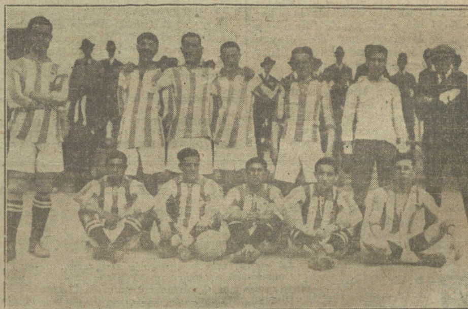
El equipo de Huelva, que ayer jugó un interesante partido de foot-ball con el Madrid F. C.

Exasperados los madrileños por la saguntina defensa de los onubenses, se hartaban de hacer desafortunados futbolísticos, hasta que siete minutos antes de acabar, temiendo vencer al Huelva por un solo gol de penalty, reaccionaron y mar-