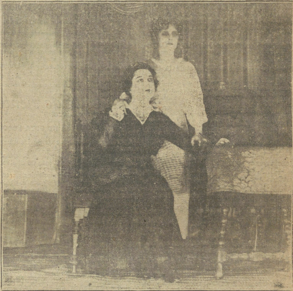
Una escena de «La Inmaculada de los Dolores», obra de Jacinto Benavente, que se estrena hoy en el teatro de Lara.

¿Cuántas veces no hemos visto a un diputado obstruccionando al Gobierno por no haber recibido de éste una merced pequeña! Un señor al que se le negaba una carretera, o no se le atendía en cualquier otra petición, encontraba siempre un artículo del reglamento propicio a amparar su venganza. Citáramos muchos casos; pero es inútil. La opinión sabe que esta es la verdad y la única causa de que la reforma del reglamento tropiece con dificultades. La política del "grifo y el vaso" perderá una