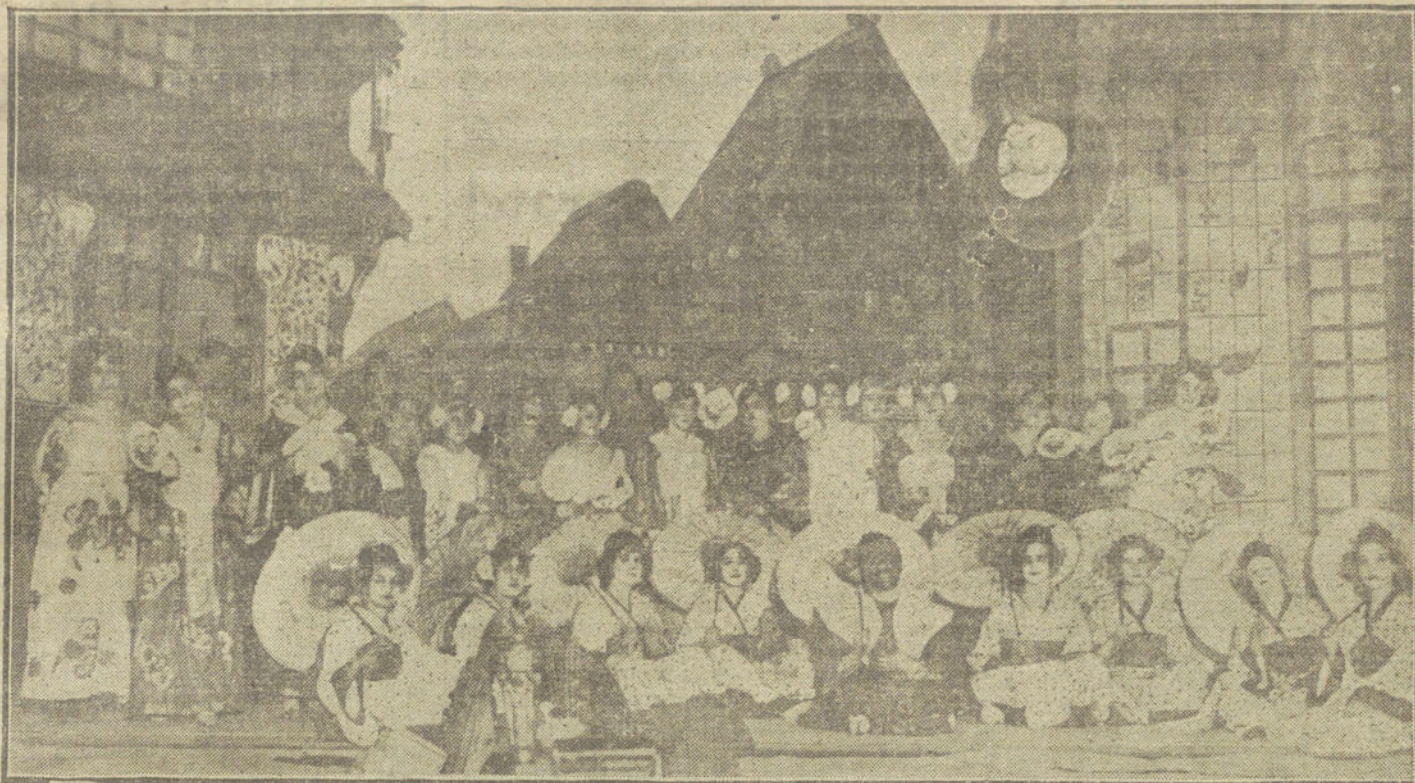
Una escena de «La rosa de Kioto, zarzuela que se estrena esta noche en el teatro Español.

vechar la fuerza corrosiva de las nacionalidades dormidas, con el fin de aiquilar la doble Monarquía. Esta es, termina diciendo el citado periódico de Viena, la política á la cual debemos estar preparados después de la guerra, por parte de Italia. Y Austria-Hungría lo deberá tener presente al estipularse las condiciones de paz.»