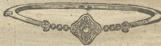
Núm. 9.—Un brillante y diamantes. Pesetas 425.