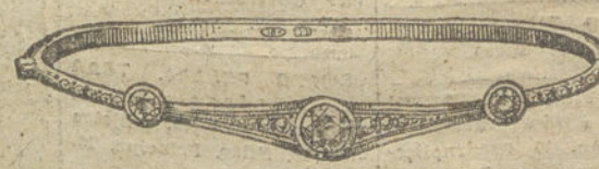
Núm. 15.—Tres brillantes y diamantes. Pesetas 750.