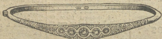
Núm. 7.—Cinco brillantes y diamantes. Pesetas 350.