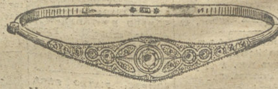
Núm. 12.—Cinco brillantes y diamantes. Pesetas 550.