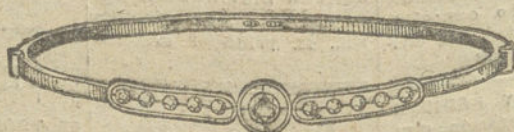
Núm. 2.—Un brillante y diamantes. Pesetas 225.