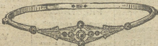
Núm. 8.—Nueve brillantes y diamantes. Pesetas 400.