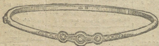
Núm. 1.—Tres brillantes y diamantes. Pesetas 200.