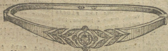
Núm. 13.—Cinco diamantes y brillantes. Pesetas 600.