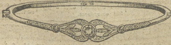
Núm. 11.—Tres brillantes y diamantes. Pesetas 500.