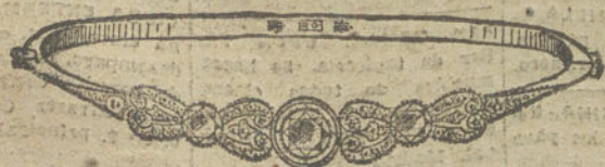
Núm. 16.—Tres brillantes y diamantes. Pesetas 800.