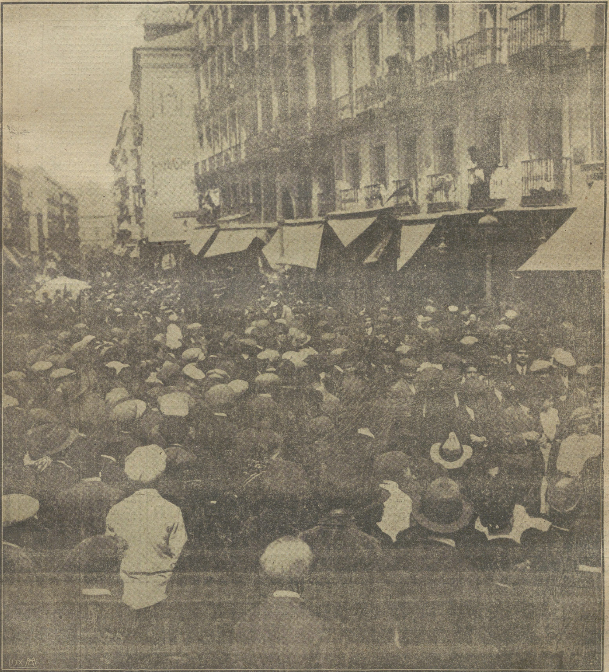
LA MANIFESTACION DEL 1 DE MAYO DESFILANDO POR LA CALLE DEL ARENAL, POR DELANTE DEL HOTEL DONDE SE ALOJA EL DIPUTADO SR. DOMINCO, AL QUE HAN HECHO OBJETO LOS OBREROS DE GRANDES DEMOSTRACIONES DE SIMPATIA.