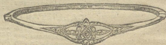
Núm. 3.—Un brillante y diamantes. Pesetas 250.