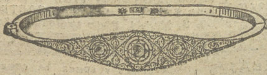
Núm. 14.—Tres brillantes y diamantes. Pesetas 725.