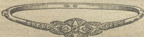
Núm. 5.—Tres brillantes y diamantes. Pesetas 300.