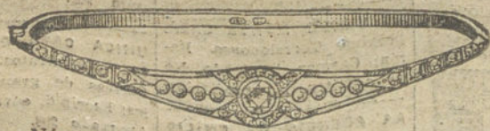
Núm. 10.—Nueve brillantes y diamantes. Pesetas 475.