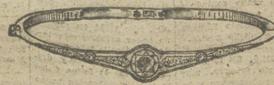
Núm. 18.—Tres brillantes y diamantes. Pesetas 1.000.

Factura de garantía en todas las compras