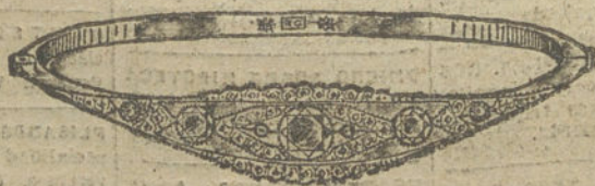
Núm. 17.—Cinco brillantes y diamantes. Pesetas 900.