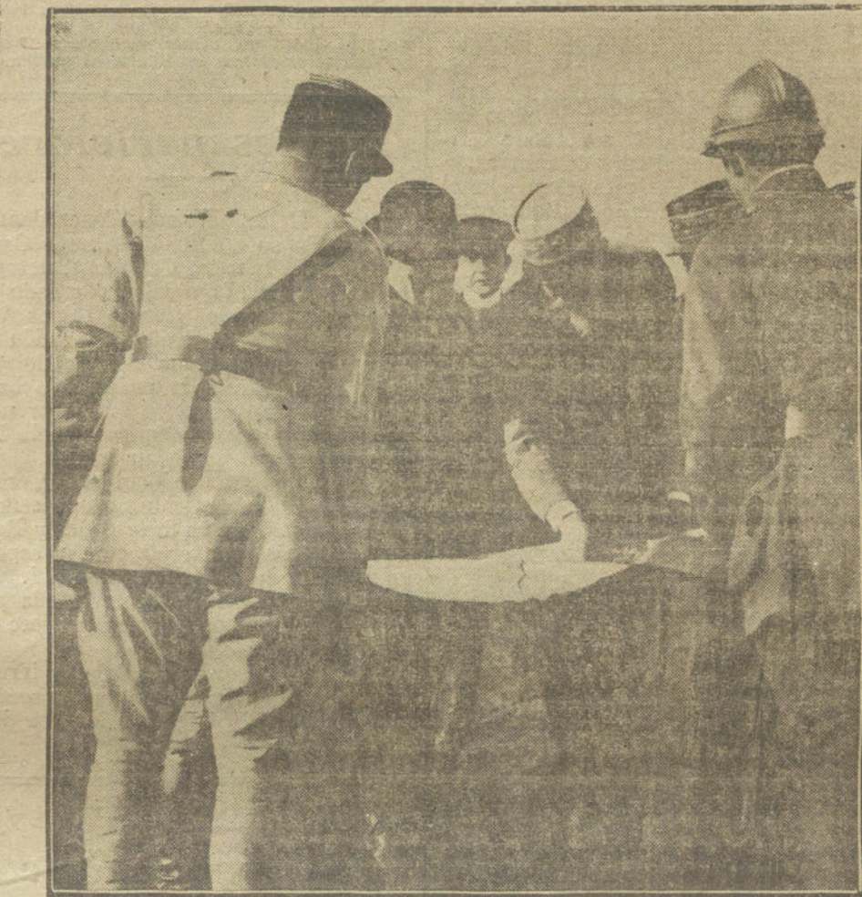
LA LUCHA EN FRANCIA.—M. Clemenceau estudiando en un plano la marcha de las operaciones durante su última visita al frente.

Porque esto de la caridad mal administrada es uno de los factores que más dificultan las buenas intenciones del Ayuntamiento y los distintos organismos de represión. Ya hemos advertido que no basta la acción oficial, si no encuentra eco en las costumbres del vecindario. Con el dinero que esterilmente se reparte por las calles, habría de sobra para atender a las apremiantes necesidades de todos esos po-