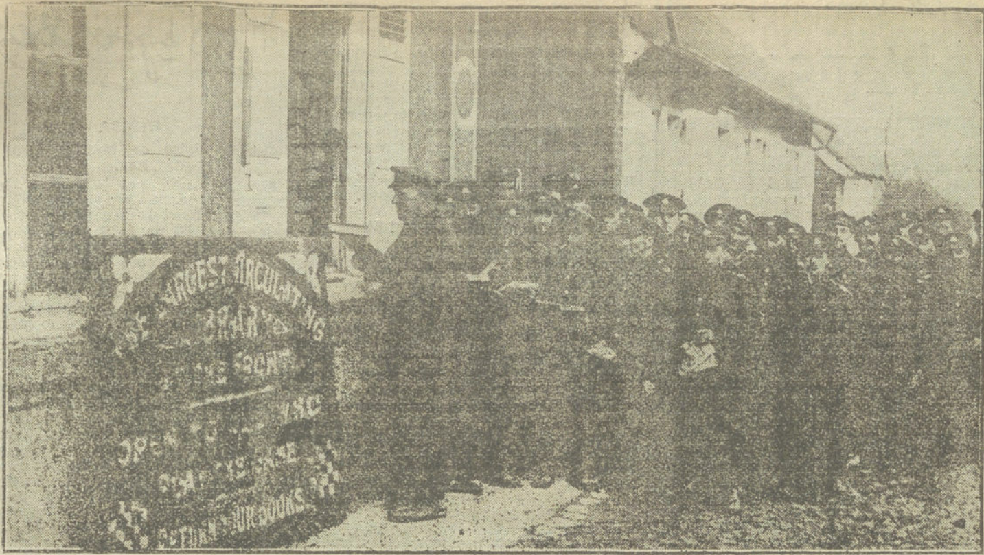
LA VIDA EN SAMPANA.—Soldados ingleses recogiendo libros para leerlos en las trincheras, en una de las librerías instaladas al efecto en las proximidades del campo de batalla.