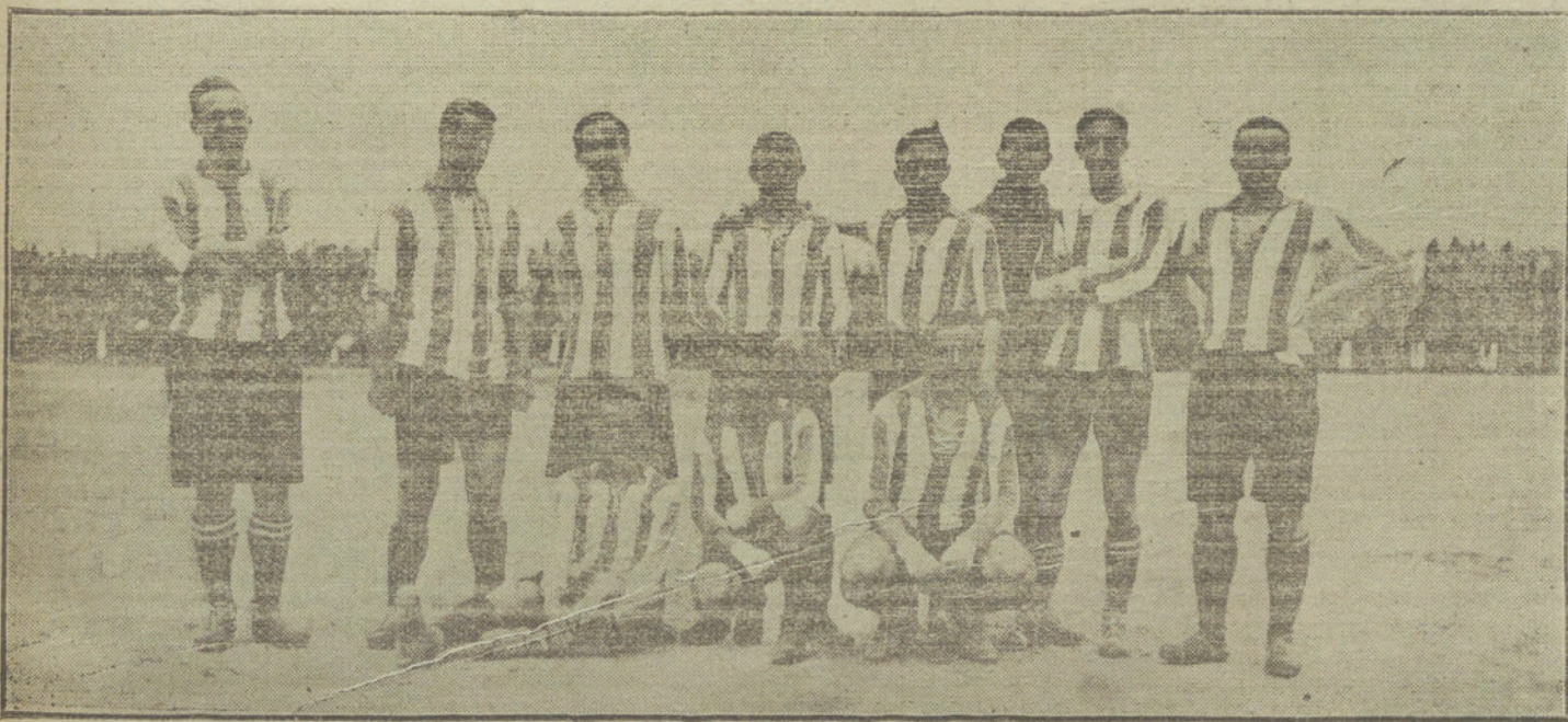
El equipo de Irún, que ganó ayer el Campeonato de España.