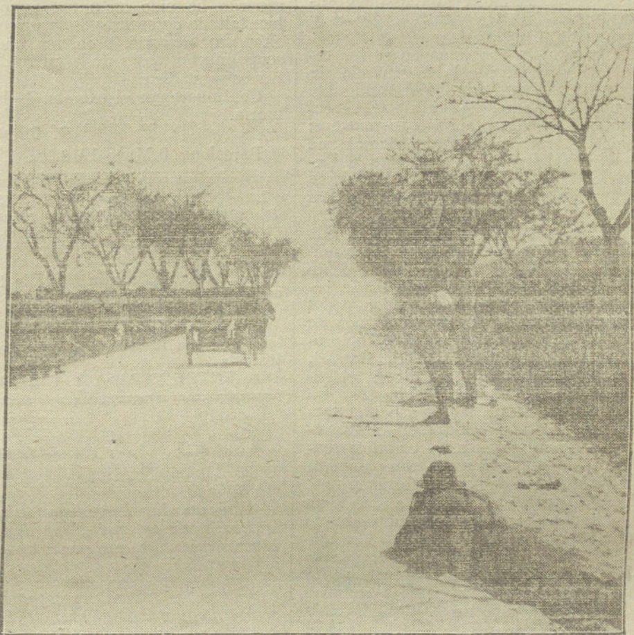
Un detalle de las carreras de motocicletas «kilómetro lanzado», verificadas ayer.