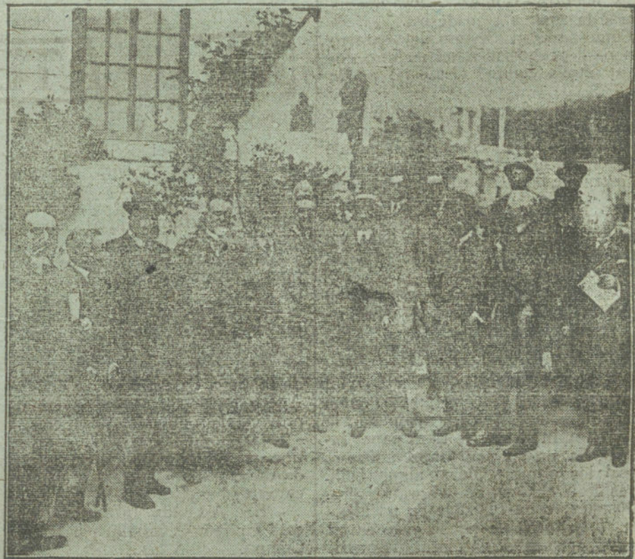
EL BANQUETE DE LOS AGRICULTORES.—El ministro de Fomento al sa- lir de la fiesta celebrada ayer tarde en Parisiana.