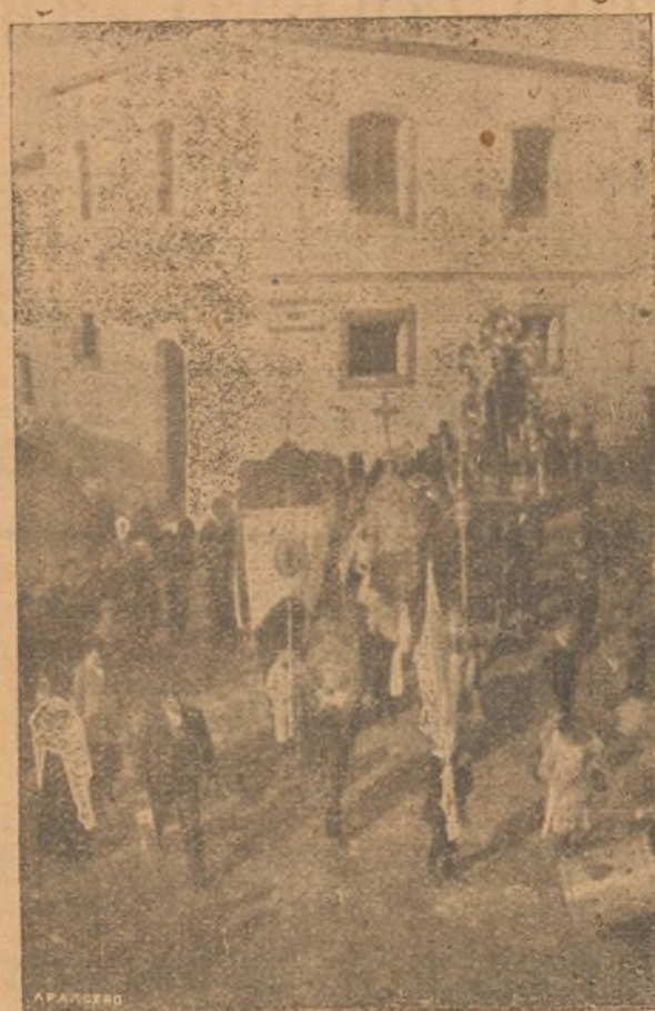
El Santo paseado en triunfo por las calles luminosas del pueblo

No es suficiente esta realidad para disipar la duda injusta, que en el forastero desconocedor de nuestro humanitarismo privado pueda formar la apariencia. Es preciso complementar el hecho caritativo, sumando a los festejos un accidente modificante del criterio ajeno, purificador de forma.