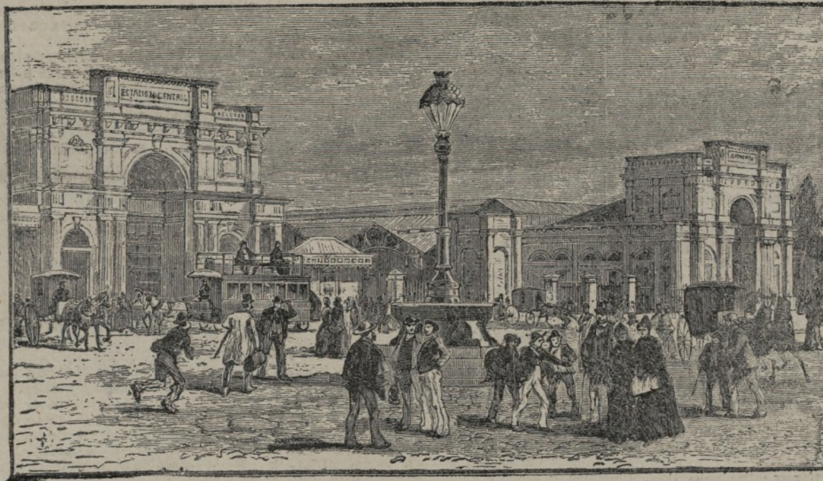
Santiago de Chile.

No es D. Pedro Estanés un escritor desconocido. Sus estudios acerca de la «Teoría del valor» ( Revista de España , 1879) y de la organización económica de las nacionalidades y la libertad de comercio ( La protección y el libre cambio , Barcelona, 1880); su traducción de la popular obra de Bagehot, Physics and Politics , etc., bajo el título de Origen de las naciones (Madrid, 1887), y su intento de aplicar la doctrina positivista al concepto del Derecho Noción del Derecho, según la filosofía positiva ( Revista Contemporánea , 1877), le han conquistado valiosa reputación científica.