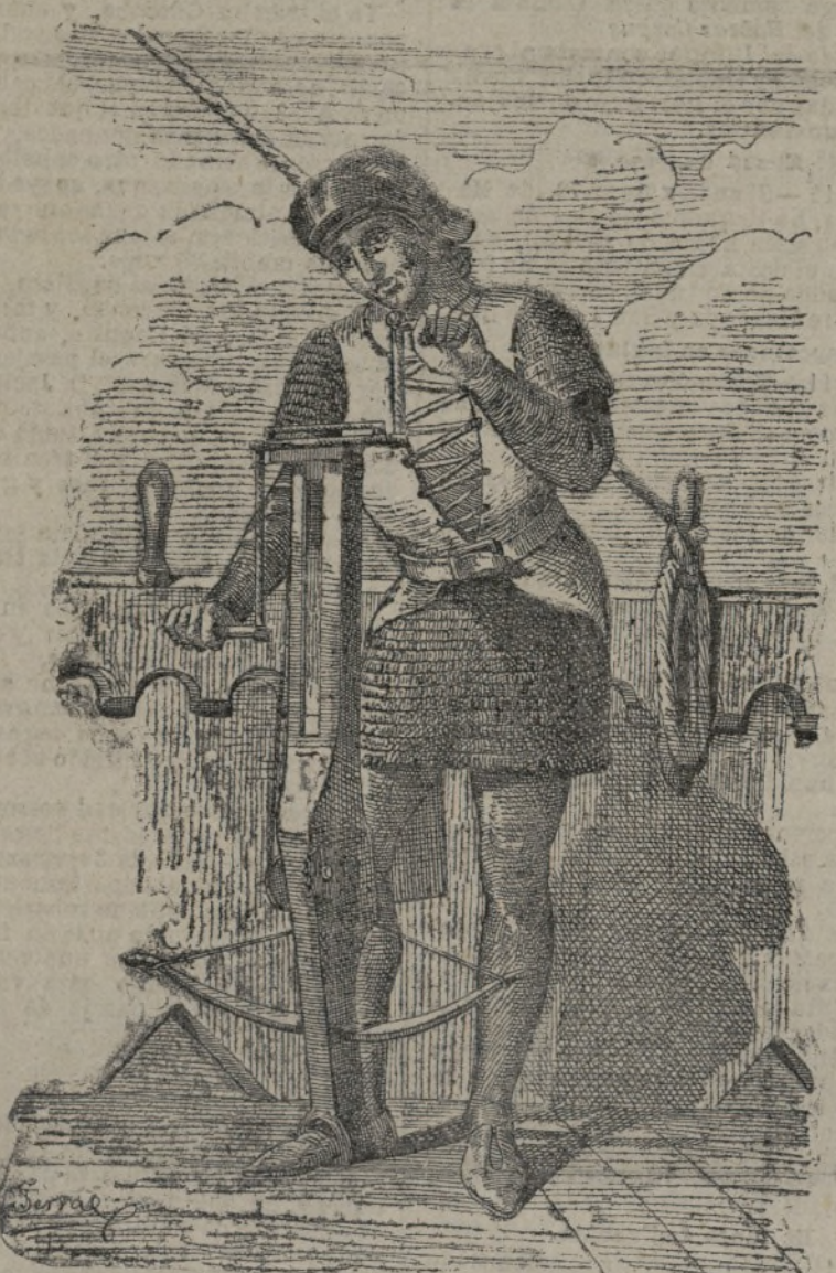
Ballestero de la Edad Media.